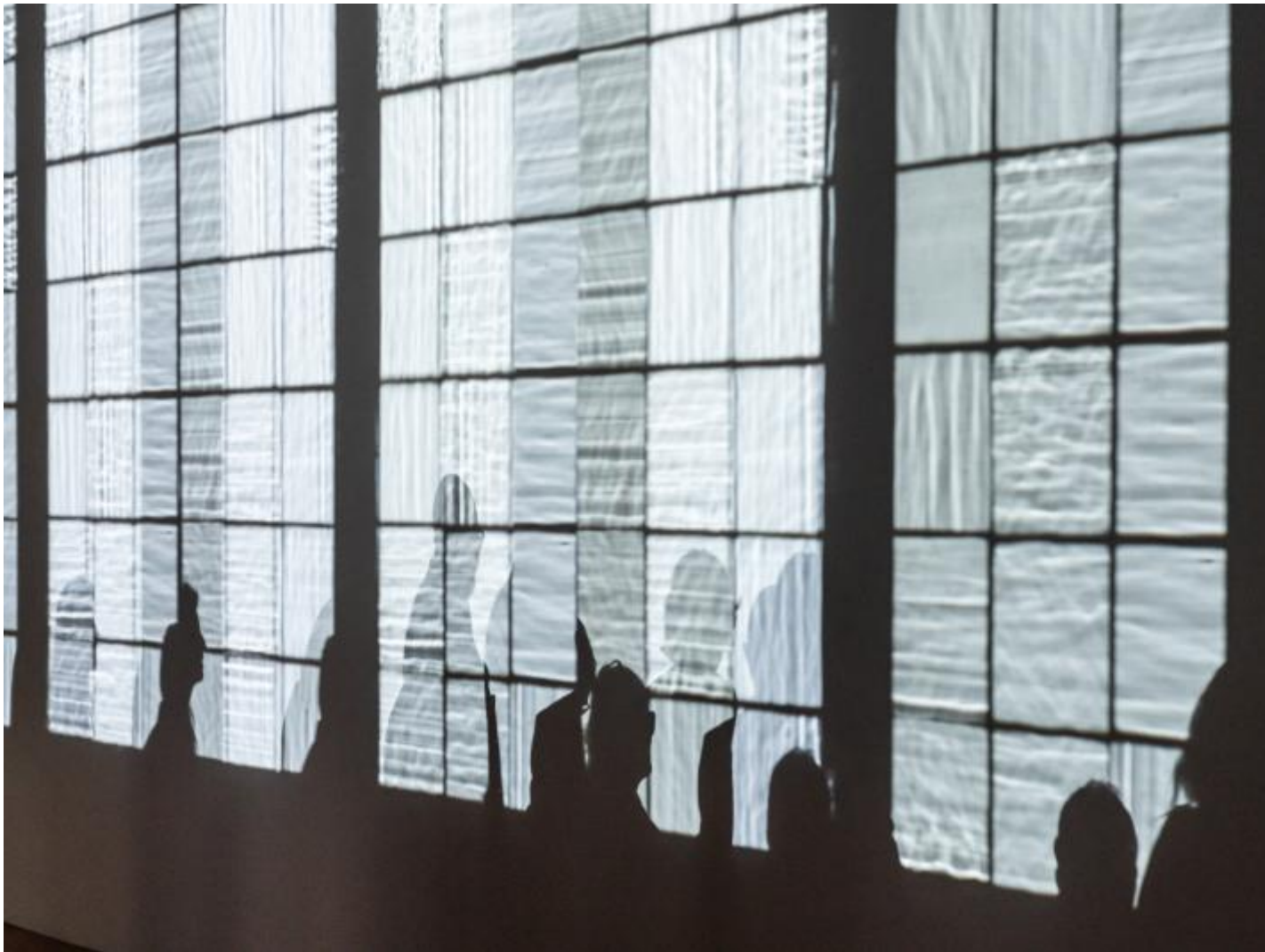
Triple seeing survey , 2022 courtesy of the artist; ©photo Ela Bialkowska OKNOstudio.

Il termine “immersività” – che spesso sembra portare con sé una connaturata vaghezza – è ormai parte imprescindibile del vocabolario della cultura visuale e dell'arte contemporanea. Affermare che la ricerca di Eliasson rientri a pieno titolo nella categoria, dai confini assai nebulosi, di arte immersiva è di per sé una sorta di tautologia e lo stesso vale per l'esposizione fiorentina. È, piuttosto, importante soffermarsi sulla varietà di soluzioni con cui l'artista articola a più livelli il coinvolgimento dello spettatore.