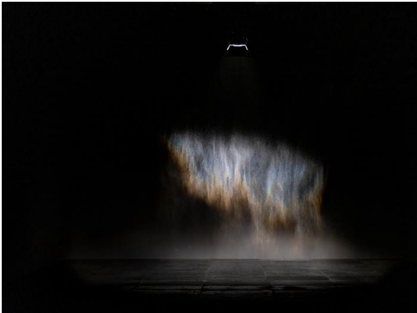
Beauty , 1993, courtesy of the artist, ©photo Ela Bialkowska OKNOstudio.

Motivi che l'esposizione indaga a ritroso con lavori celebri; la forza irradiante della luce calda e dorata di Solar compression (2016) e Room for one colour (1997), a cui il pubblico deve abituarsi, giocoforza, ricalibrando i propri punti di riferimento percettivi; l'atmosfera di straniante di Red window semicircle (2008), versione rimpicciolita del famoso sole di The weather project , realizzato quasi vent'anni fa alla Tate di Londra e caso esemplare di contemplazione partecipata. Quanto a Beauty (1993), la meno recente tra le opere esposte, si può dire che racchiuda il senso della mostra.