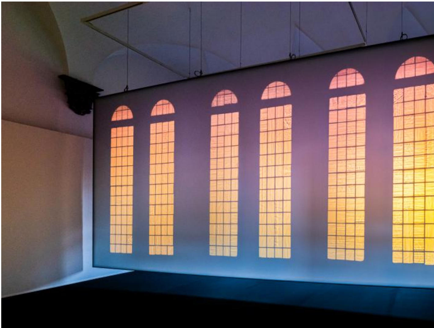
Tomorrow , 2022 courtesy of the artist; ©photo Ela Bialkowska OKNOstudio.

Ciò che accomuna i tre lavori è la loro capacità di mostrarci dettagli delle vetrate quali polvere, rotture e sporcizia con un grado di nitidezza e materialità altrimenti irraggiungibile, di concretezza quasi tangibile anche nel momento in cui la nostra ombra di spettatori vi si avvicina. Sono opere che, a mio parere, non si esauriscono in una pur evidente rielaborazione visiva e concettuale di un complesso architettonico – operazione consueta di Eliasson, ne è esempio recente l'intervento alla Fondazione Beyeler del 2021 – ma che uniscono al valore della messa in scena e della suggestione estetica una riflessione di respiro più ampio. Si tratta, per l'artista, di stimolare nello spettatore una presa di coscienza su un aspetto fondamentale: quello di essere sempre situato o, in altre parole, necessariamente calato in un contesto di relazioni interdipendenti e aperte, dalla cui accettazione dipendono la qualità, la ricchezza e la completezza percettiva e cognitiva del rapporto con le cose che ci circondano.