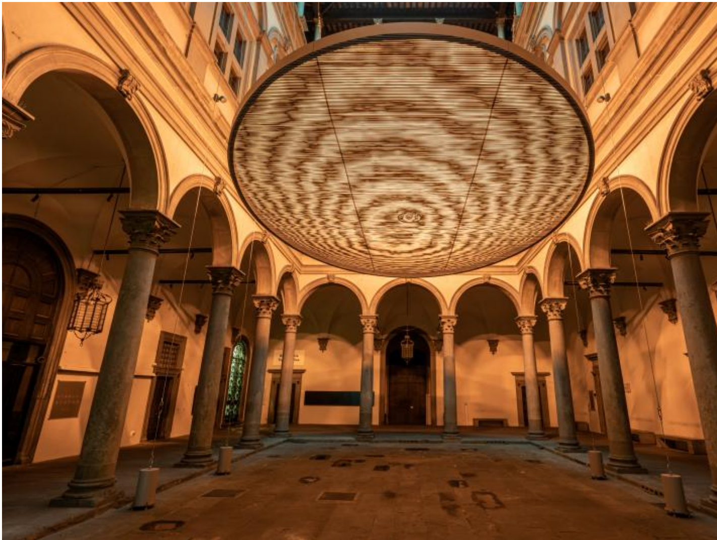
Under the weather , 2022

Non poteva che essere questo il fulcro di Nel tuo tempo , l'imponente personale in corso fino al 22 gennaio a Firenze nella cornice di Palazzo Strozzi. È più che mai opportuno parlare di cornice: tra le diverse mostre curate negli anni da Arturo Galansino nella sede fiorentina, quest'ultima riesce davvero a farsi carico del portato storico e visivo dell'edificio cinquecentesco, apice di un triangolo ideale dato dall'interazione di opera, spazio e spettatore.