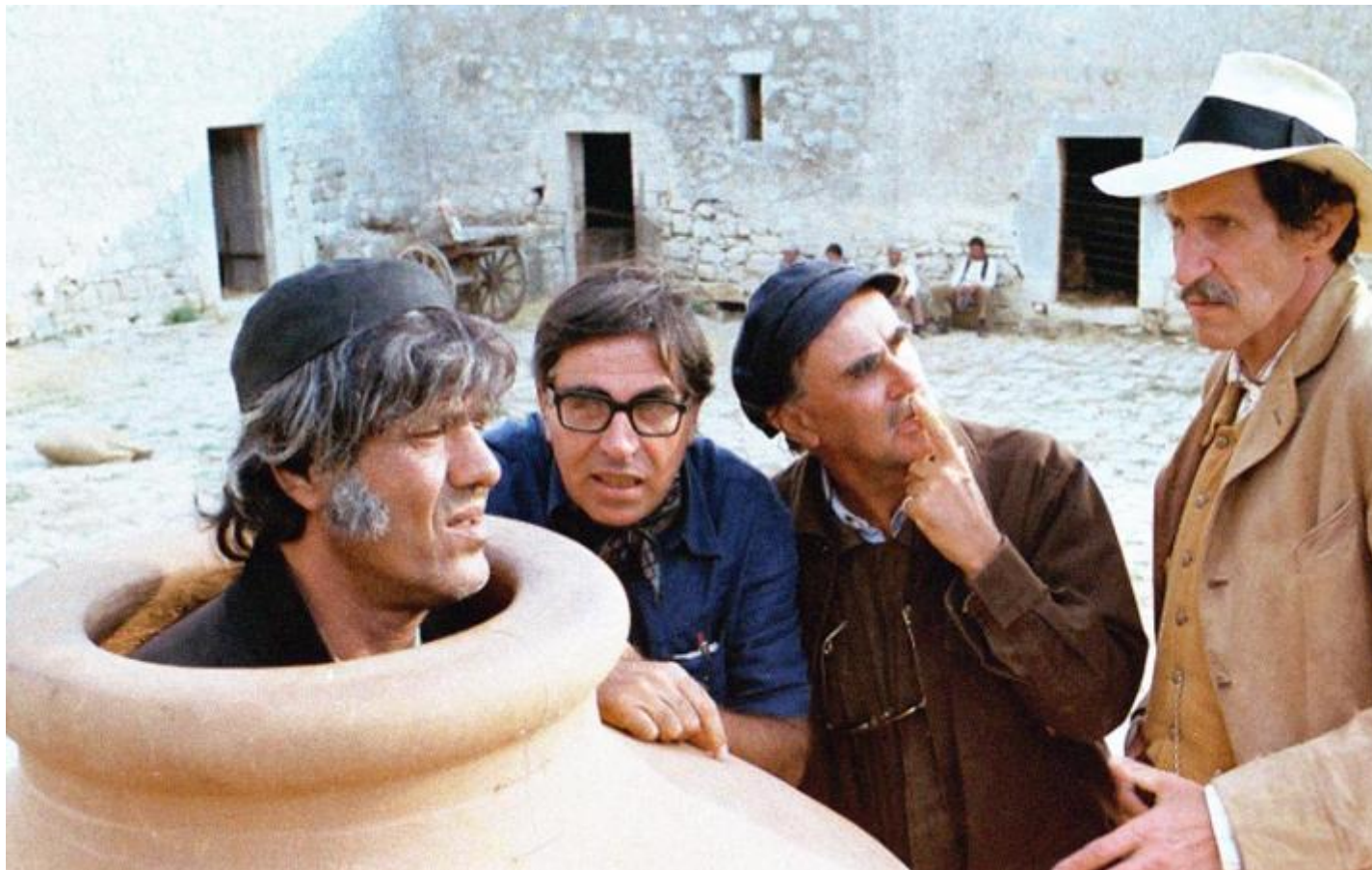
Franchi e Ingrassia con Paolo e Vittorio Taviani sul set dell'episodio "La Giara" (1984).

Separati, Ciccio e Franco sono rimasti nell'immaginario del pubblico gli spettri dell'accoppiata comica. E il cinema d'autore, isolando Ciccio per condannarlo a una prestigiosa solitudine, o con più lungimiranza riunendoli, ha operato una rilettura in senso umoristico, che il Kaos dei Taviani ha definitivamente tradotto in accezione pirandelliana diretta. Eppure è proprio in La giara , il segmento occupato dai perennemente complementari Franco e Ciccio sotto l'egida dei fratelli-registi altrettanto complementari, che il malessere e la drammaticità segreta dell'eroe plebeo, artigiano e analfabeta Franco si percepisce al cospetto della recita del benessere possessivo, giuridico e ignorante del "padrone" Ciccio. La vocazione e la destinazione d'uso alla comicità come marchio di fabbrica univoco di Franco, l'Augusto sottostimato e contrapposto al Clown Bianco Ciccio, lascia nei primi piani a lui riservati dai Taviani tracce inconfutabili di una sofferenza atavica, che fa ridere semmai soltanto per difetto di istruttoria critica e spettatoriale.