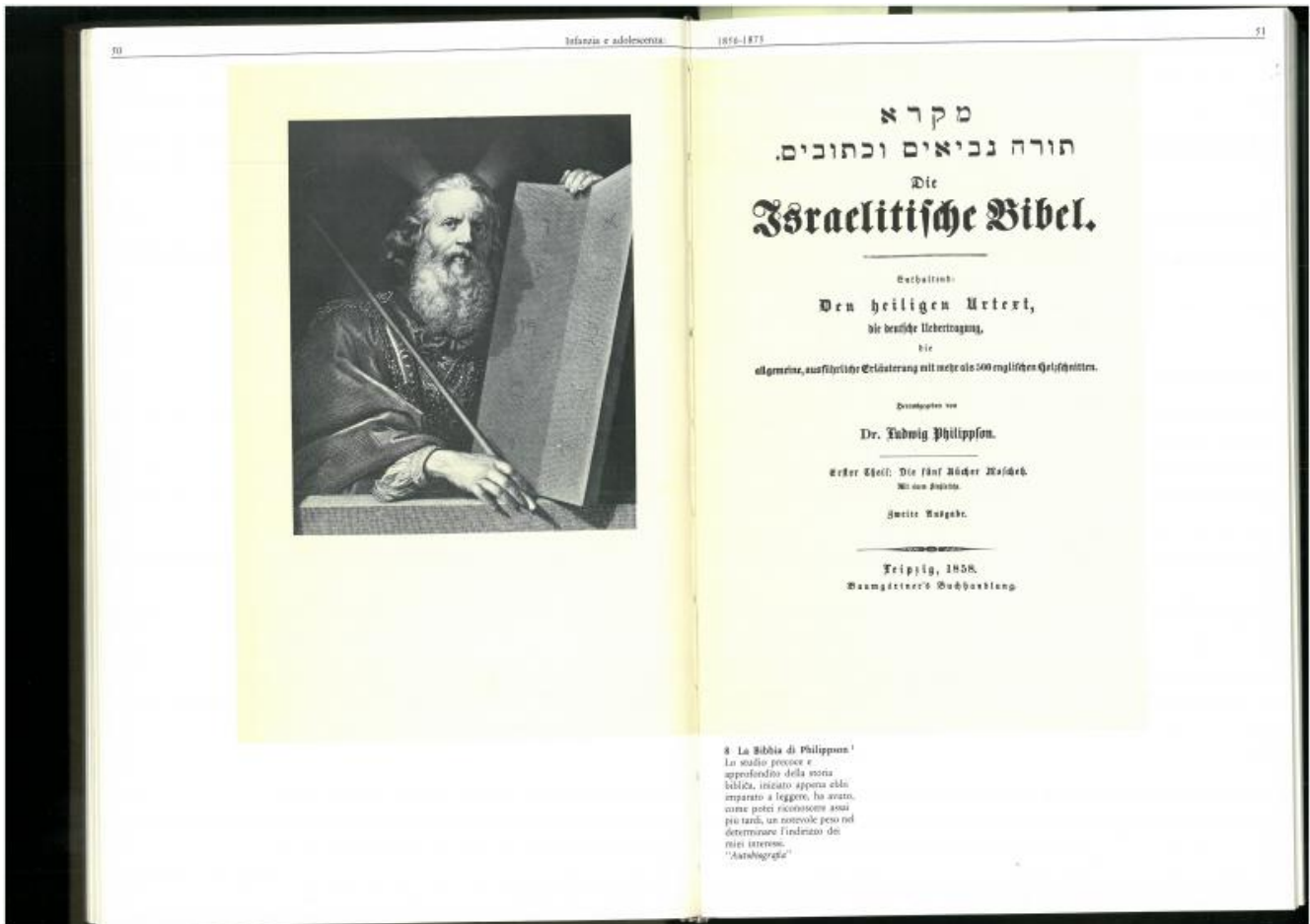
8 La Bibbia di Philippson. Lo studio precoce e approfondito della storia biblica, iniziato appena ebbe imparato a leggere, lo aiutò, come potrei ricordarmi assai più tardi, un notevole peso nel determinare l'indirizzo dei miei interessi. "Autobiografia"

Quindi si può supporre che la decisione di pubblicare il libro su Mosè, rivisto e con un nuovo titolo che dichiara il suo contenuto ideale, cioè il tema-problema della religione monoteista (che è poi la concezione di Dio nell'ebraismo e nel cristianesimo), sia il frutto di una situazione disperata nella quale le "offese" ai sentimenti ebraici e a quelli cristiani debbano essere esposte per amore della scienza, ma anche per mostrare che il dramma ebraico affonda, in definitiva, nel dramma comune della "civiltà". Implicitamente la perdita, agli occhi di Freud, del "narcisismo dell'elezione" rivela che l'attacco nazista all'ebraismo sostituisce un'altra, e ben più perniciosa, pretesa di unicità e superiorità razzista alle convinzioni fideistiche di ebrei e cristiani sulla individuazione della "vera" origine della salvezza. Il tentativo di Freud, malato da anni di cancro, esule, testimone della fine delle istituzioni psicoanalitiche in Germania e in Austria, è qualcosa di gigantesco - mi verrebbe da dire tra l'eroico e il superomistico.