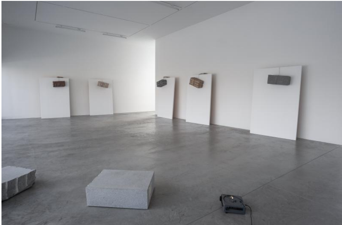
Giovanni Anselmo Senza Titolo, 1984.

trascendenza i Tutto ne abbinano un'altra: è altrettanto possibile che affiori in seno a una determinata situazione ciò che, se valutato retroattivamente, si giudicherebbe impossibile o inesistente in base allo stato di cose accertato fino al momento della sua comparsa.