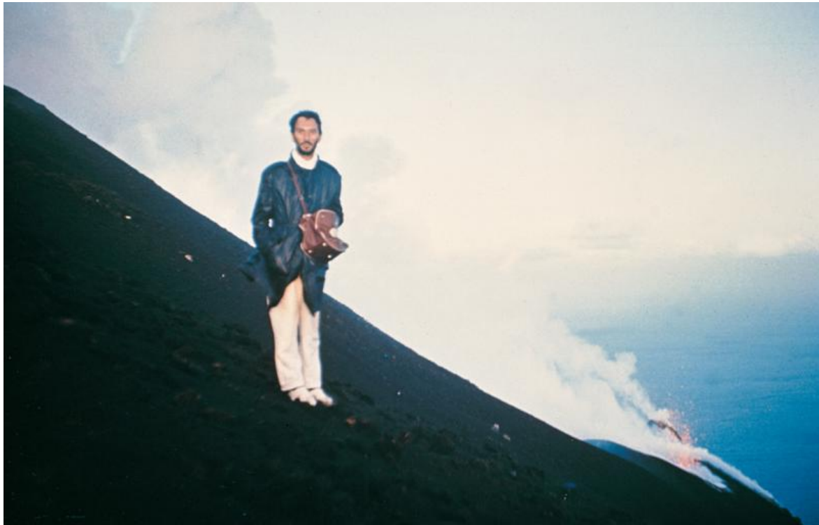
Giovanni Anselmo, La mia ombra verso l'infinito dalla cima dello Stromboli durante l'alba del 16 agosto 1965.

L'elusività del limite di ciò che è nel qui e ora rappresenta un tema decisivo per Anselmo già dagli esordi, databili alla foto La mia ombra verso l'infinito dalla cima dello Stromboli durante l'alba del 16 agosto 1965 , che egli considera non un'opera d'arte, bensì l'immagine-ricordo di un'epifania che segnerà la sua poetica futura. Imprevisto ma risolutivo, l'episodio ebbe luogo una mattina all'alba quando, raggiunta la vetta del vulcano Stromboli, Anselmo prova la vivida sensazione che la propria ombra, dissoltasi nell'aria, fosse inclinata verso l'infinito.