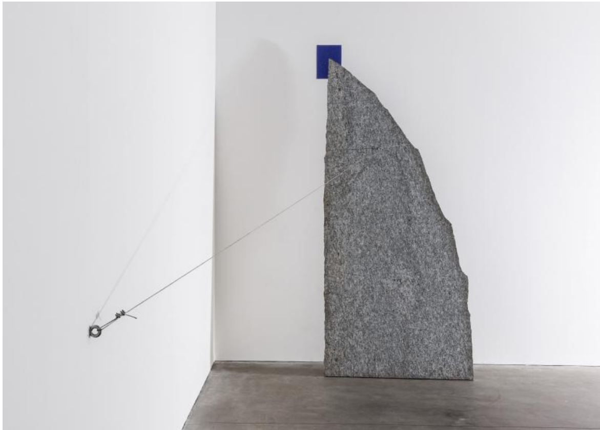
Giovanni Anselmo, Verso Oltremare, 1984.

L'importanza dell'inclinazione è infine confermata da un'opera composta da sei pietre, due collocate sul pavimento, dentro lo spazio espositivo, e quattro fuori, oltre la vetrata, lungo la terrazza della galleria. Formano una linea lievemente sinuosa che descrive una traiettoria di fuga, un'uscita. Sulla prima di esse, è proiettata la scritta luminosa «Dove le stelle si avvicinano di una spanna in più». Il testo prospetta il ridursi di una lontananza nonché l'esistenza di un luogo - la pietra stessa? - la cui occupazione non annulla ma comunque tempera il gap tra il qui e l'immensità dell'altrove. Colpisce, in particolare, il termine "spanna", un'unità di misura approssimativa e antropocentrica: allude alla distanza, diversa da individuo e individuo, tra la punta del pollice e quella del mignolo di una mano aperta con le dita allargate.