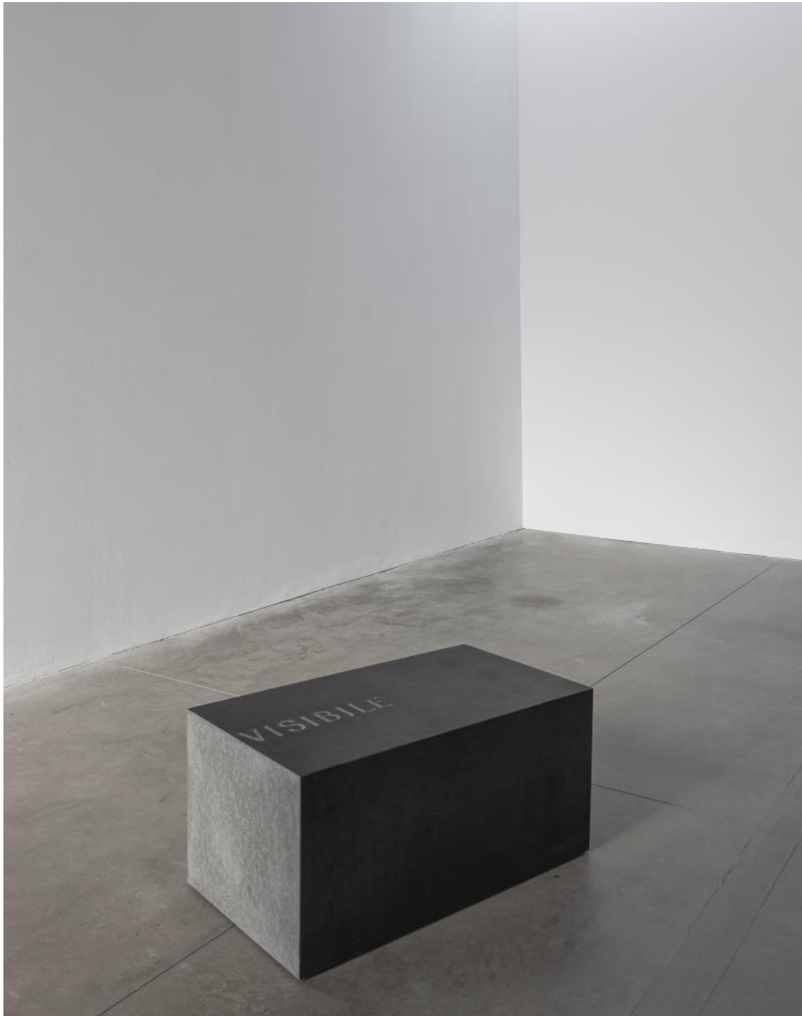
Giovanni Anselmo, Invisibile , 1970-1998-2007.