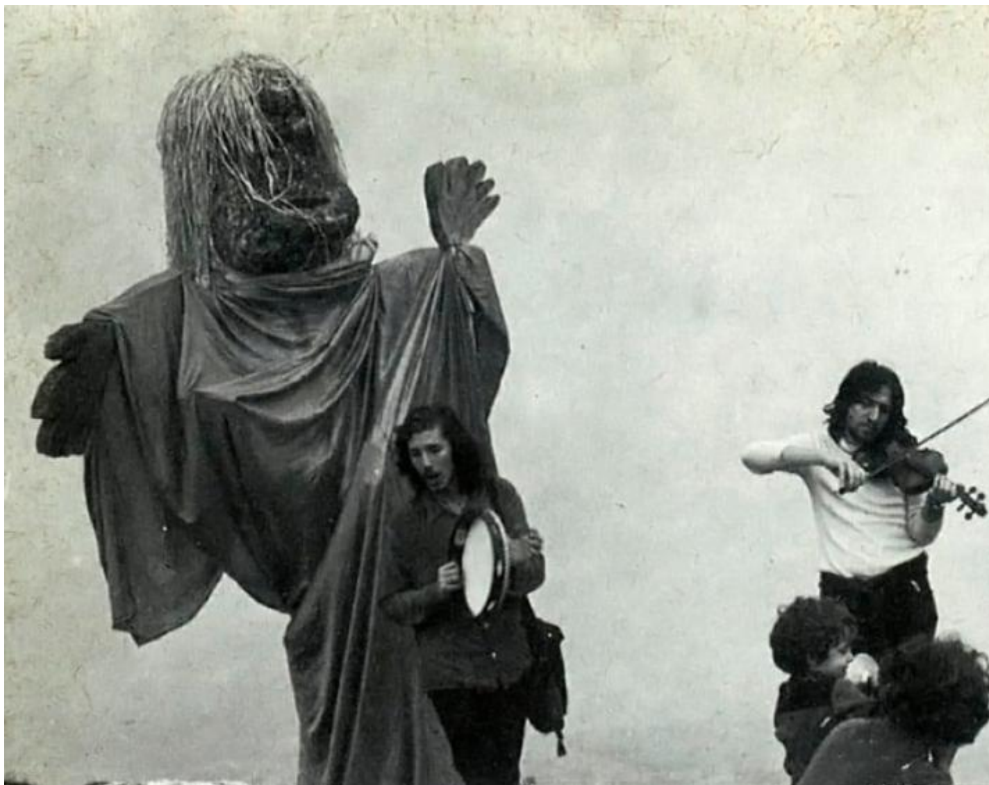
Goriilla Quadrmano Pietra di Bismantova.

Se esiste una creatività sociale, nel senso che Cornelius Castoriadis ha dato a questa espressione, il gran teatro immaginario di Scabia ricostruito da Marino ne ha rappresentato una delle espressioni simboliche più vivide e, sorprendentemente, più efficaci: portato in processione dai "matti" di Basaglia fuori dalle mura del manicomio, Marco Cavallo non si è limitato a fiancheggiare uno dei pochi episodi riusciti di liberazione da un'istituzione totale, in un certo senso lo ha figurativamente guidato.