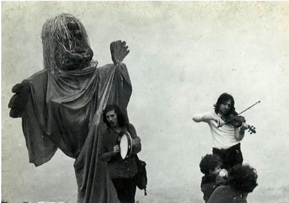
Gorilla Quadrumano Pietra di Bismantova.

Ma quel che è ancora più sorprendente è che alla capacità scabiana di modificare il proprio canto – l'altra frase lucida che si stacca dal Poeta d'oro: "coloro insieme ai quali canti modificano il tuo canto"! – uscendo dai limiti del teatro non sia corrisposta alcuna decapitazione delle sue origini letterarie e della sua, mai smentita, vocazione poetica. "Si tratta sempre – scriverà il loro stesso autore nel 1983 – di ricercari sulla forma e la scrittura del teatro (o della scrittura tout court), che a me sembrano legati insieme da un sistema unico." La forma, che per Giuliano Scabia, affiora dall'informe come Afrodite dalla schiuma dei flutti.