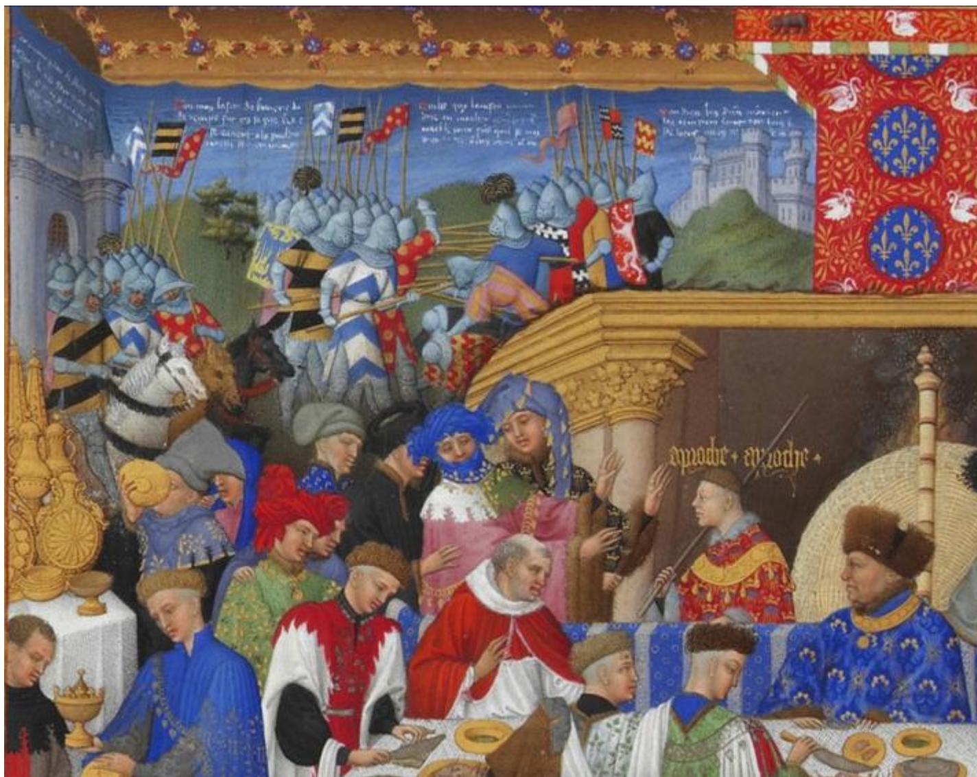
Très riches heures.