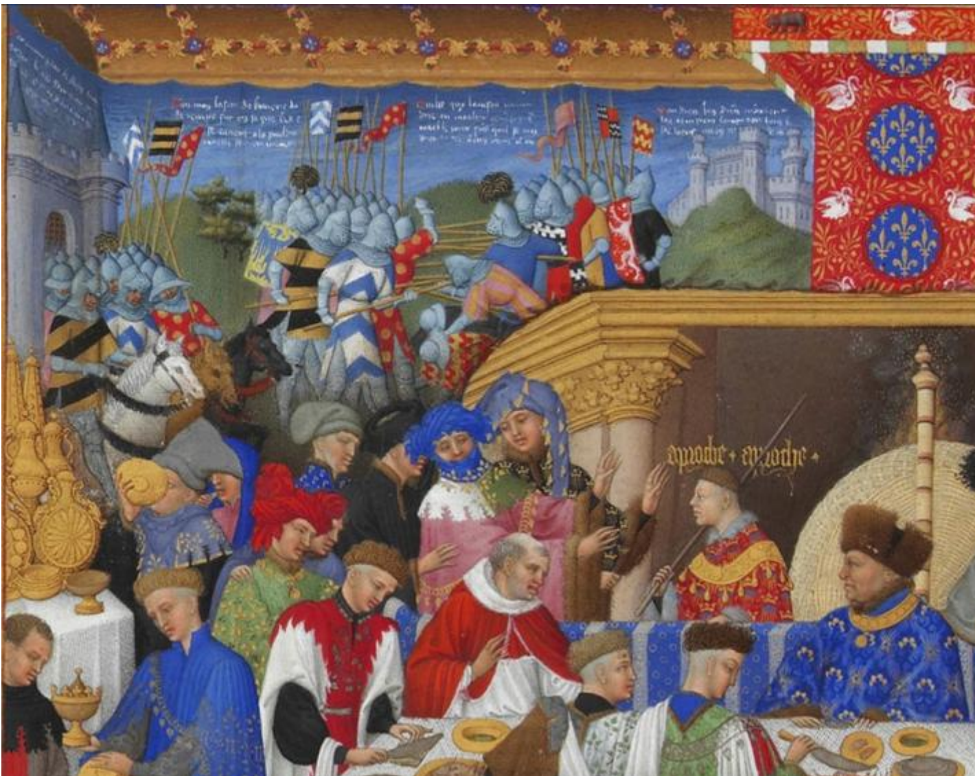
Très riches heures.