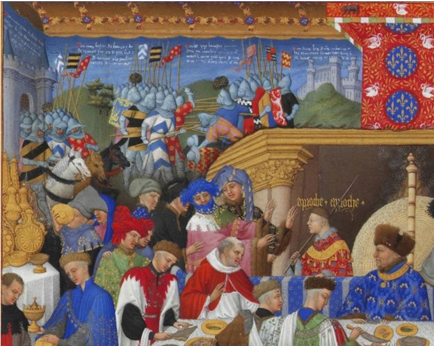
Très riches heures.