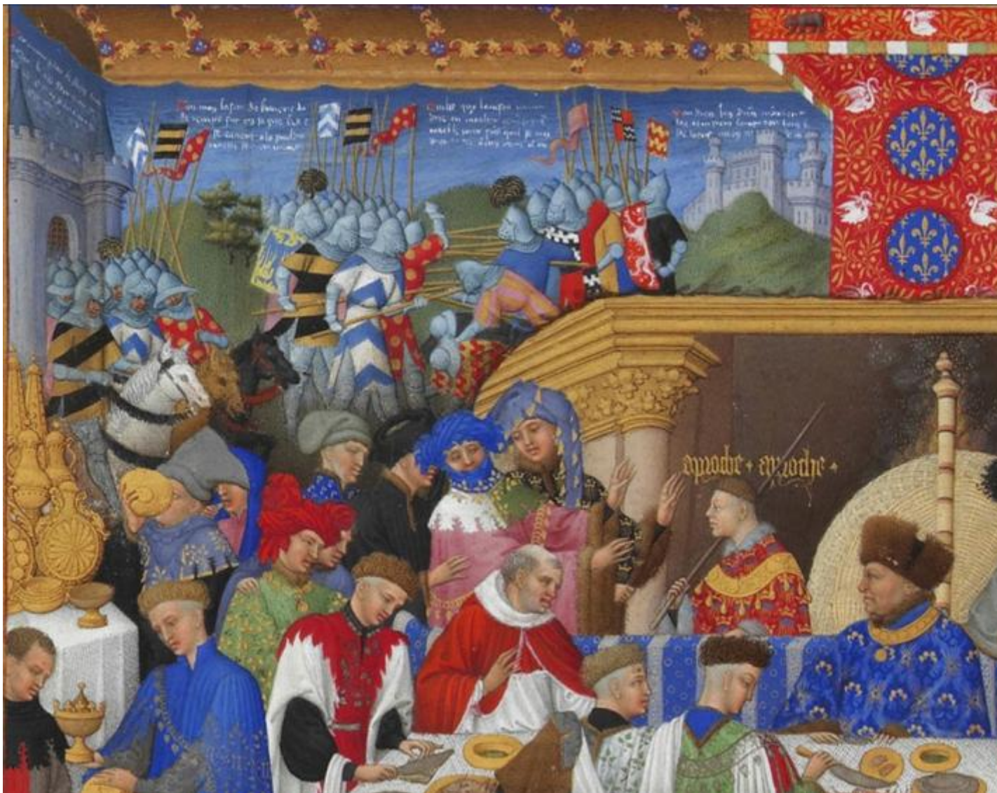
Très riches heures.