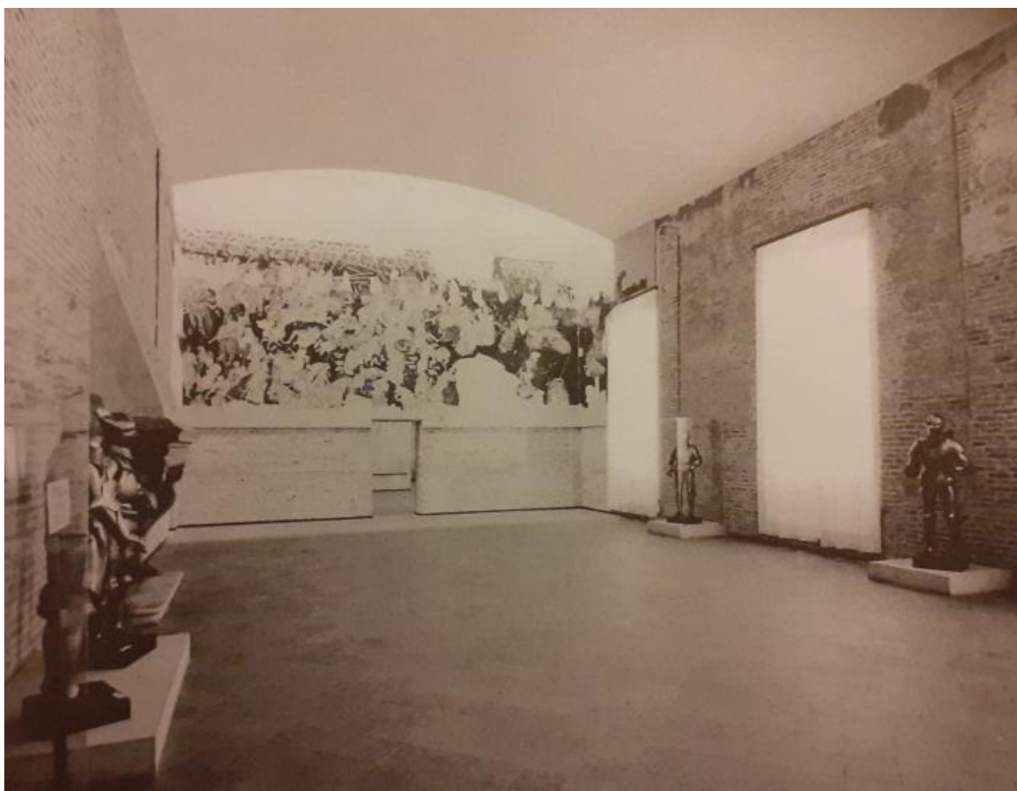
La sala di Pisanello nella mostra del 1972.

Dietro alla clamorosa scoperta resa pubblica nel 1969 c'erano le ricerche condotte per anni da una grande figura di soprintendente, Giovanni Paccagnini (1910-1977). Sono gli anni successivi alla mostra mantovana su Andrea Mantegna (1961), esposizione di grande valore scientifico, come di notevole successo di pubblico. Anche la scoperta del ciclo di Pisanello divenne visibile a tutti nella mostra di tre anni dopo, nel 1972.