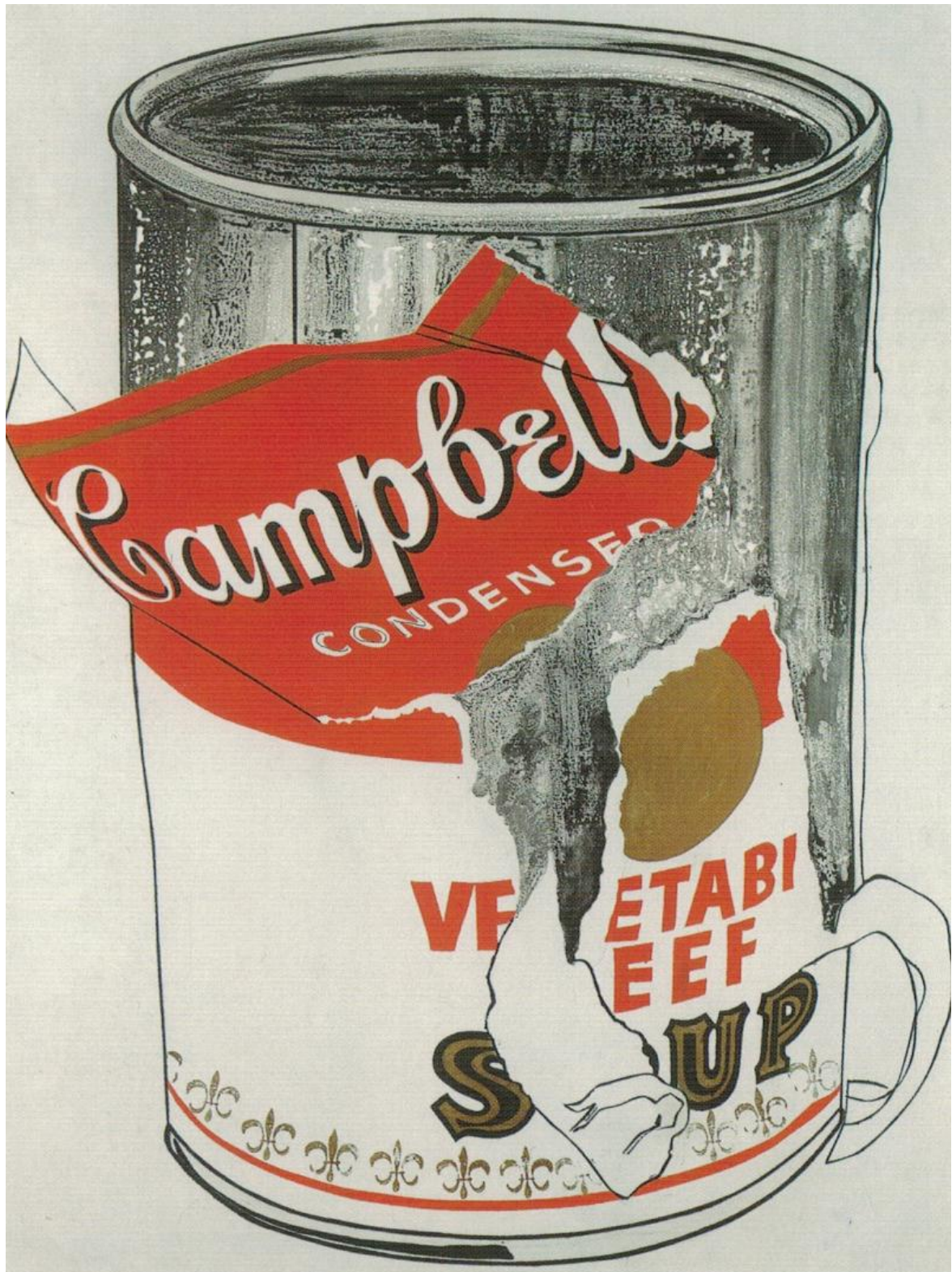
Andy Warhol, Big Torn Campbell's Soup Can , acrilico su tela, 1962, Kunsthaus, Zürich.

Il percorso si conclude con Jean-Michel Basquiat (1960-1988), pittore statunitense di famiglia borghese haitiano-portoricana, ma che ha sempre voluto presentarsi come artista di strada, irrequieto, irriverente e irregolare, che ha infranto nella droga la sua vita buttando via il suo talento come i mucchi di denari stropicciati che teneva in tasca. Basquiat sembra portare al limite l'itinerario del suo idolo e amico Andy Warhol: la sua opera parte dai graffiti provocatori, firmati Samo ( The