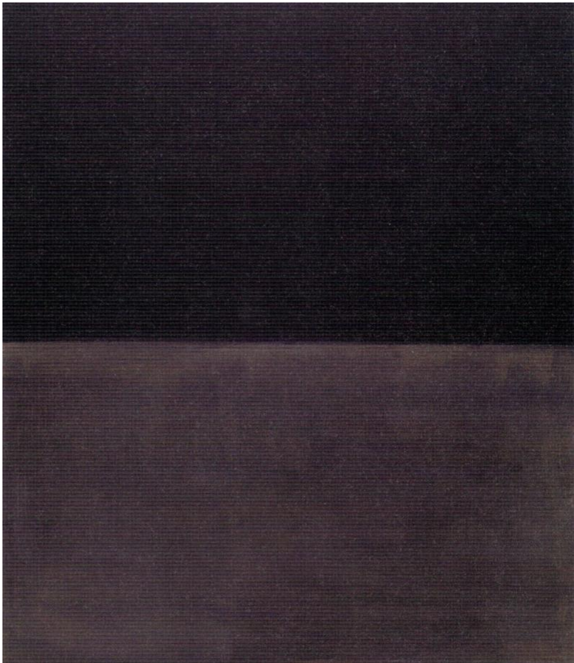
Mark Rothko, Untitled (Black on Grey) , acrilico su tela, 1969-1970, Solomon R. Guggenheim Museum, NY.