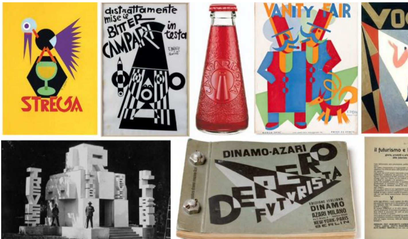
Fortunato Depero. In alto: manifesto per il liquore Strega , 1928; manifesto per il Bitter Campari , 1928; Bottiglia del Campari Soda , 1932; copertina di Vanity Fair , marzo 1931; copertina di Vogue , 1949. In basso: il Padiglione del Libro per la casa editrice Treves e Bestetti-Tumminelli alla III Biennale di Arti Decorative di Monza del 1927; Depero futurista 1913 – 1927 , meglio noto come Libro Imbullonato Manifesto dell'Arte Pubblicitaria, 1932.