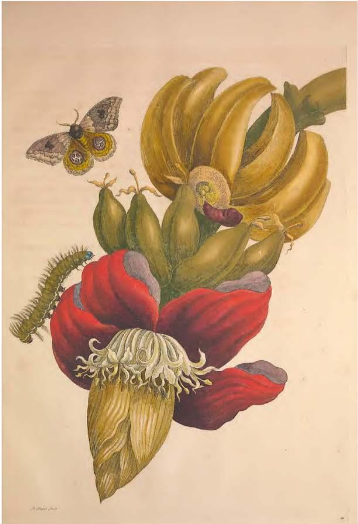
Fig. 32 – Maria Sibylla Merian, Metamorphosis insectorum Surinamensium , 1705, Tav. XII