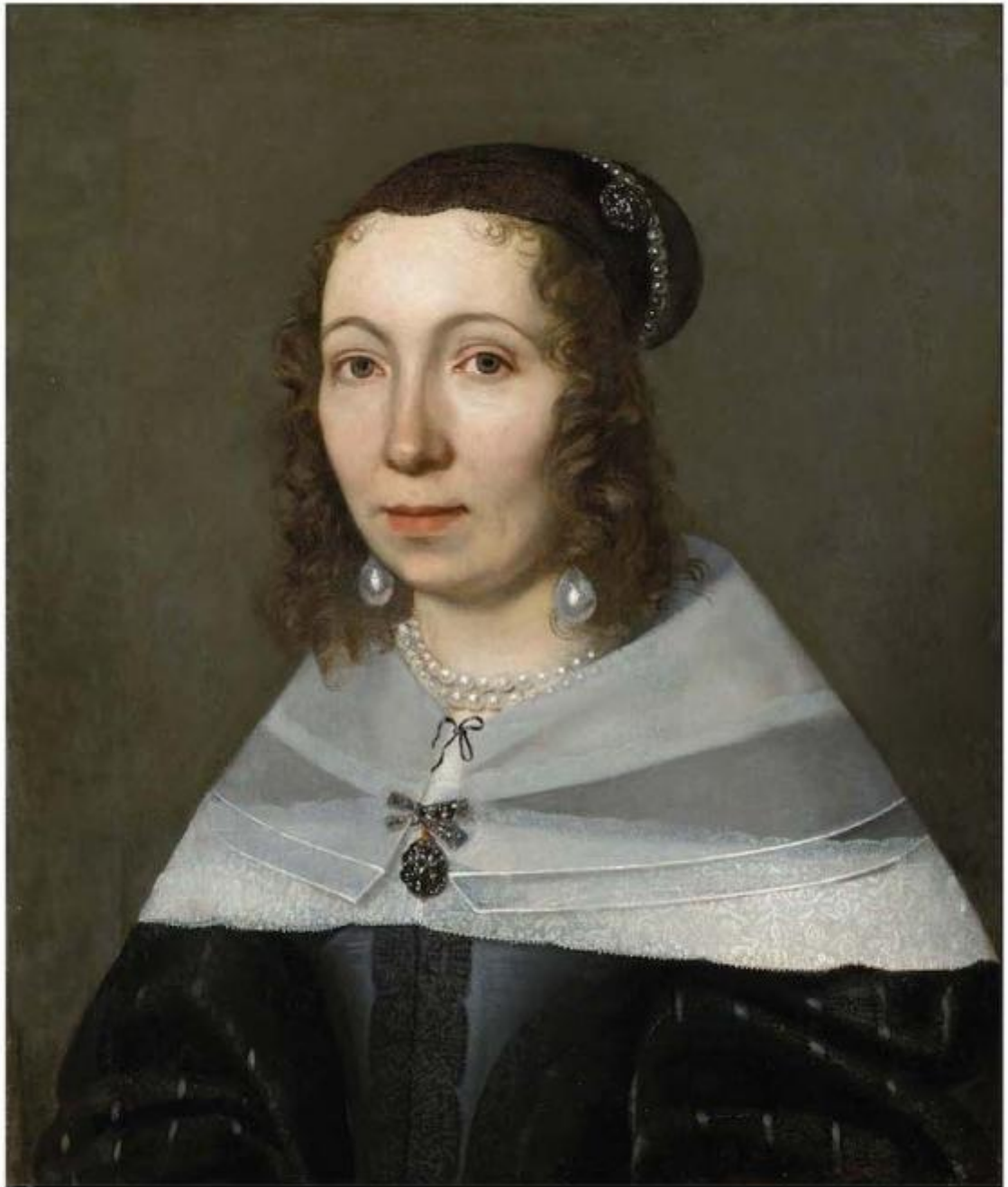
Fig. 7 – Jacob Marrel (?), Ritratto di Maria Sibylla Merian , 1679