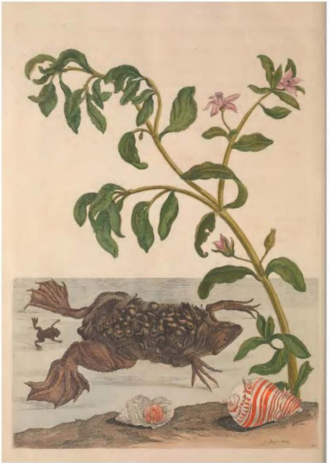
Fig. 44 – Maria Sibylla Merian, Metamorphosis insectorum Surinamensium , 1705, Tav. LIX