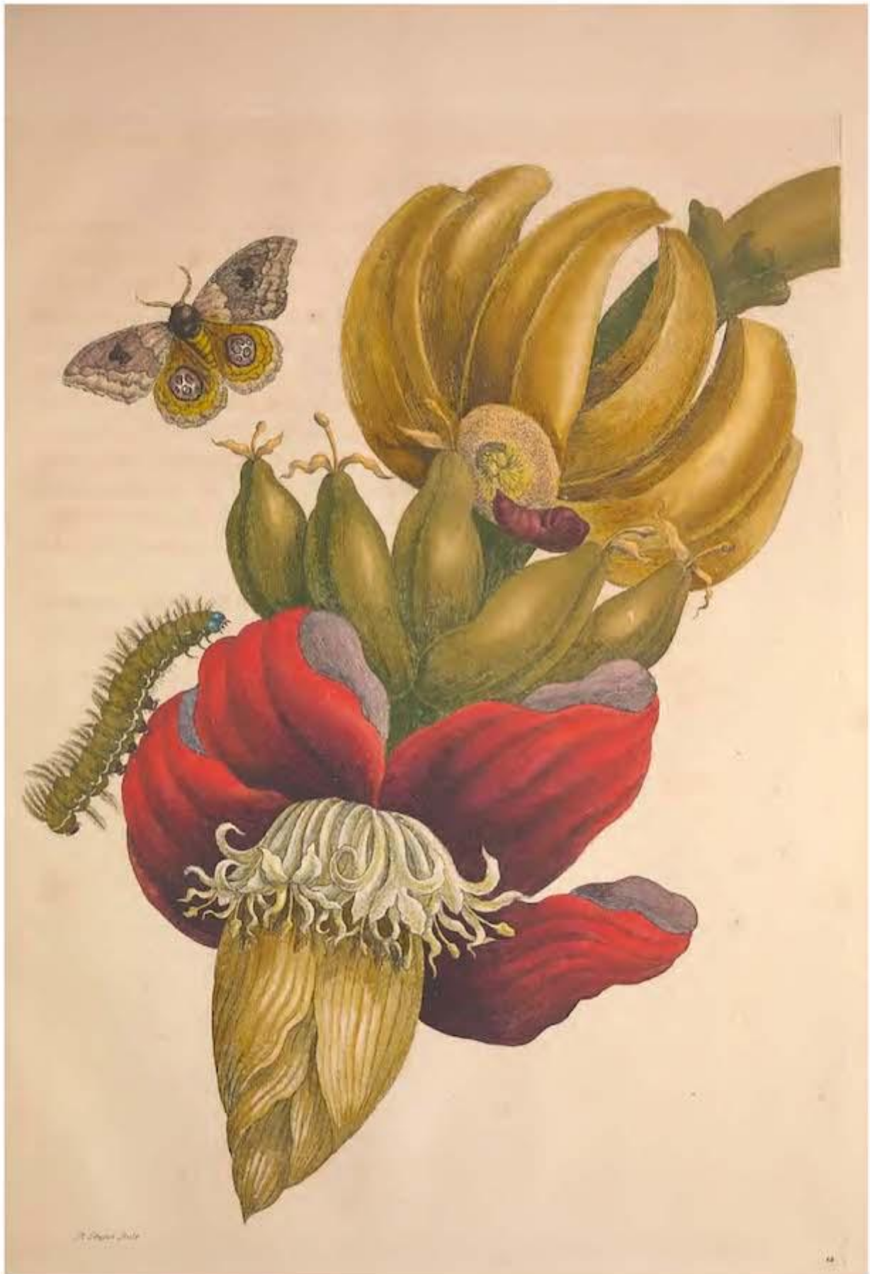
Fig. 32 – Maria Sibylla Merian, Metamorphosis insectorum Surinamensium , 1705, Tav. XII