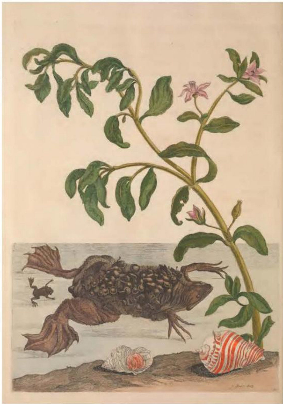
Fig. 44 – Maria Sibylla Merian, Metamorphosis insectorum Surinamensium , 1705, Tav. LIX