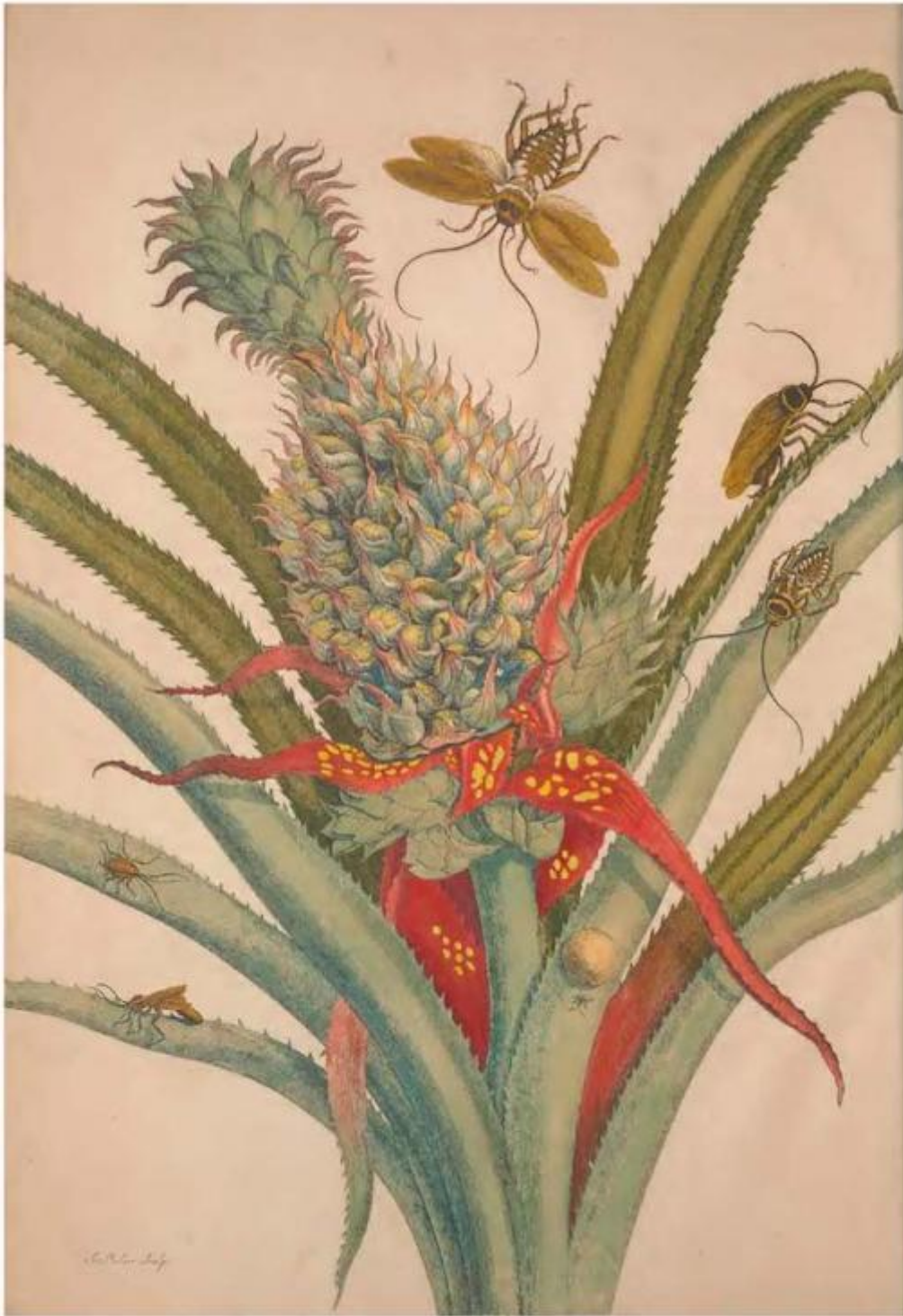
Fig. 42 – Maria Sibylla Merian, Metamorphosis insectorum Surinamensium , 1705, Tav. I

A Francoforte rimane poco: nel 1685 si trasferisce in Frisia presso una corrente radicale di protestanti, i labadisti, che predicano la comunione dei beni e la separazione dal mondo secolare. Scrive ancora Torresin: “Unirsi ai labadisti significa allontanarsi dal mondo, vivere secondo le Scritture, rinunciare a ogni forma di vanità, di lusso, di arte, conferire i propri beni e piegarsi alle regole di una comunità severamente gerarchizzata e disciplinata”. Grazie all’incontro con i labadisti viene a sapere dell’insediamento di alcuni di loro in Suriname, e di conseguenza decide di intraprendere il viaggio nelle Americhe.