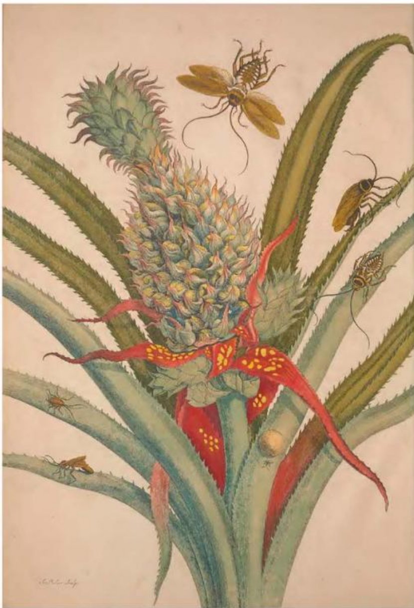
Fig. 42 – Maria Sibylla Merian, Metamorphosis insectorum Surinamensium , 1705, Tav. I

Nel 1683 Maria Sibylla torna a Francoforte e pubblica il secondo libro dei Bruchi . Penetriamo nella sua vita attraverso lettere inviate a sue allieve, perché alla pratica del disegno e della pittura congiunge l'attività didattica.