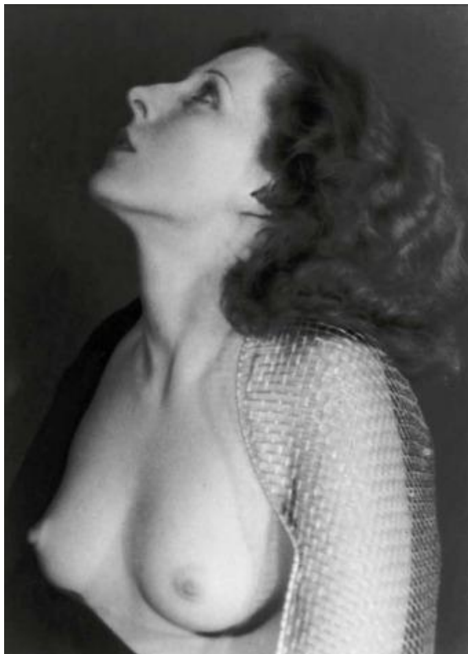
Lee Miller, Senza titolo (Nudo che indossa una protezione di maglia da schermo), Parigi, Francia 1930 circa.

Iconica e controversa la fotografia che auto-ritrae Lee Miller nella vasca da bagno di Hitler, il 30 aprile del 1945. Ma le pagine e le immagini scorrono, del libro come della mostra: questa riassumerà in un ultimo breve capitolo la pace a fatica conquistata da Lee a fianco del marito Roland, tra un grave disturbo post-traumatico da stress e una depressione post partum con la nascita del figlio Antony. Nel racconto biografico, invece, i viaggi proseguono e si susseguono nell'Europa dell'est, per tutta la Transilvania, per raccogliere le testimonianze delle conseguenze della guerra in quella parte di mondo.