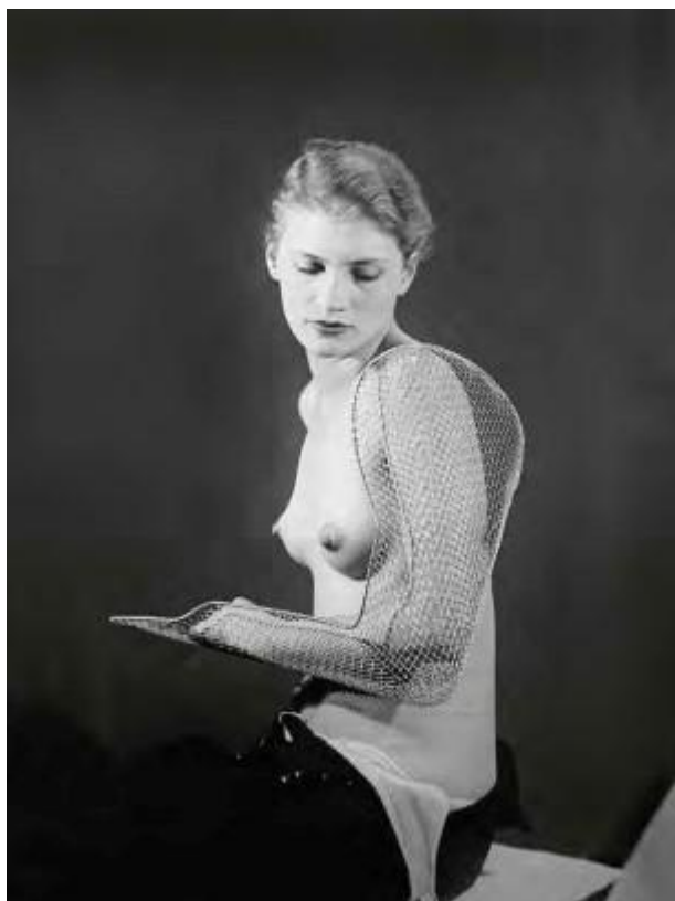
Man Ray, Lee Miller, 1930 circa.