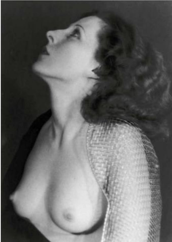
Lee Miller, Senza titolo (Nudo che indossa una protezione di maglia da schermo), Parigi, Francia 1930 circa.

E via in discesa: Lee avvierà un rapporto ormai solo più domestico e confidenziale con la fotografia, ritraendo e facendosi ritrarre dalle persone che le sono vicine, negli anni in cui Antony cresce circondato dai grandi artisti amici dei genitori, da Saul Steinberg all'immane Man Ray. Pare quasi che in quest'ultima fase l'urgenza di Lee Miller, rivedendo in un solo flashback tutta la sua frenetica esistenza, fosse quella di ripetere tacitamente a chiunque, e a noi che ora la scopriamo, le stesse parole che scrisse alla redazione di Vogue per testimoniare gli orrori della guerra: "Ti imploro di credere che è tutto vero".