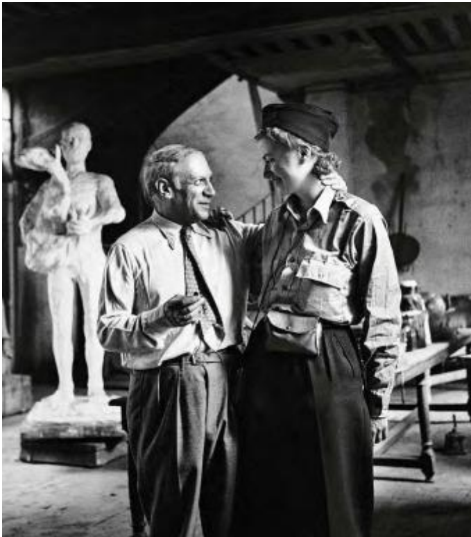
Lee Miller, Picasso e Lee Miller nello studio di Picasso, Liberazione di Parigi, Rue des Grands Augustins Parigi, Francia 1944.

dà di questo periodo più testimonianza di quanto non faccia la mostra, inserendo alcune immagini di valore come “Le Cupole della Chiesa della Vergine Maria”, o la “Cock Rock, anche detta The Native” che pare denuncino la necessità di pulire lo sguardo per abbracciare una realtà nitida e significativa in quanto tale.