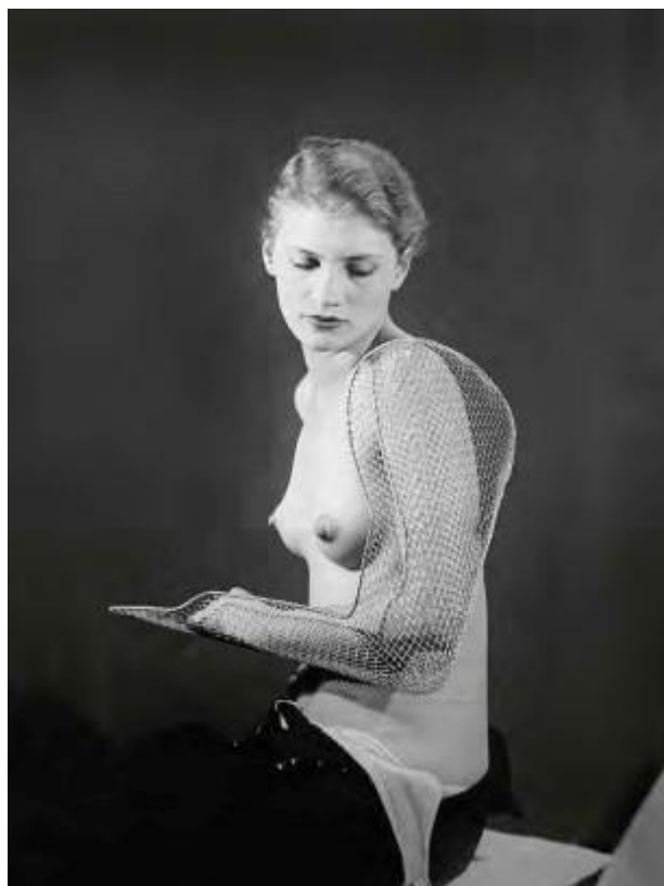
Man Ray, Lee Miller, 1930 circa.