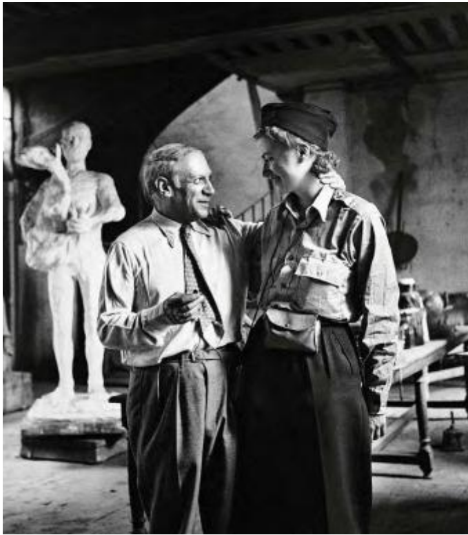
Lee Miller, Picasso e Lee Miller nello studio di Picasso, Liberazione di Parigi, Rue des Grands Augustins Parigi, Francia 1944.

Nel 1937 Lee è di nuovo a Parigi, spostata dalla vita egiziana: qui incontra gli amici surrealisti, tra cui Man Ray, e conosce Roland Penrose a una festa in maschera. Dopo le cosiddette “vacanze surrealiste” in compagnia del nuovo amante, di Man Ray e altri amici – tra cui Max Ernst, Paul Éluard e Picasso – in cui le immagini risultano essere un umano resoconto dei momenti di quei giorni, nel 1939 la Miller si sposta a Londra con Roland e inizia un altro nuovo capitolo.