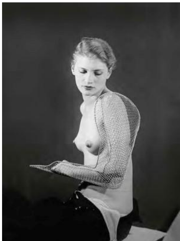
Man Ray, Lee Miller, 1930 circa.