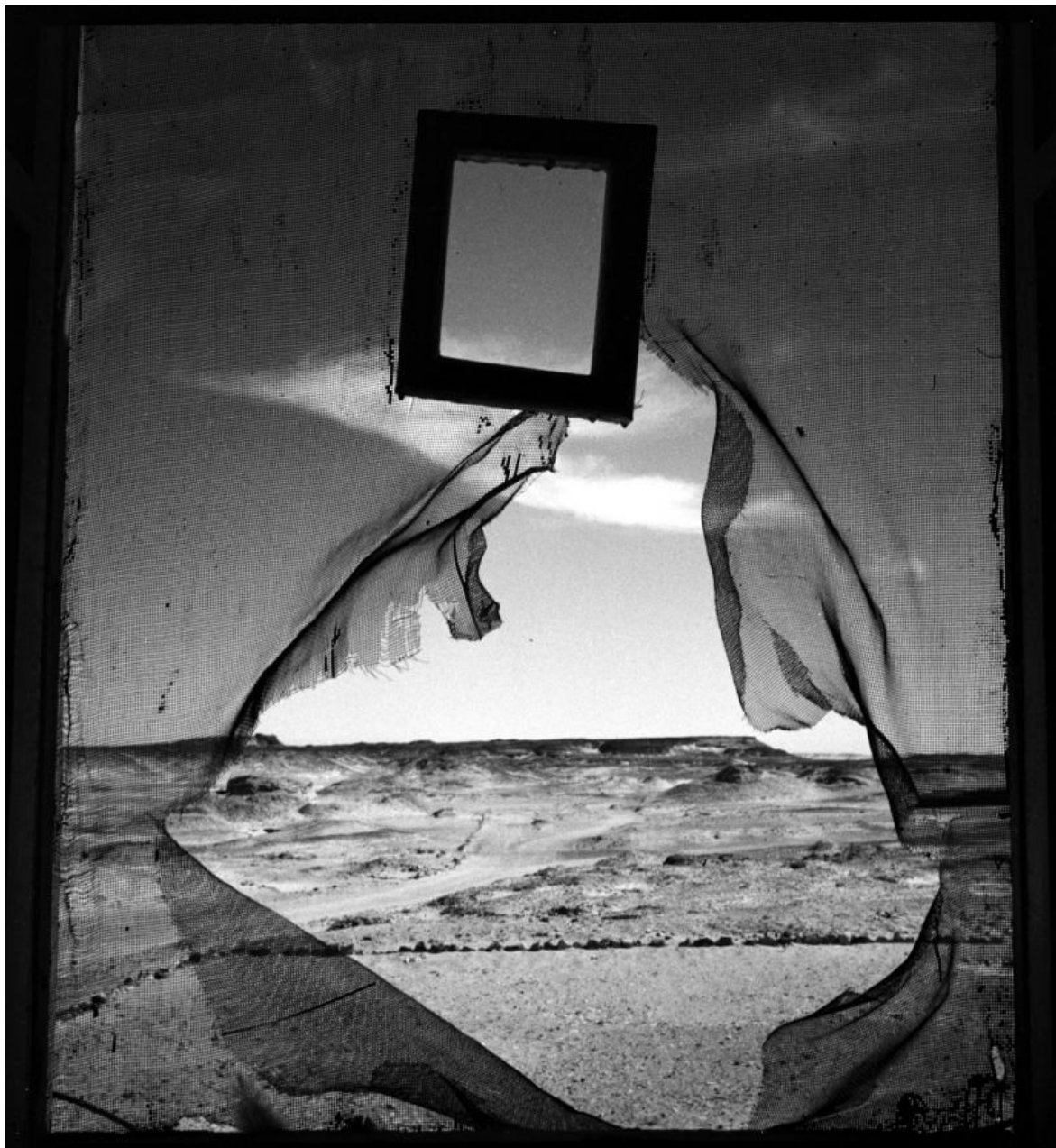
Lee Miller, Portrait of Space near Siwa Egypt, 1937.

La fotografia surrealista germogliava, quindi, negli stessi anni in cui lo faceva la nuova visione del Bauhaus in Germania e mentre stava lentamente tramontando ogni strascico pittorialista americano per dare spazio alla nuova obiettività del gruppo f/64. Lee Miller incontra dunque un uomo e un paese trainanti nell'evoluzione della fotografia, ereditandone in brevissimo tempo le intuizioni più avanguardistiche e, concetto che torna, "rivoluzionarie".