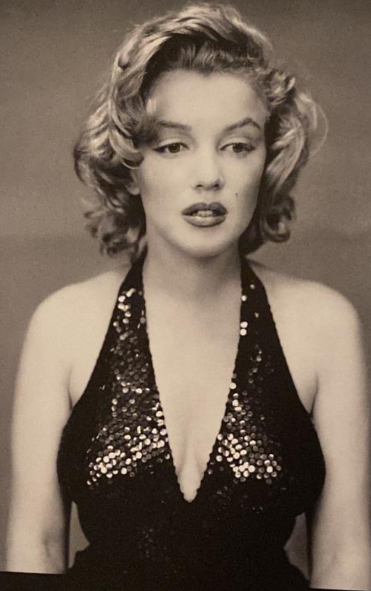
9. Richard Avedon, Marilyn Monroe, actress, New York, May 6, 1957.

questa famosa fotografia, Marilyn Monroe sembra intrappolata nell'ombra, bloccata tra la luce e la tristezza. Con gli occhi che guardano avanti, la testa leggermente girata e le labbra con