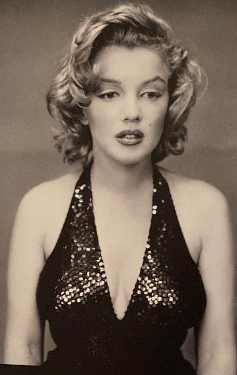
9. Richard Avedon, Marilyn Monroe, actress, New York, May 6, 1957.

questa famosa fotografia, Marilyn Monroe nbra intrappolata nell'ombra, bloccata tra la ica e la tristezza. Con gli occhi