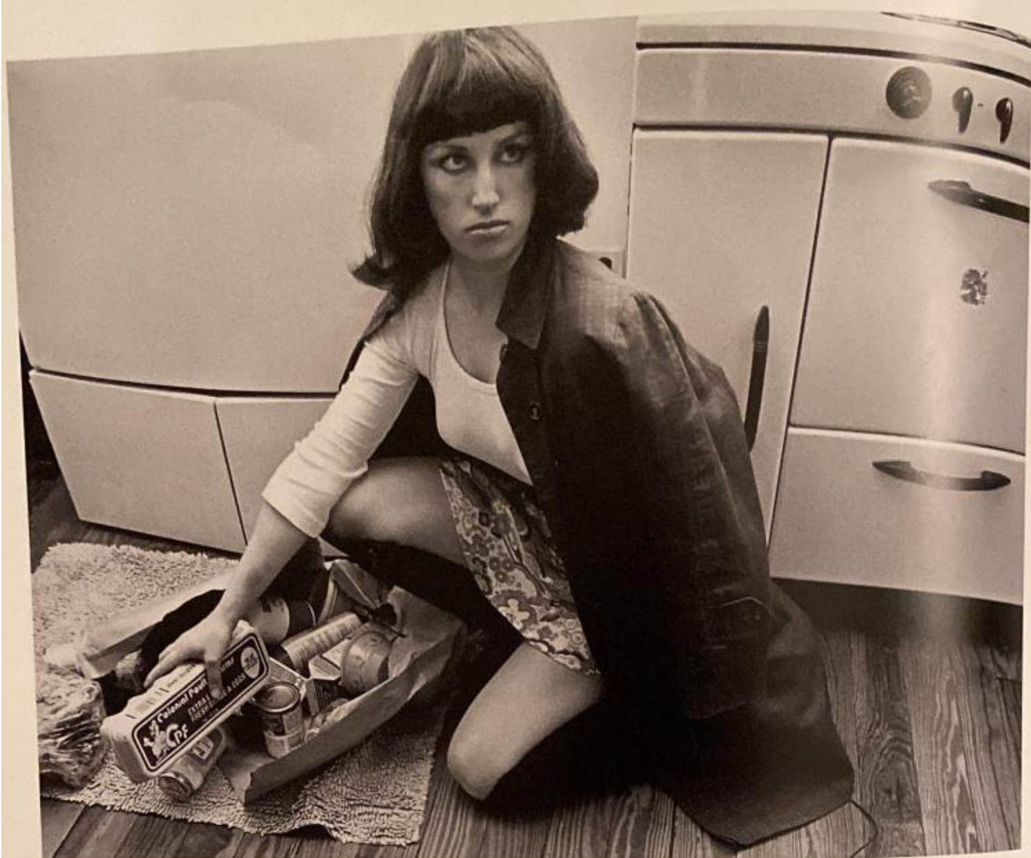
181. Cindy Sherman, Untitled Film Still #10 , 1978.

Accanto a un sacchetto della spesa rotto, Cindy Sherman guarda accigliata una presenza invisibile, una confezione di uova stretta in mano. Come tutti i settanta autoritratti del famoso ciclo Film Stills , l'immagine non è accompagnata da una spiegazione né da un contesto, quasi fosse strappata via da un racconto senza un inizio, uno svolgimento e una fine.