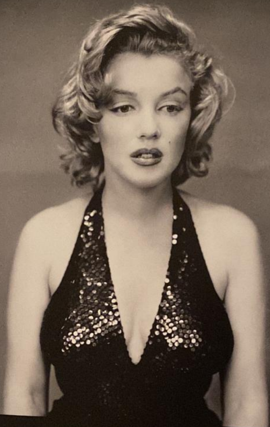
9. Richard Avedon, Marilyn Monroe, actress, New York, May 6, 1957.

questa famosa fotografia, Marilyn Monroe nbra intrappolata nell'ombra, bloccata tra la ica e la tristezza. Con gli occhi