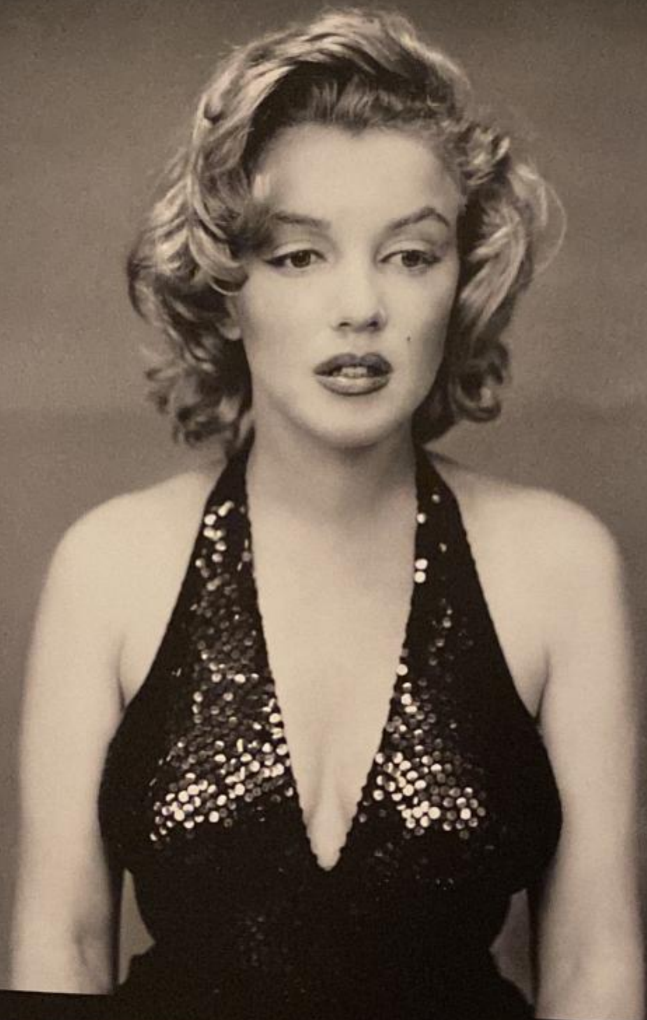
9. Richard Avedon, Marilyn Monroe, actress, New York, May 6, 1957.

questa famosa fotografia, Marilyn Monroe nbra intrappolata nell'ombra, bloccata tra la ica e la tristezza. Con gli occhi