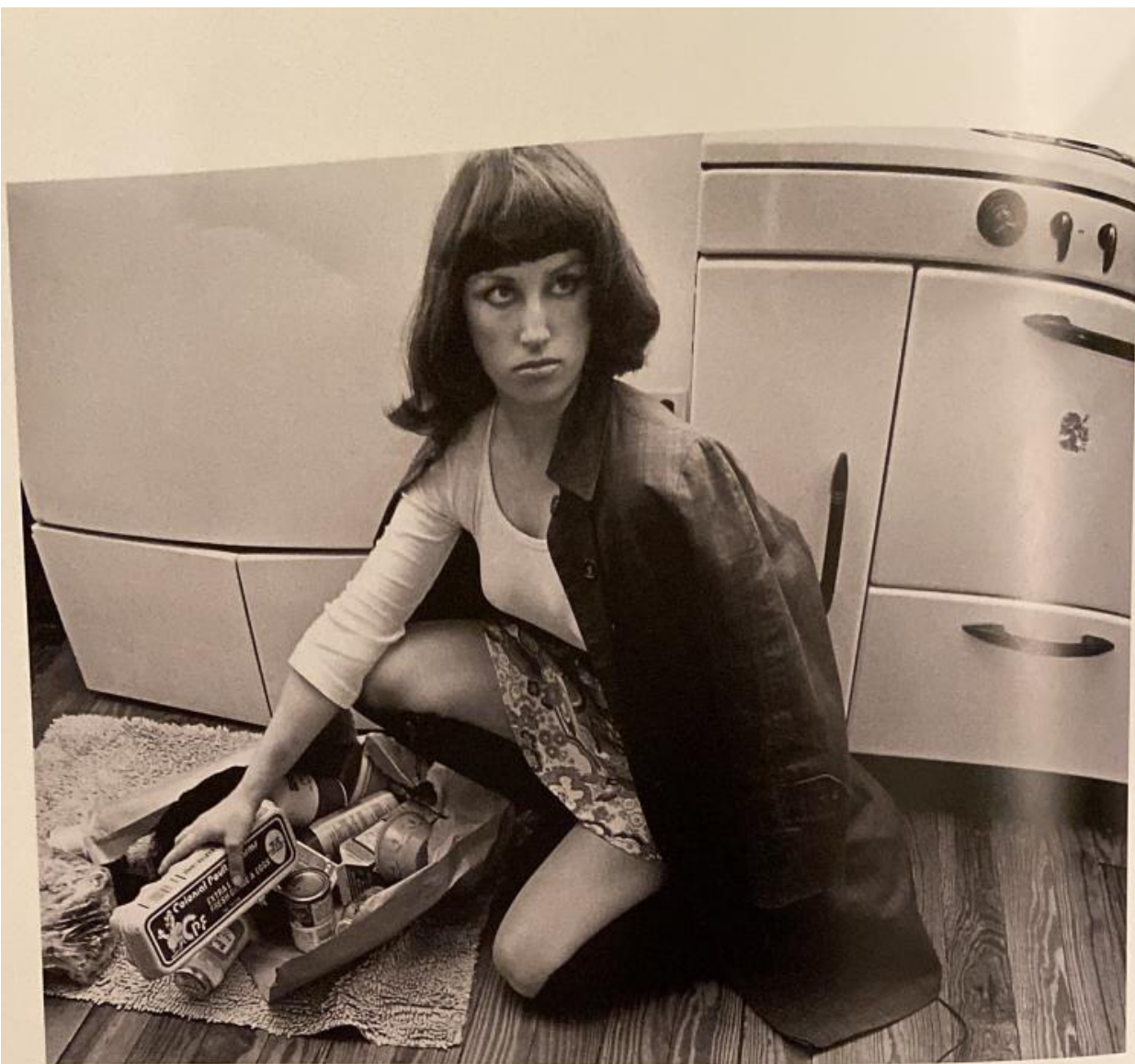
181. Cindy Sherman, Untitled Film Still #10 , 1978.

Accanto a un sacchetto della spesa rotto, Cindy Sherman guarda accigliata una presenza invisibile, una confezione di uova stretta in mano. Come tutti i settanta autoritratti del famoso ciclo Film Stills , l'immagine non è accompagnata da una spiegazione né da un contesto, quasi fosse strappata via da un racconto senza un inizio, uno svolgimento e una fine.