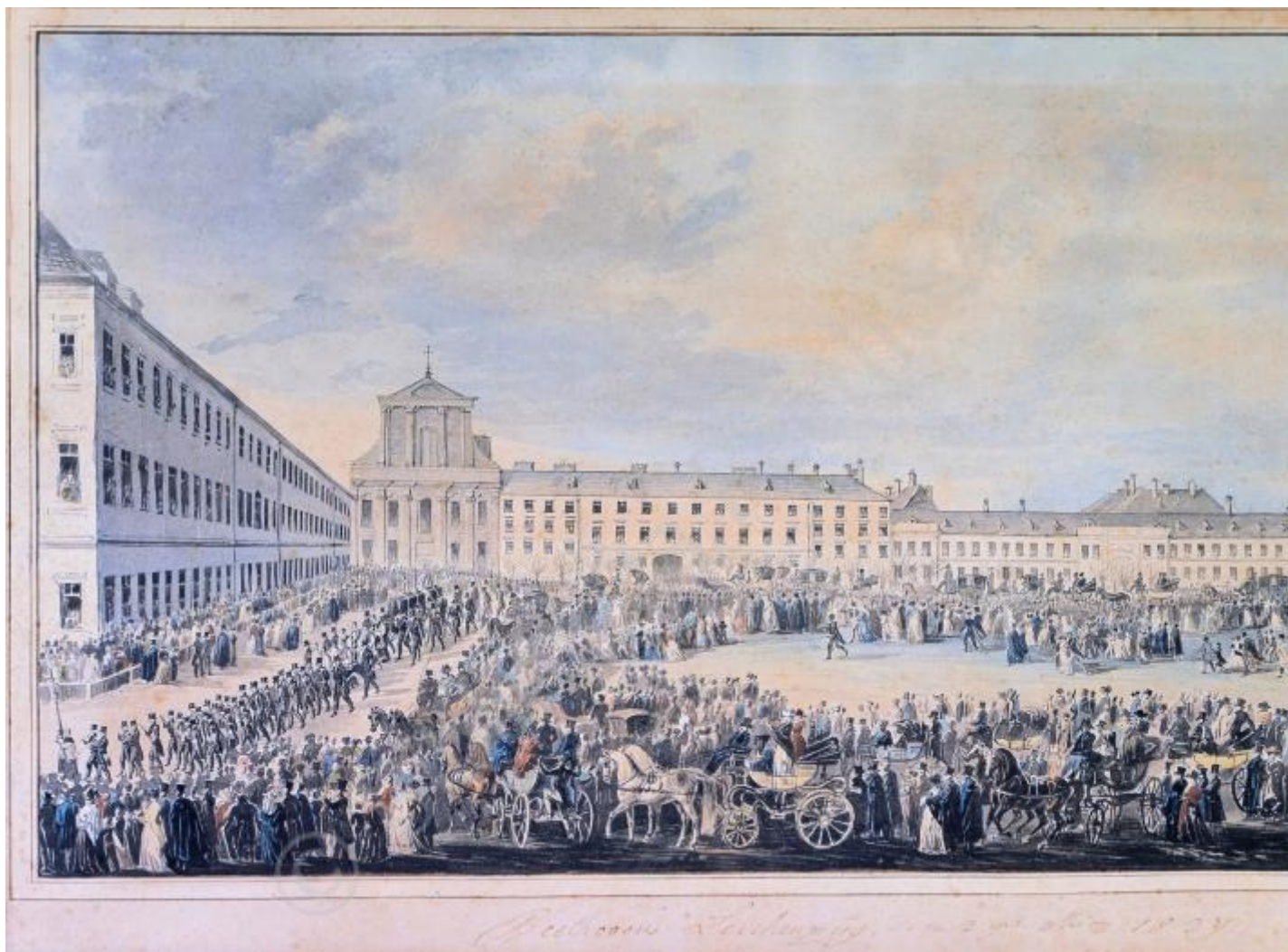
Franz Xaver Strobel, I funerali di Beethoven, acquerello, 1827.