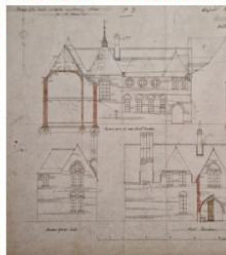
William Morris, alcune vedute della Red House . In basso a destra: disegno di progetto di Philipp Webb, 1859, matita, penna e acquarello, prospetti nord e sud.