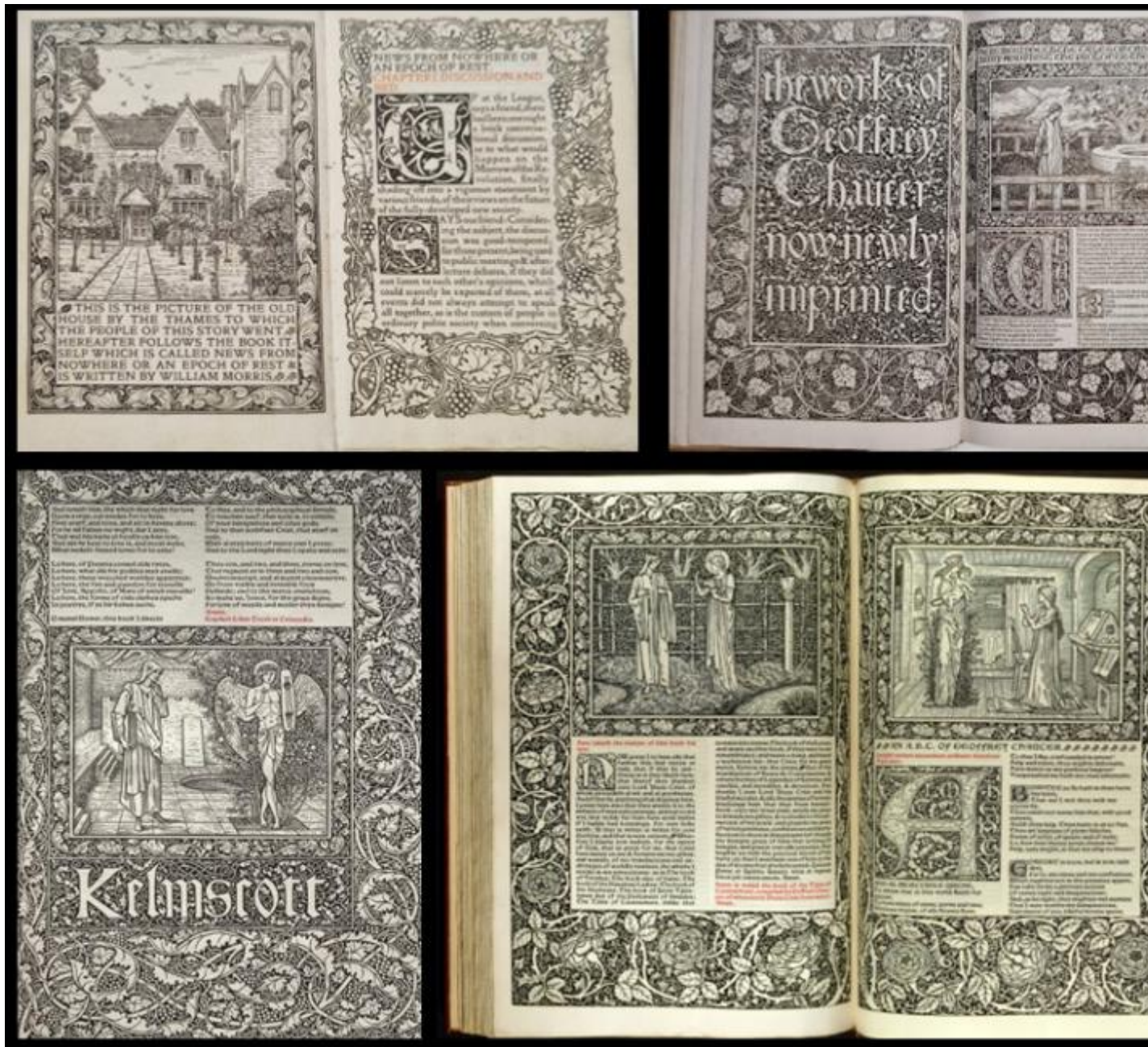
In alto a sinistra: William Morris, New from Nowhere , edizione Kelmscott Press, pubblicato il 24 marzo 1893, ora al V&A Museum. A destra: The work of Geoffrey Chaucer , Kelmscott Press, 1896. In basso: frontespizio e pagine dell'opera di Geoffrey Chaucer (1343 – 1440), stampata da William Morris presso la Kelmscott Press. Terminata l'8 maggio 1896 è il più ambizioso dei lavori della stamperia ed è considerato uno dei volumi più belli dell'intera storia delle arti del libro.

Fra i tanti edifici in cui Morris visse ed operò, certamente il più rappresentativo del suo pensiero fu il primo, la Red House , a Bexleyheath, progettata da lui stesso nel 1859 insieme all'amico architetto e collega di studio Philip Webb, con l'apporto cooperativo di tutti gli amici artisti della sua cerchia. Considerato un manifesto delle Arts and Crafts è realizzato in mattoni rossi, dal cui colore prende il nome, senza che alcun intonaco lo ricopra, per rispettare i "criteri di verità costruttiva" auspicati dalla dottrina di Ruskin, di cui Morris era un fedele seguace. Pensato per interagire con il paesaggio del Ken, nel quale è immerso, colloquia con esso attraverso le sue molte finestre di ogni foggia e dimensione. Sebbene tragga ispirazione dai modelli dell'architettura medievale, soprattutto gotica, tanto amata dal maestro, ha tratti di sorprendente modernità nella pianta libera, con grande anticipo su quella che verrà inclusa tra i 5 punti dell'architettura moderna da Le Corbusier nel 1925. Un altro dei motivi che ascrivono questa architettura alle precorritrici del Movimento Moderno è l'essenzialità quasi minimalista delle sue forme. Il medesimo concetto di 'stanza' vi è addirittura