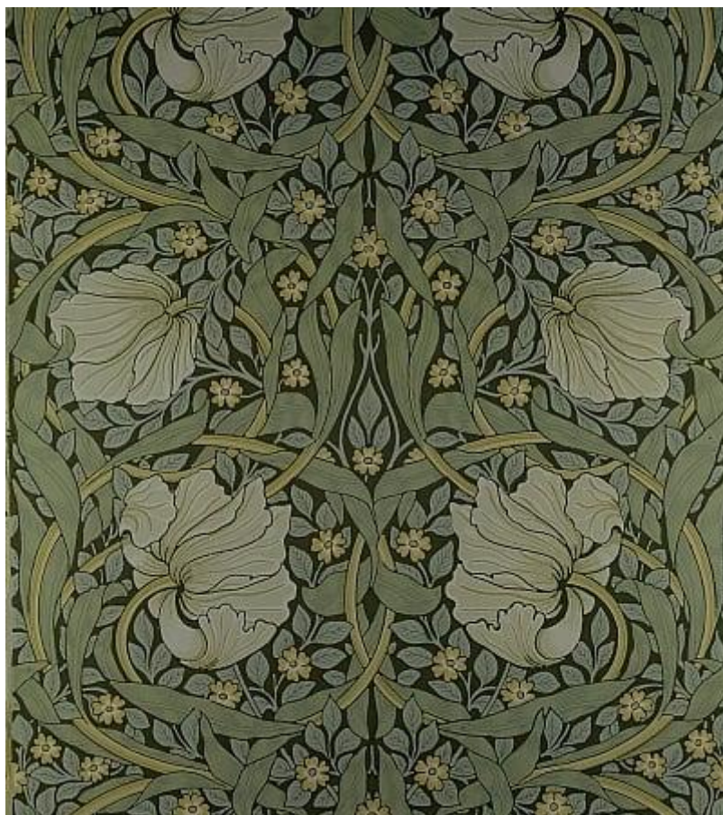
William Morris, Pimpernel (primula) carta da parati, 1876.

C'è una casa sulla Baia Piccola di Sestri Levante, rossa, che a me, fin da quand'ero una studentessa di architettura e assidua frequentatrice di quel lido, ha sempre richiamato alla mente, per la sua forma medievaleggiante, per la sua tipologia, per la libertà compositiva che la presiede e per le sue finestre tutte diverse una dall'altra, la Red House di Morris, in miniatura, ovviamente, giusto una porzione di quella, catapultata lì, sulla sabbia assoluta lambita dal Mediterraneo – a colloquiare con i gabbiani, con il cielo e con il mare – da un capriccio della geografia o, forse, da uno della storia, complice la mia fantasia.