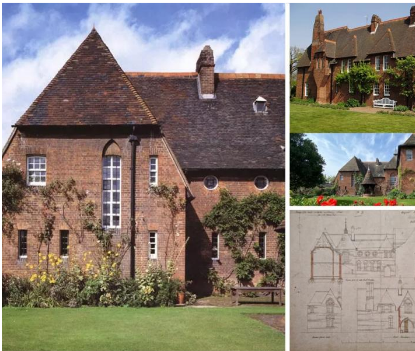
William Morris, alcune vedute della Red House . In basso a destra: disegno di progetto di Philipp Webb, 1859, matita, penna e acquarello, prospetti nord e sud.

Per tutte queste ragioni, Nikolaus Pevsner l'ha inclusa nel suo "I Pionieri del Movimento Moderno" (1936) tra gli edifici che rappresentano i prodromi dell'architettura moderna.