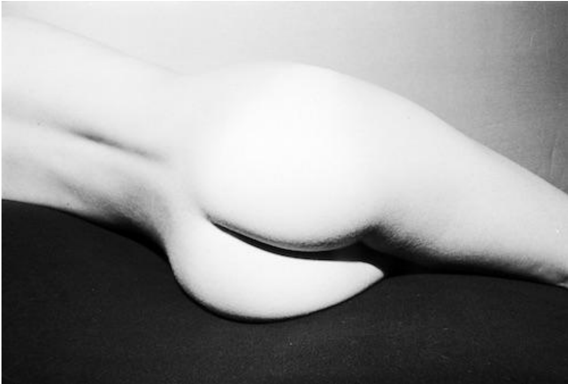
Carla Cerati, Forma di donna , 1978.

agio nel ritrarre i corpi delle donne, dei ragazzini, degli operai, dei malati mentali, degli intellettuali. Le mancava proprio un “corpo a corpo” con il corpo femminile.