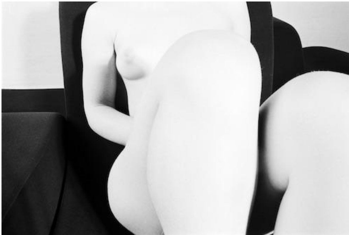
Carla Cerati, Forma di donna , 1978.