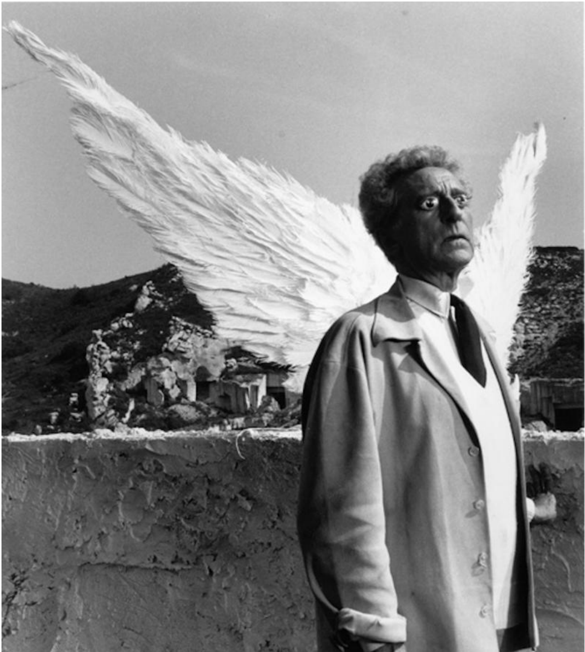
Fotogramma del film Il testamento di Orfeo (1960).

Come raccontare questo artefice cui sta stretta ogni definizione, quella di regista, di autore, pittore, performer, sceneggiatore eccetera, riconoscendosi solo in quel sinonimo appunto della parola artefice che è poeta? Con un libro come la sua opera fatto di pezzi, di focalizzazioni e divagazioni, una piccola enciclopedia Cocteau, che diventa un viaggio per frammenti in un Novecento 'moderno', che sembra portare già verso le sponde composite della postmodernità.