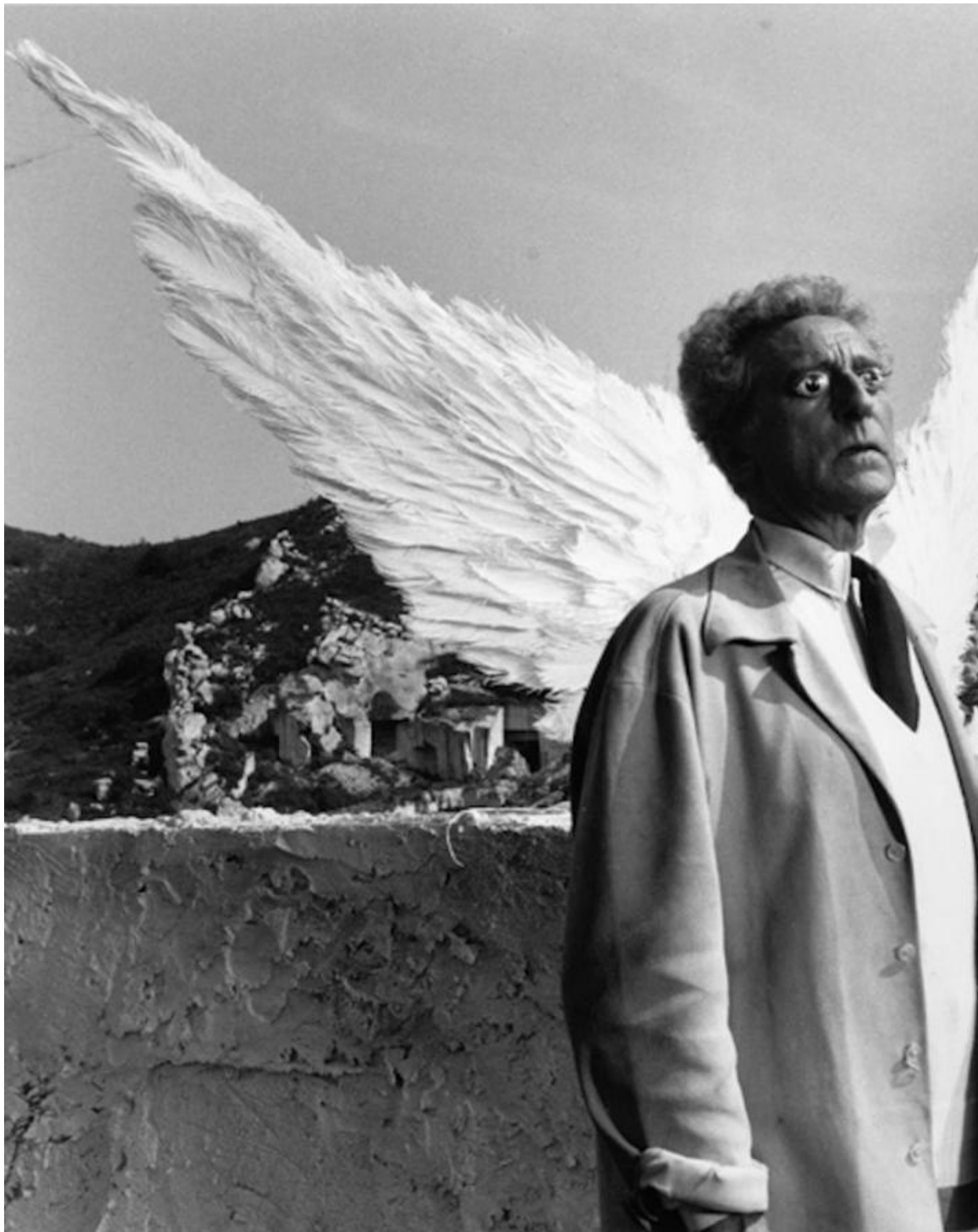
Fotogramma del film Il testamento di Orfeo (1960).

Come raccontare questo artefice cui sta stretta ogni definizione, quella di regista, di autore, pittore, performer, sceneggiatore eccetera, riconoscendosi solo in quel sinonimo appunto della parola artefice che è poeta? Con un libro come la sua opera fatto di pezzi, di focalizzazioni e divagazioni, una piccola