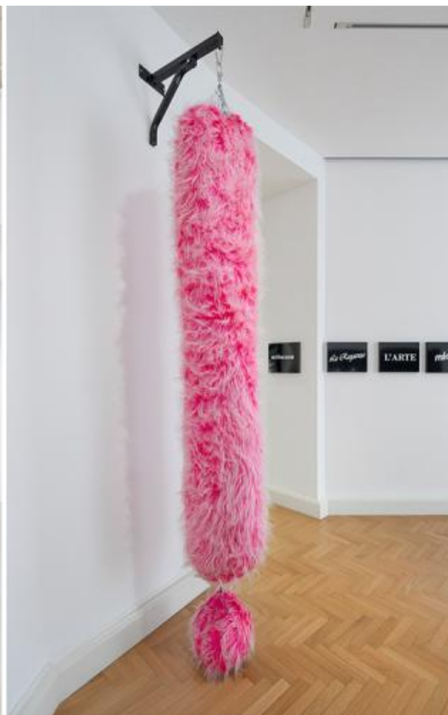
Luca Massaro, ? (L.A.), 2022, tessuto in pelliccia sintetica cucita a mano e poliuretano riciclato. Courtesy Viasaterna. Foto: Carola Merello / Luca Massaro, !, 2022, tessuto in pelliccia sintetica cucita a mano e poliuretano riciclato. Courtesy Viasaterna. Foto: Carola Merello.