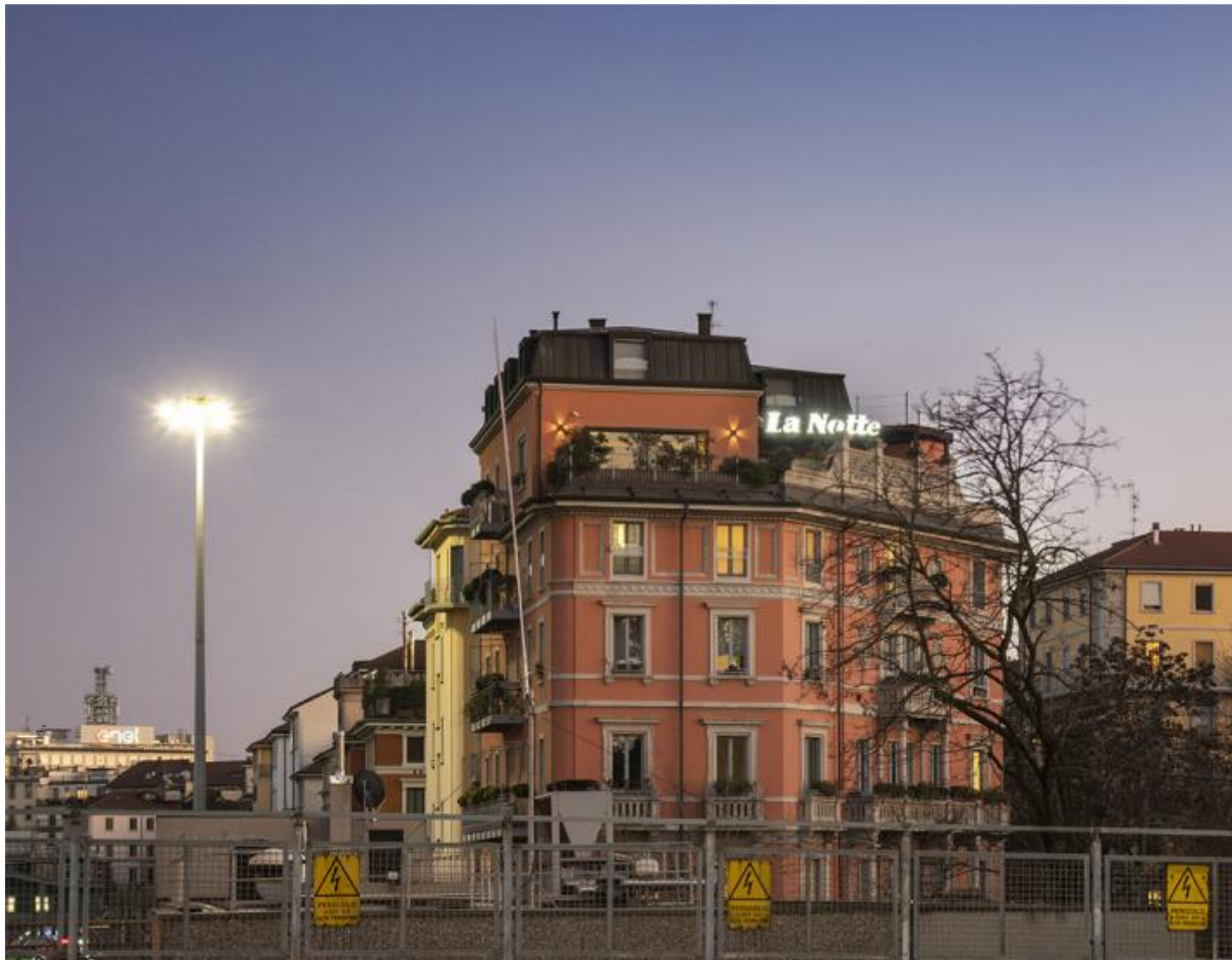
Luca Massaro, La Notte , 2022, lightbox.

L'opera site specific La Notte , composta da un lightbox collocato sul tetto dell'edificio che ospita la galleria, ripropone il contesto urbano nel quale Massaro incontra le scritte che poi fotografa. La Notte era un quotidiano milanese di cronaca pubblicato dal 1952 al 1995, ma è anche quella che rende leggibile a distanza il lightbox evocando un paesaggio urbano ora scomparso. Il testo entra così in un sistema di lettura e interpretazione dominato dall'ambiguità. L'artista sfrutta questa elasticità del testo per rendere instabile il linguaggio pubblicitario, in un certo senso per minare la sua credibilità attraverso una deriva poetica del senso.