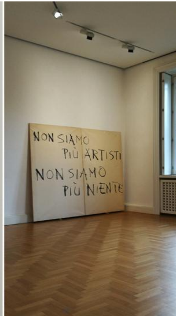
Giuseppe Chiari, Diritto di visione , 1999, pennarello su carta / Giuseppe Chiari, Non siamo più artisti non siamo più niente , 1973, tecnica mista.

A questo riguardo può essere utile ricordare Adieu au langage (2014) di Jean-Luc Godard, un film enigmistico dove troviamo immagini indipendenti, solitarie e mute come il cane, uno dei tre protagonisti, ma anche immagini che giocano con le parole e parole che giocano con se stesse: "Ah Dieux", "Oh langage", "pouce - Poucette - pousser", "évite, et vite, les souvenirs brisés". In questo modo l'immagine cinematografica entra in una relazione enigmatica con la parola e, se vogliamo seguire il suggerimento psicanalitico, anche con l'inconscio (a questo riguardo vale la pena di notare che Massaro lavora sul valore culturale e sociopolitico delle immagini e dei testi che, come egli stesso dichiara, "infestano la nostra psiche").