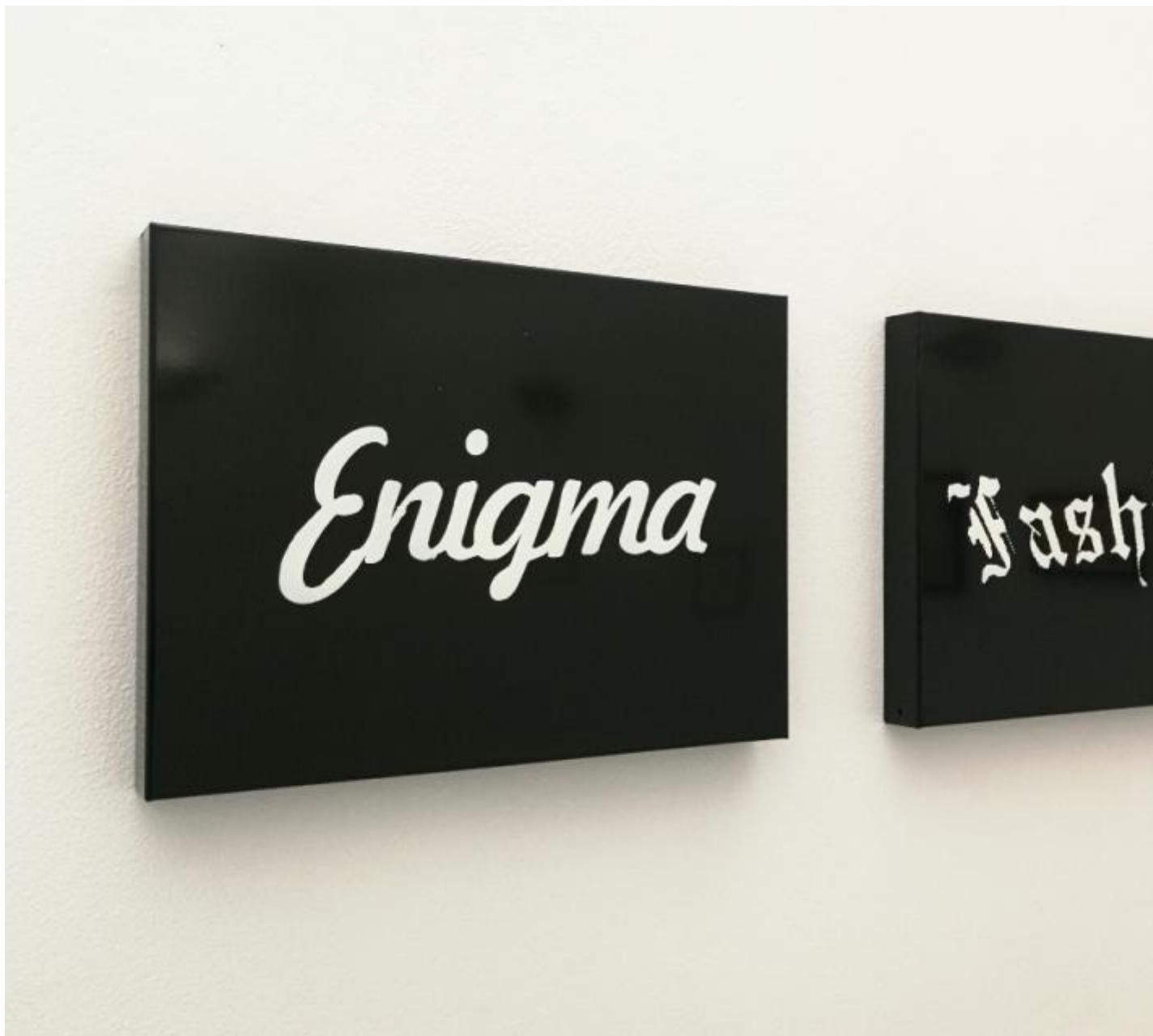
Luca Massaro, Enigma e Fashion , 2023, vernice su telaio d'acciaio cromato.

Il testo fotografato diventa un'immagine, non una riproduzione delle parole che lo compongono, che pure possono essere lette. L'opinione di Stefano Bartezzaghi a questo riguardo è che il rapporto fra il testo fotografato e l'ambiente nel quale questo s'installa sia tale da conferirgli enigmaticità.