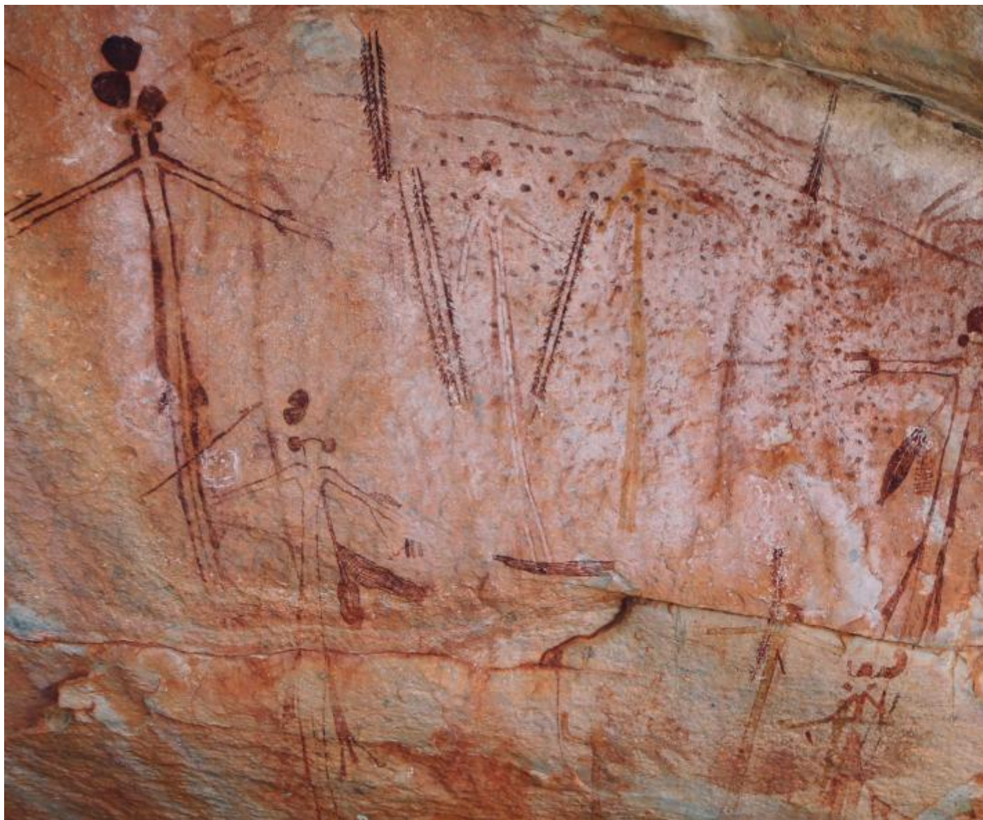
Dipinti Wanjina che raffigurano gli antenati spirituali e la loro rappresentazione in forma antropomorfa.

in tutte le epoche, teorizzato prima dall'abate Henri Breuil e poi perfezionato da André Leroi-Gourhan, non ha alcun fondamento storico. La tappa che ha fatto crollare questo paradigma è stata indubbiamente la scoperta, nel dicembre 1994, della grotta di Chauvet-Pont d'Arc, sulle cui pareti sono conservate le sorprendenti raffigurazioni di cavalli, leoni, bisonti, orsi e rinoceronti dipinte con straordinaria precisione nelle proporzioni e con sofisticato ed efficacissimo naturalismo nei movimenti, la cui datazione al radiocarbonio-14 le colloca tra il 36/37.000 anni fa, attestandole come i dipinti figurativi più antichi dell'umanità.