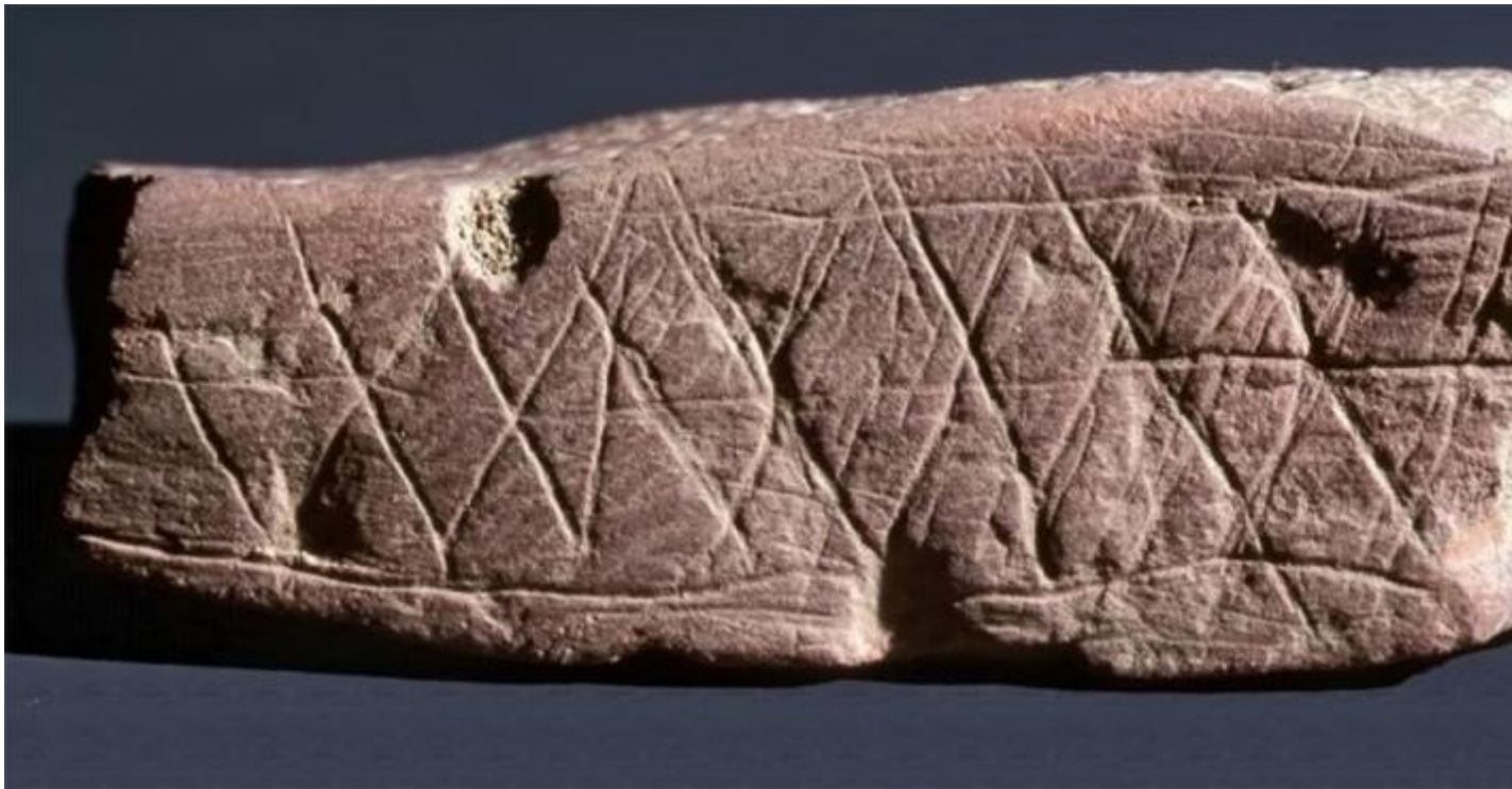
Incisioni su frammento di ocre, Blombos, Sudafrica, 70.000 anni fa.

Gli archeologi autori dei saggi distinguono nettamente la nozione di simbolismo (o di pensiero simbolico) da quella di creazione di forme grafiche complesse, quella che chiamiamo arte figurativa: le due pratiche non devono essere confuse perché non sono simultanee. Il possesso di un pensiero simbolico non assicura di per sé la capacità di creare forme grafiche complesse. Tra la pratica di incisioni lineari, la produzione di forme grafiche semplici e la raffigurazione di forme degli animali non c'è stato nel corso dell'evoluzione un passaggio lineare e graduale. Allo stato attuale delle conoscenze, sostengono gli autori del testo, la comparsa della capacità cognitiva e culturale di creare figure animali o umane è una prerogativa esclusiva dell'uomo Sapiens.