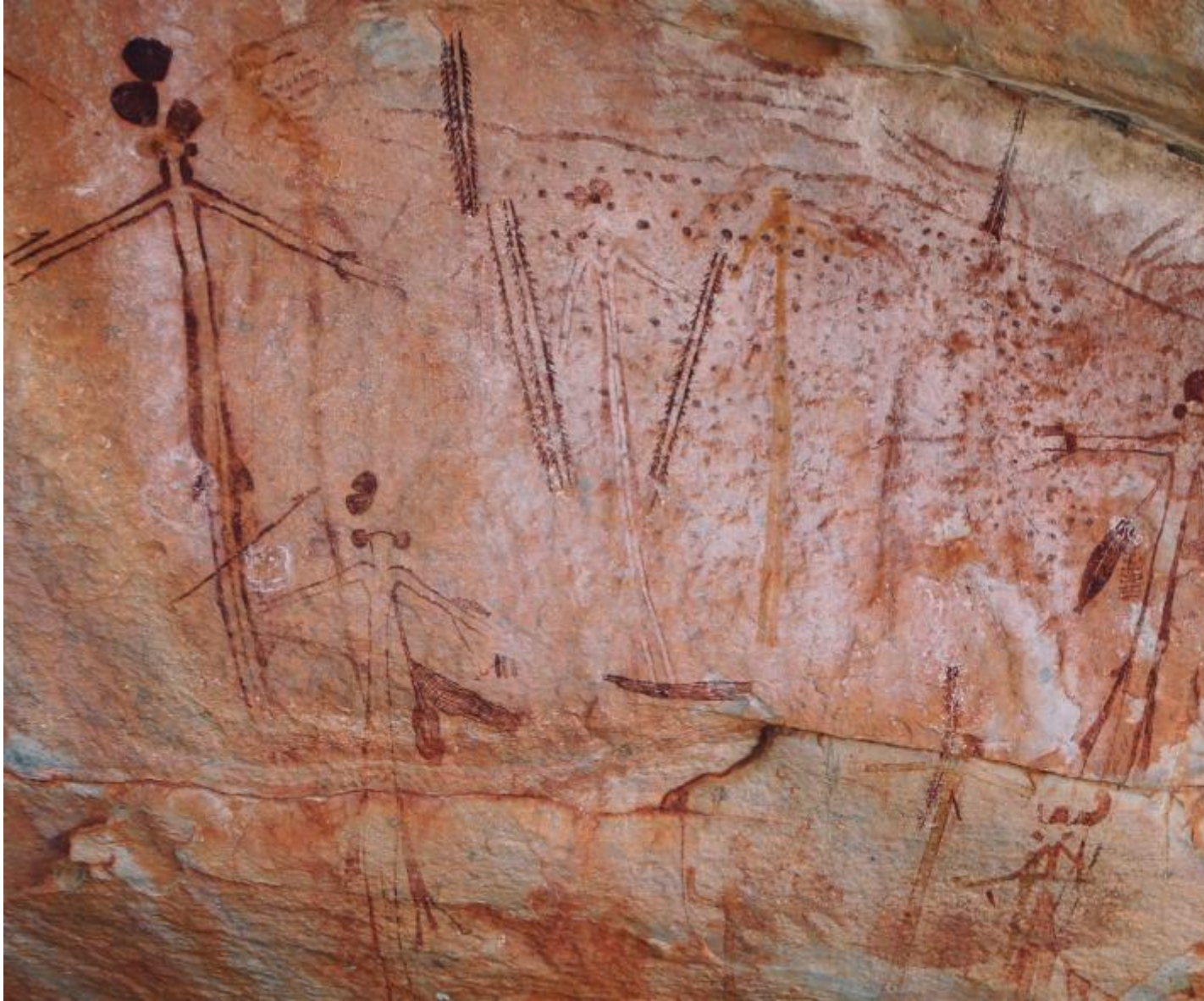
Dipinti Wanjina che raffigurano gli antenati spirituali e la loro rappresentazione in forma antropomorfa.

in tutte le epoche, teorizzato prima dall'abate Henri Breuil e poi perfezionato da André Leroi-Gourhan, non ha alcun fondamento storico. La tappa che ha fatto crollare questo paradigma è stata indubbiamente la scoperta, nel dicembre 1994, della grotta di Chauvet-Pont d'Arc, sulle cui pareti sono conservate le sorprendenti raffigurazioni di cavalli, leoni, bisonti, orsi e rinoceronti dipinte con straordinaria precisione nelle proporzioni e con sofisticato ed efficacissimo naturalismo nei movimenti, la cui datazione al radiocarbonio-14 le colloca tra il 36/37.000 anni fa, attestandole come i dipinti figurativi più antichi dell'umanità.