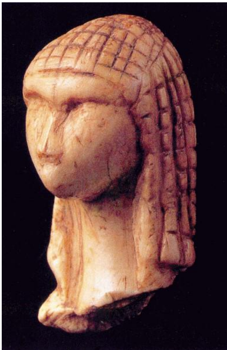
Dama di Brassempouy.

Tuttavia alla fine della lettura una certezza questo libro ce la consegna: quella di avere tra le mani un testo imprescindibile per tutti coloro che a diverso titolo nutrono un interesse verso l'arte preistorica e le affascinanti questioni della nascita dell'arte. Senza alcun dubbio costituirà un riferimento anche per gli studi futuri e per chi oggi è in cerca di una fonte scientifica, approfondita e, per quanto possibile, anche esaustiva delle diverse forme di arte rupestre che l'uomo, fin dalla notte dei tempi, ha impresso sulle superfici della terra e che sono pervenute fino a noi oggi.