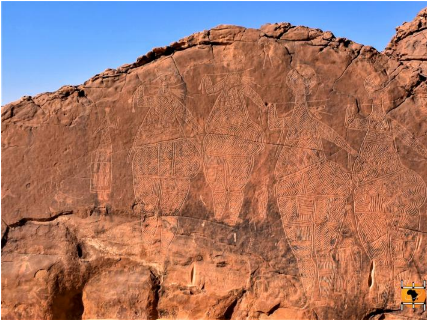
Niola Doa (Ennedi nel Ciad).

Non meno sorprendenti sono le gigantesche incisioni di Niola Doa (Ennedi nel Ciad) del Neolitico che raffigurano la steatopigia di enormi figure femminili dalla testa rotonda modellata da cerchi concentrici, vestite da fitte decorazioni e texture di motivi geometrici ondulati, a spina di pesce, a zig-zag o da moduli a losanga.