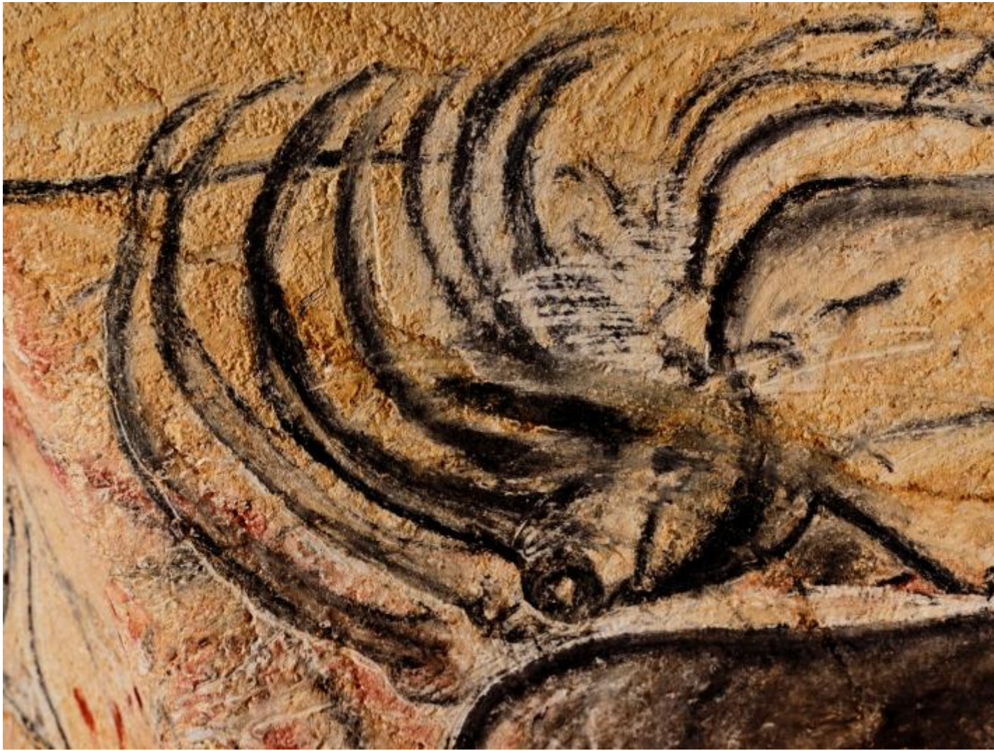
Grotta di Chauvet - Sala dei rinoceronti. 37-36.000 anni fa.