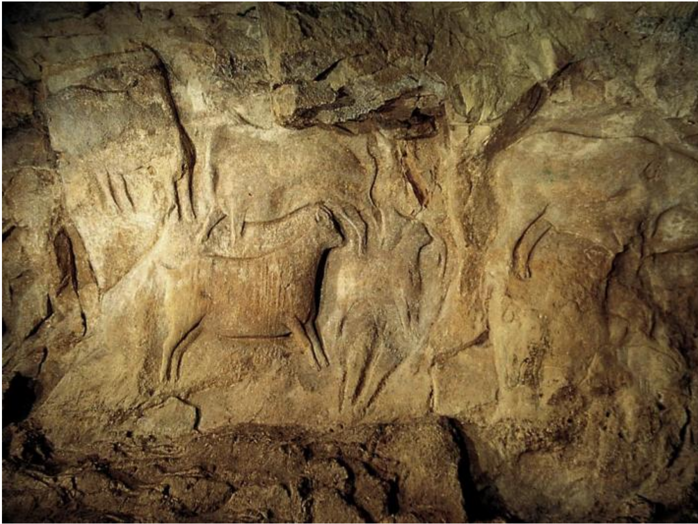
Riparo di Roc aux Sorciers,, bassorilievi di 15.000 anni fa.

Vale la pena ricordare che la scoperta dell'arte paleolitica, che si estende in tutta l'Europa dalla punta dell'Andalusia fino agli Urali, è un evento sorprendentemente molto recente. La scoperta della prima grotta, quella di Altamira, in Cantabria, risale al 1879; da allora sono state scoperte centinaia di altre grotte e ripari in cui furono dipinte e incise immagini prevalentemente di animali. Oggi in Europa sono stati individuati circa 400 siti di arte parietale, il cui significato altamente simbolico testimonia l'importanza che questa attività svolgeva nella vita spirituale degli uomini del tempo. La particolarità che fondamentale più caratterizza l'arte paleolitica è la sua collocazione, che attesta un'attrazione per i luoghi più inaccessibili, situati nelle profondità più recesse delle grotte. Nel testo viene messo in evidenza che in nessun'altra epoca gli uomini si sono avventurati tanto lontano nel sottosuolo. Esempio a riguardo è la grotta di La Cullalvera (Cantabria), in cui i pittori paleolitici si sono inoltrati nelle profondità dei suoi reticoli carsici, alcuni di essi lunghi anche qualche chilometro, unicamente per imprimere dei segni sulle loro pareti.