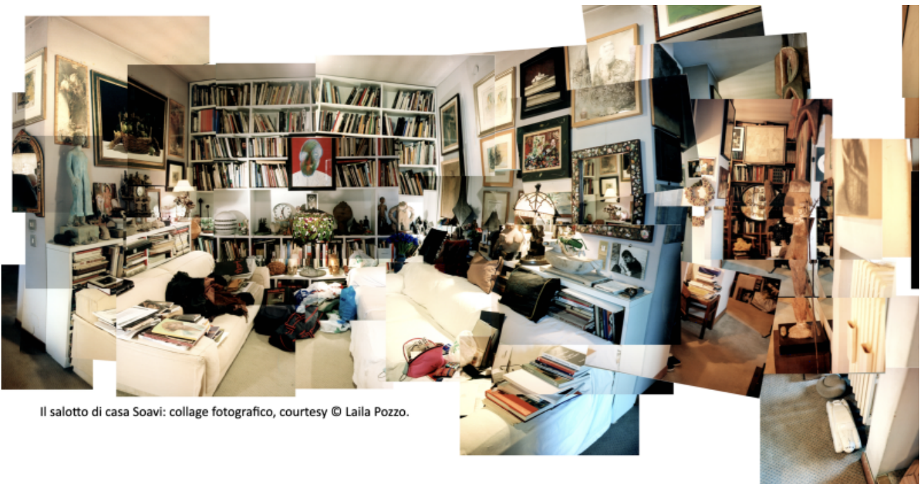
Il salotto di casa Soavi: collage fotografico, courtesy © Laila Pozzo.

Ho conosciuto Giorgio Soavi nel 1980, l'anno in cui era uscito un suo romanzo, Sogni di gloria , la storia di un artista, tale Paul, che al culmine del successo, senza un motivo apparente, pianta tutto, America, prestigio, carriera, amici, e si trasferisce in un paesino della Toscana alla ricerca della propria identità, verso quei sogni di gloria che, almeno una volta nella vita, ognuno di noi ha inseguito più o meno furiosamente. Proprio come era accaduto, nella realtà, a un grande amico di Soavi, Leo Lionni (il Paul del romanzo), pittore, scrittore, illustratore, art director della rivista Fortune e dell'intero gruppo Time-Life , che una bella mattina, piantati baracca e burattini, si trasferisce dalla frenesia di New York, la città che non dorme mai, alla sonnacchiosa, ma più a misura d'uomo, Radda in Chianti.