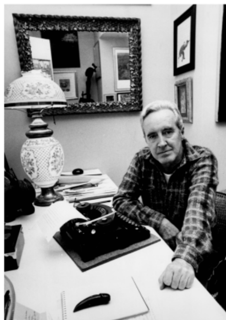
Un angolo del soggiorno di casa Soavi. A destra lo scrittore con una macchina per scrivere d'antiquariato (foto 1981).