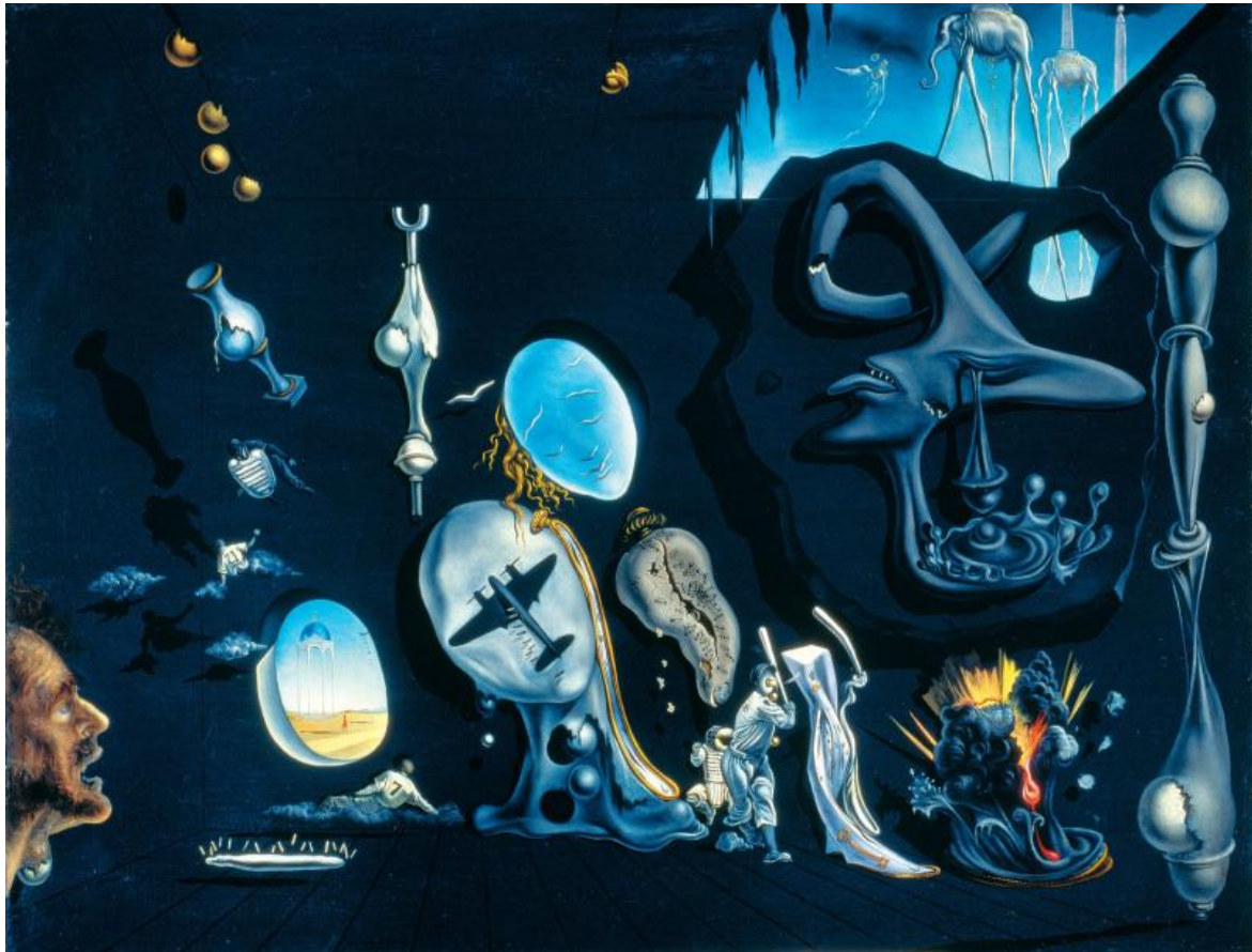
Idillio Atomico e Uranico melanconico di Salvador Dalí.

Al contrario: la distruttività assoluta della bomba atomica produce la crisi della guerra e la speranza di una nuova antropologia dove diventa possibile la responsabilizzazione nel rapporto con il nostro inconscio dove “la guerra è endemica. Ognuno porta al di dentro di sé uccisioni silenziose e nascoste”. E “il fatto che ogni uomo, mentre dorme, possa sentirsi minacciato da una distruzione imminente – situazione che l’incubo ha in comune con l’attacco di angoscia allo stato di veglia – può essere considerato come il nucleo emotivo di una paranoia originaria”. Per Fornari si arriva al paradosso di dover “trovare un nemico reale” per difenderci e metterci in sicurezza “di fronte a terribili entità fantasmatiche, senza carne né ossa, ma che hanno una pericolosità assoluta (...) e che potremmo chiamare ‘il Terrificante’”. L’aggressore esterno non ci lascia soli in balia dei nemici interni. Ma con la guerra atomica il “carattere assoluto del pericolo illusorio interno, contrapposto al carattere relativo del pericolo reale esterno, tende a diventare impossibile. (...) pare cioè che non possiamo più curare la nostra pazzia con la guerra” .