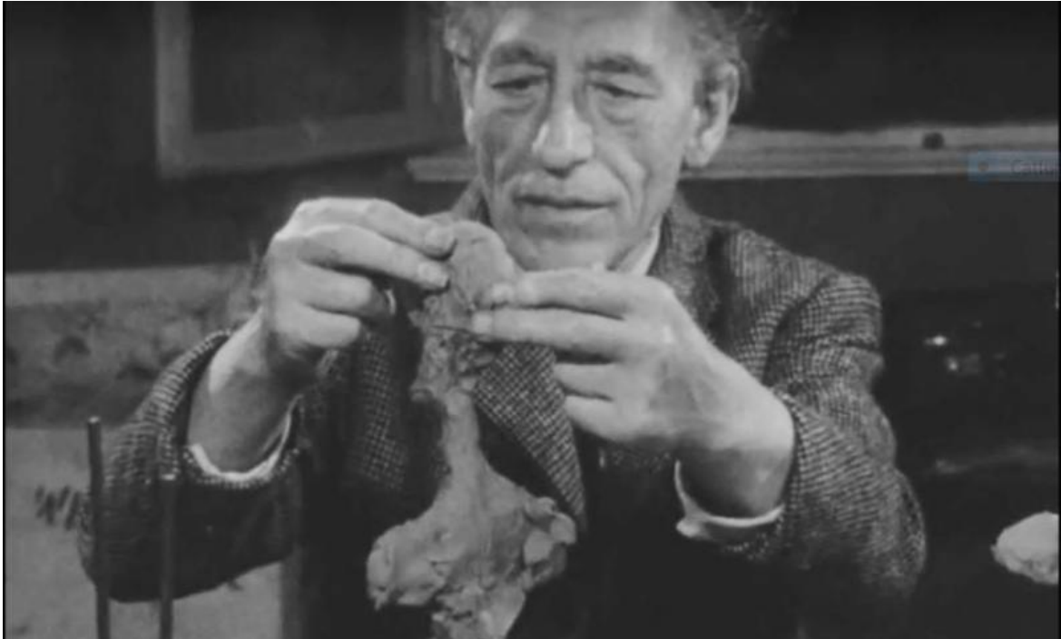
Alberto Giacometti nell'intervista televisiva realizzata da Sergio Genni nel 1963 per la Radiotelevisione svizzera.

Molto è stato scritto sulla sua difficoltà a raccordare la visione frontale di una figura a quella laterale, sulla solitudine degli oggetti che raffigurava e soprattutto sul portare a poche decine di centimetri dagli occhi una figura lontana, che resta tale nonostante sia possibile toccarla. Con le sue sculture Alberto Giacometti scollega la vista dal tatto, la percezione visiva del volume dal gesto del plastificatore che dà forma al volume stesso. Mette in mostra la condizione dell'uomo moderno di fronte a una realtà incoerente e al tempo stesso anche l'indipendenza degli organi di senso rispetto a un sistema superiore in cui si integrano coerentemente. A questa indipendenza Gian Antonio Gilli ha dedicato uno studio utilizzando fonti antiche, secondo le quali, alle origini, non esisteva il corpo, ma membra sparse e vaganti. Giacometti ha forse avvertito che "ogni sensazione aveva luogo e si concludeva a livello della Parte coinvolta"? È necessario interrogare l'opera di questo artista dal punto di vista percettivo oltre che espressivo, anche per comprendere l'opera del fratello.