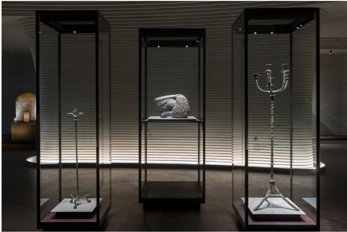
Veduta della mostra Diego, l'altro Giacometti (ipogeo progettato da Mario Cucinella). Da sinistra: candelabro etrusco della metà del secolo V a.C.; Diego Giacometti, Löwenkopf, 1934 circa, Kunsthaus Zürich; Diego Giacometti, Grande candélabre au navigateur, 1965, E.W.K., Berna.

La mostra, articolata in quattro sezioni ( Tra scultura e design, Mobili e oggetti, Bestiario, Diego come modello ), s'inserisce perfettamente nell'allestimento permanente del Museo d'arte, che include una notevole collezione d'arte etrusca. Il dialogo tra reperti archeologici e opere d'arte contemporanea trova nella mostra dedicata a Diego Giacometti l'occasione per mettere alla prova l'elasticità del metodo adottato dalla Fondazione Luigi Rovati, inserendo tra le parole chiave alle quali l'istituzione fa riferimento per lo svolgimento delle sue attività (conoscenza, espansione, inclusione, creazione, spazio, estetica, relazione, utilità sociale) anche "immaginazione". Un'immaginazione che trae ispirazione dalle fonti e che, al contempo, le cerca e le raccoglie sulla base di un'ipotesi.