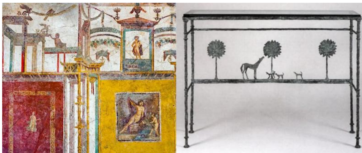
Esempio di pittura parietale romana del quarto stile, Wikimedia Commons / Diego Giacometti, La promenade des amis, 1976, E.W.K., Berna. Courtesy: Phillips.

Allo scultore svizzero Diego Giacometti il Museo d'arte della Fondazione Luigi Rovati dedica la mostra Diego, l'altro Giacometti , a cura di Casimiro Di Crescenzo, la prima in Italia interamente riservata all'artista (fino al 18 giugno 2023). L'esposizione ricostruisce il suo percorso artistico, documentandolo con oltre sessanta opere tra sculture, piccoli animali, maquettes e arredi.