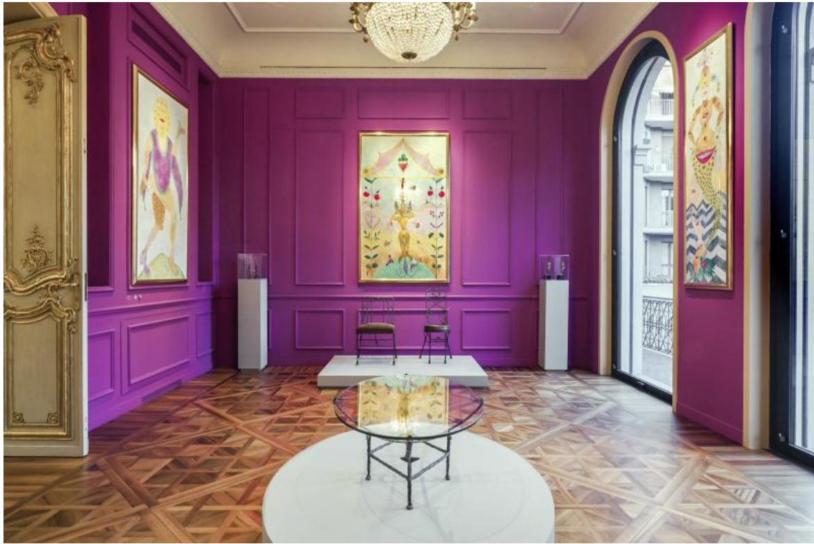
Veduta della mostra Diego, l'altro Giacometti (sala con intervento site specific di Luigi Ontani). In primo piano Table basse "Carcasse", modèle à la chauve-souris, 1975 circa, Galerie Jacques Lacoste, Parigi; in secondo piano da sinistra Chaise, 1955 circa, collezione privata e Chaise "Modèle Fondation Maeght", 1963, collezione privata. All'angolo sinistro Couple de cariatides, 1977 circa, Fondazione Luigi Rovati, Milano e a all'angolo destro due versioni di Victoire de Samothrace, 1969 circa, Galerie Jacques Lacoste, Parigi.

Nel 1925 Diego raggiunge Alberto a Parigi, dove lo aiuta a preparare le sculture da esporre al Salon des Tuileries. Dopo vari impieghi e trasferimenti da una città all'altra ritorna a Parigi nel 1929 chiamato dal fratello, che è sommerso dal lavoro. I due realizzano opere figurative e anche oggetti d'uso ideati per l'arredatore di interni Jean-Michel Frank. La produzione di oggetti d'arredo serviva sia a sostenere economicamente la loro ricerca, sia "a vedere le cose al loro posto, nel loro ambito", in altri termini ad acquisire una visione. Lo sguardo di Diego non è compulsivo e ossessivo come quella di Alberto, è uno sguardo fiabesco e narrativo. Il Gatto maggiordomo , che regge una ciotola sul bordo della quale gli uccelli andavano a posarsi per becchettare granaglie, potrebbe illustrare una favola di Esopo che non è stata scritta.