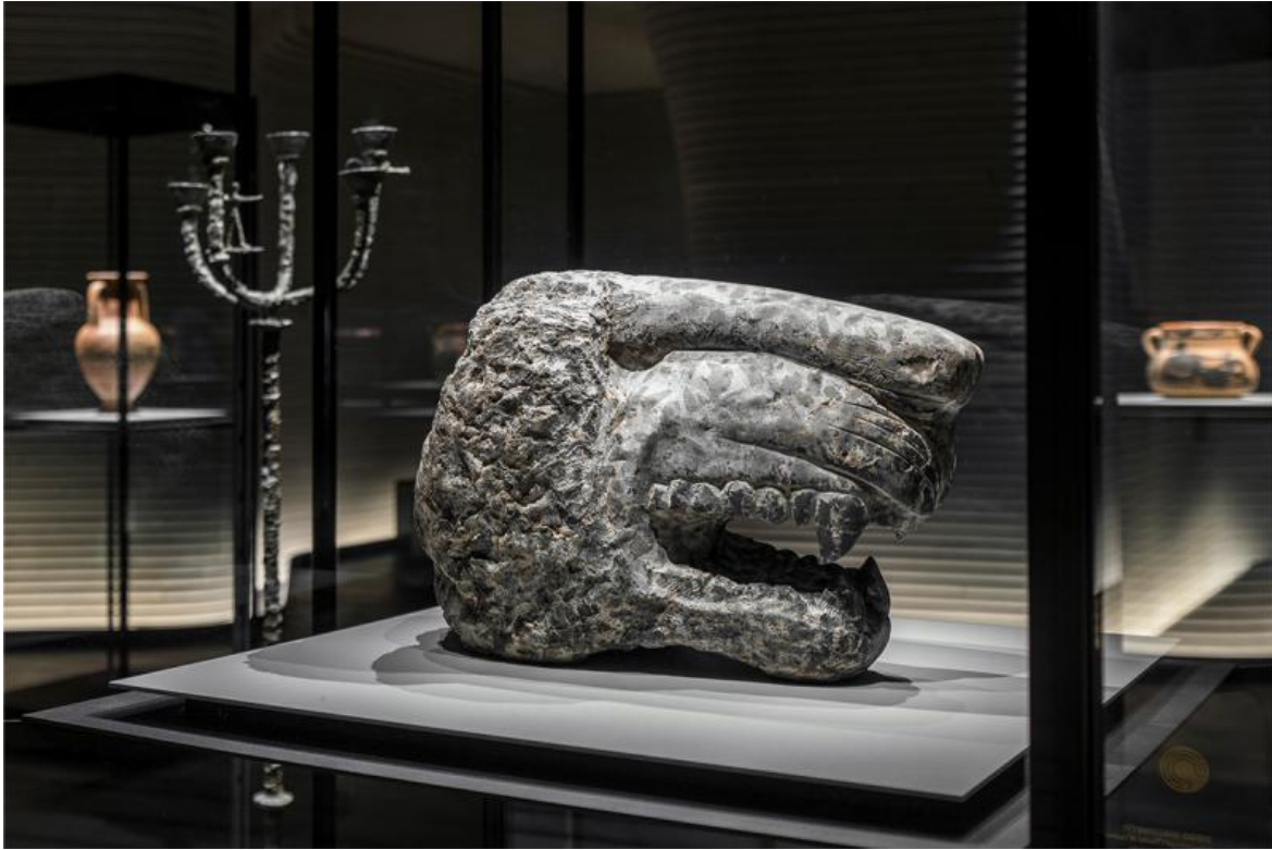
Diego Giacometti, Löwenkopf , 1934 circa, Kunsthaus Zürich. © Diego Giacometti, by SIAE 2023.

Diego scolpisce e modella leoni, volpi, topi, cavalli, cani, rane, lucertole, merli, civette, lupi, cervi, gufi e daini che, insieme ad elementi vegetali, vanno a posarsi leggeri sulle strutture dei mobili concepiti da un incontro tra la scultura e il design. Queste strutture recano nel tocco la traccia di quello sfinimento della materia che caratterizza anche le figure modellate dal fratello Alberto, di cui Diego è stato assistente e modello per quarant'anni.