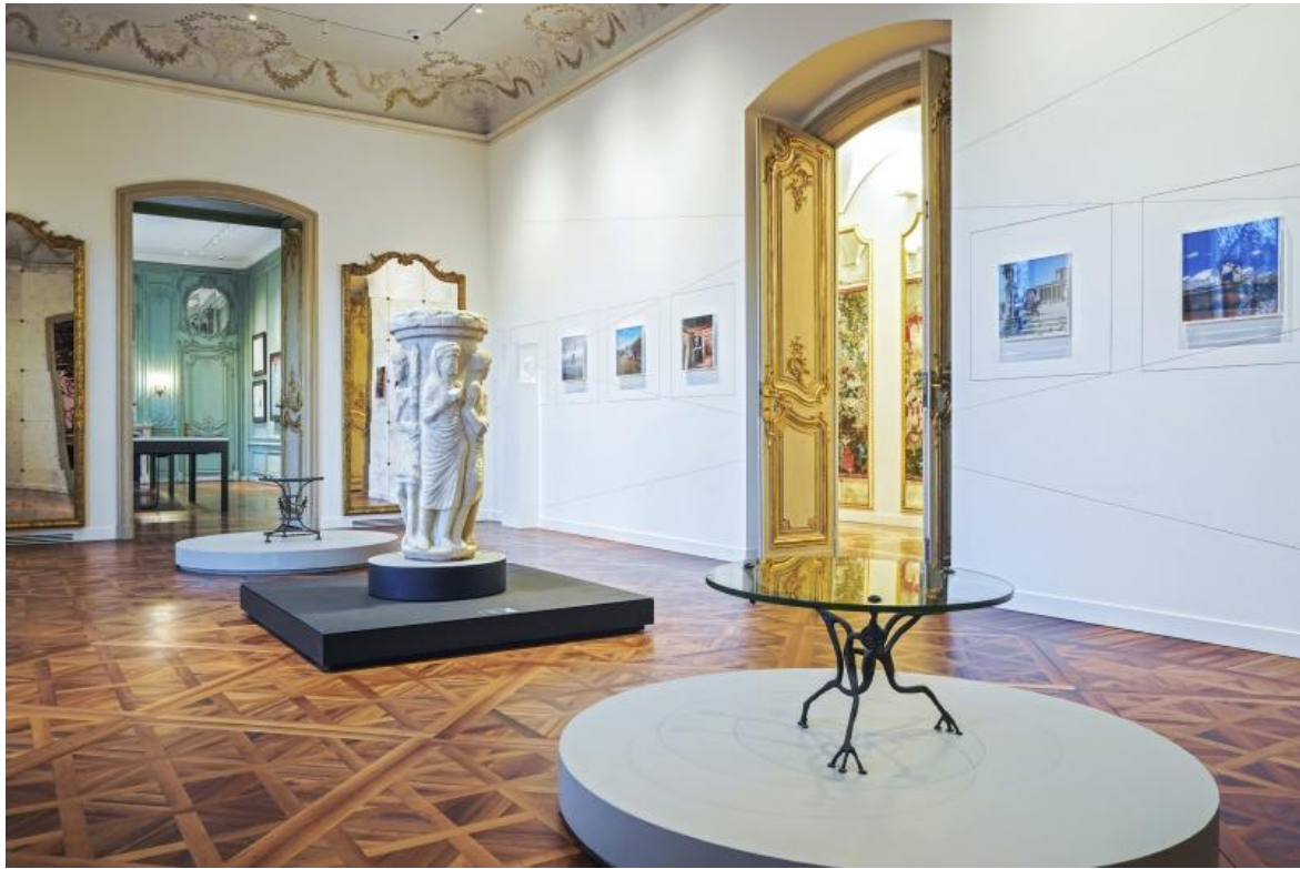
Veduta della mostra Diego, l'altro Giacometti (sala con intervento site specific di Giulio Paolini). In primo piano Guéridon racines, 1964, collezione privata; in secondo piano Guéridon aux harpies, 1955 circa, collezione privata. © Diego Giacometti, by SIAE 2023.

L'allestimento espositivo permanente, che comprende interventi site specific di artisti contemporanei, tra i quali Giulio Paolini e Luigi Ontani, richiama alla mente anche le parole con le quali Novalis assegna all'immaginazione dell'artista un ruolo attivo nella costruzione del passato: "Essa [l'antichità] prende forma sotto gli occhi e l'anima dell'artista. I resti antichi non sono che stimoli specifici per la formazione dell'antichità" ( Lavori preparatori , 445).