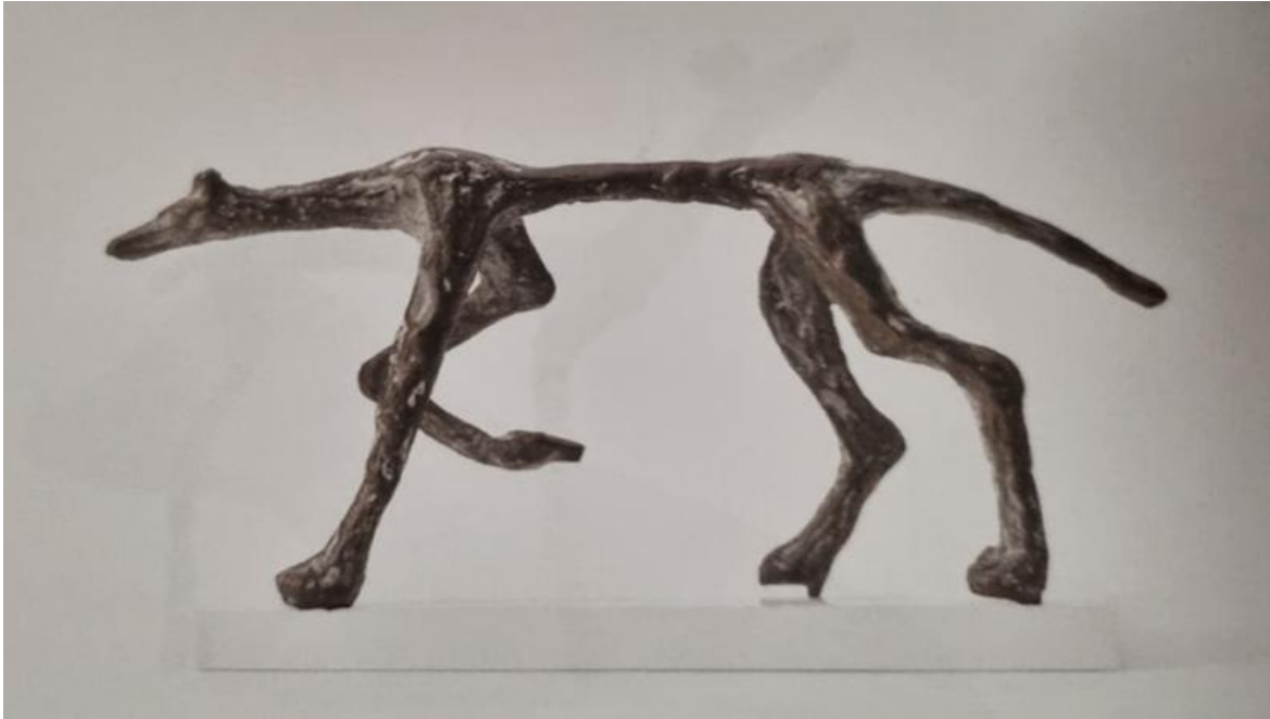
Diego Giacometti, Loup , s.d., collezione privata, Svizzera.

Questo mondo di favole e miti ad uso domestico è attraversato da un fremito che corre lungo le strutture dei mobili e delle figure stremate da un febbrile lavoro plastico. Nelle sculture come lo Struzzo (1977), il Cerbiatto (s.d.) e il Lupo (s.d.) possiamo notare una corrosione, uno sfinimento della materia, un suo tendere al nulla, come anche nelle sculture del fratello Alberto. Situate “a metà fra il Nulla e l’Essere” (Jean-Paul Sartre, La recherche de l’absolu , in Les Temps Modernes , III, n. 28, Parigi 1948), le forme rastremate allo sfinimento dai due scultori sollevano interrogativi percettivi e filosofici.