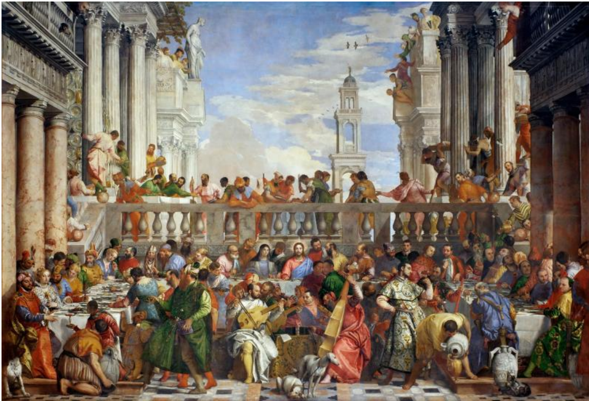
Nozze di Cana (1563) di Paolo Veronese.

dobbiamo tornare attraverso i cani. Per capire infatti quanto ci si sia allontanati da una rotta di navigazione equilibrata non possiamo procedere da soli. Facciamo fatica a comprenderci attraverso il nostro corpo. Abbiamo bisogno di una mediazione, che ci può essere fornita dall'immagine di un altro corpo. La pittura europea ha spesso scelto il cane per fornirci una traccia. Ed è quella che segue Tagliapietra.