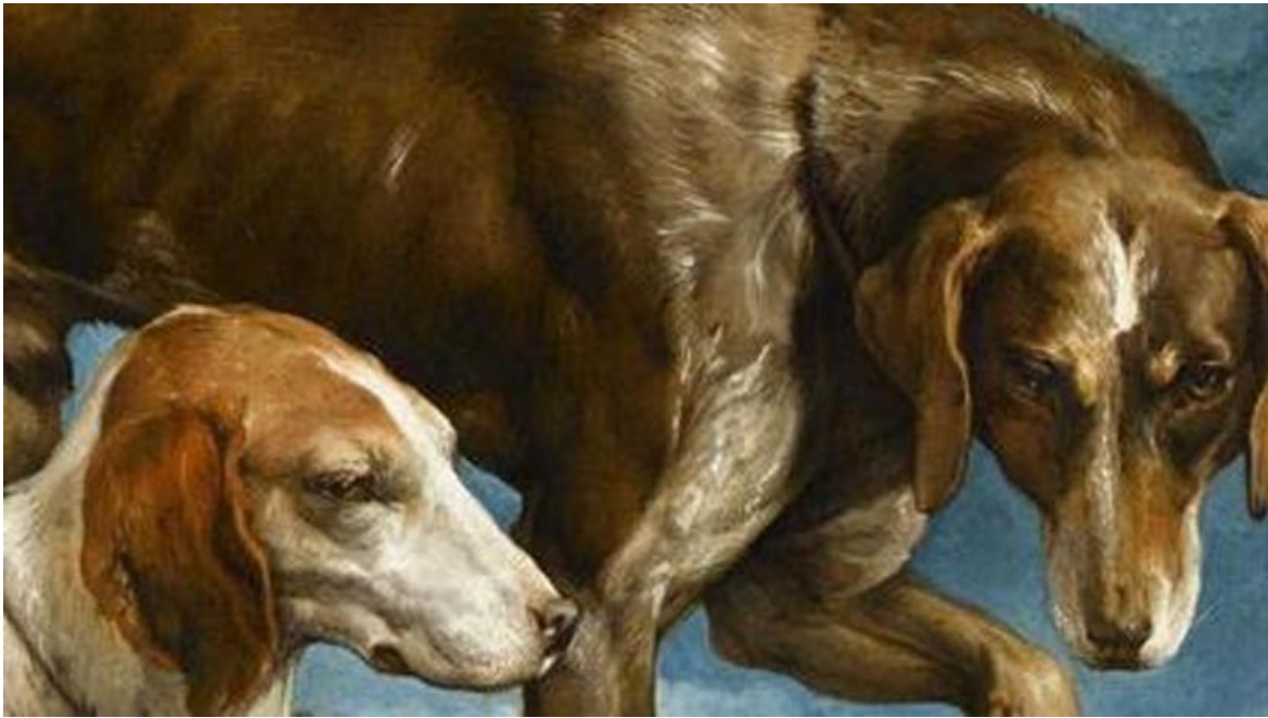
Due cani da caccia legati a un ceppo di Jacopo Bassano.

Secondo Tagliapietra, il cane dà corpo alla dimensione del tempo. Ma non si tratta del tempo cosmico della fisica, né di quello ontologico della filosofia. Il suo è il tempo “che non passa”, ovvero il tempo della vita, quello, “a termine, vissuto da ciascuno”, e che ciascuno percepisce attraverso “l’esperienza dell’anima”. È un tempo differente da quello del mondo – il tempo della natura e della storia che ci scorre attorno. È il “tempo sentito”, quello di cui siamo composti, quello che, come scrive Agostino nelle Confessioni , è impossibile definire perché coincide con il tempo del corpo vivente, che dobbiamo cercare “nella nostra esperienza, nell’emozione del tempo che siamo e che ci apparenta con tutto ciò che vive”. Ritrovare questo tempo significa riannodare i fili del nostro destino individuale a quello collettivo. Ma dove sta “il tempo che non passa”?