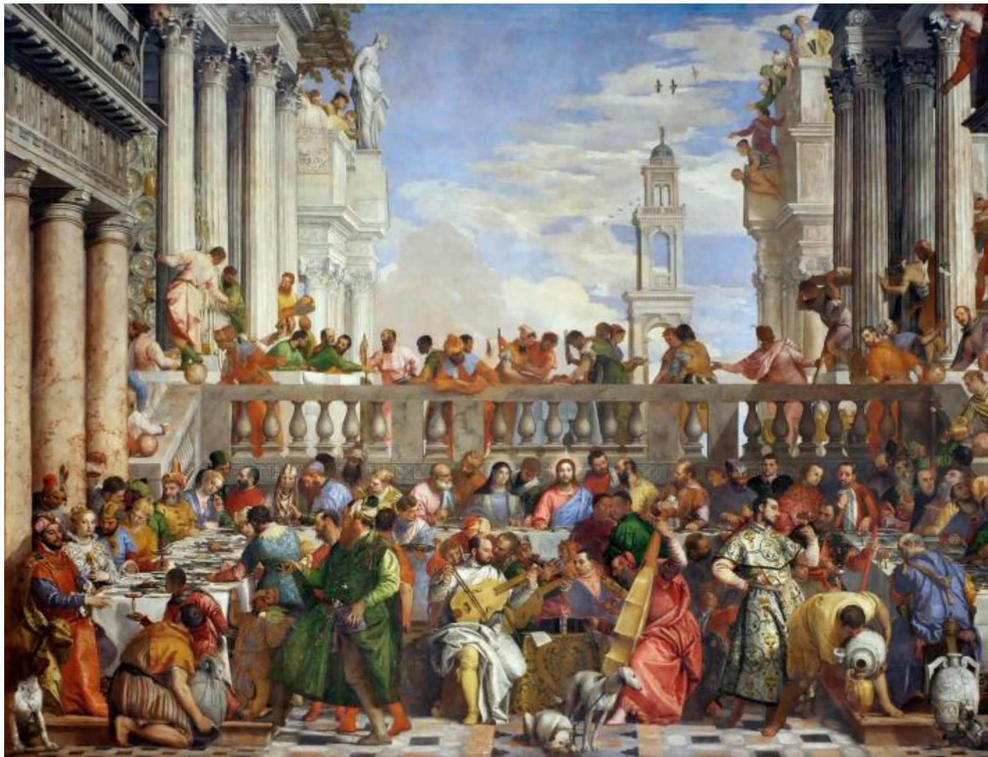
Nozze di Cana (1563) di Paolo Veronese.