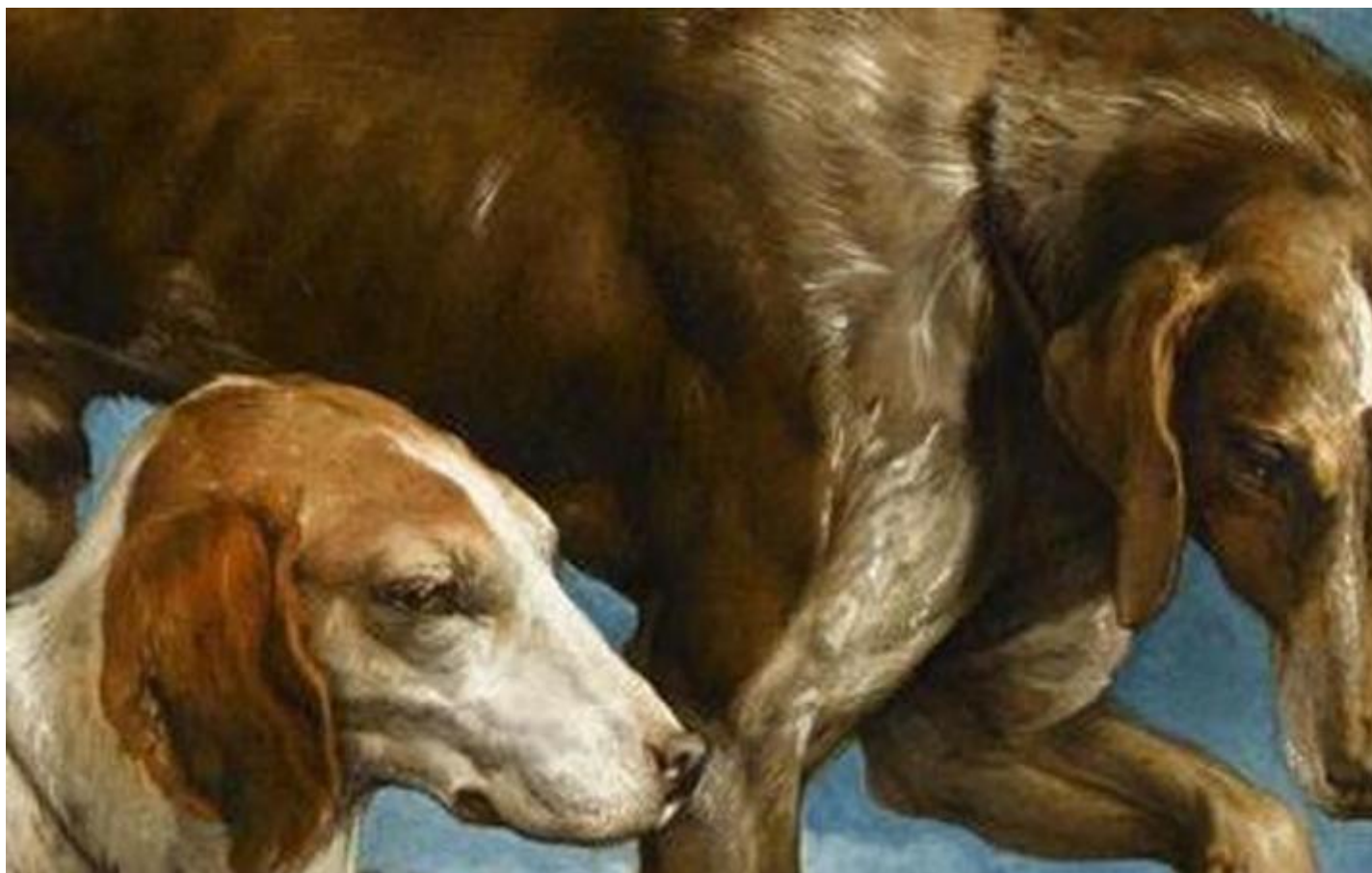
Due cani da caccia legati a un ceppo di Jacopo Bassano.

Secondo Tagliapietra, il cane dà corpo alla dimensione del tempo. Ma non si tratta del tempo cosmico della fisica, né di quello ontologico della filosofia. Il suo è il tempo “che non passa”, ovvero il tempo della vita, quello, “a termine, vissuto da ciascuno”, e che ciascuno percepisce attraverso “l’esperienza dell’anima”. È un tempo differente da quello del mondo – il tempo della natura e della storia che ci scorre attorno. È il “tempo sentito”, quello di cui siamo composti, quello che, come scrive Agostino nelle Confessioni , è impossibile definire perché coincide con il tempo del corpo vivente, che dobbiamo cercare “nella nostra esperienza, nell’emozione del tempo che siamo e che ci apparenta con tutto ciò che vive”. Ritrovare questo tempo significa riannodare i fili del nostro destino individuale a quello collettivo. Ma dove sta “il tempo che non passa”?