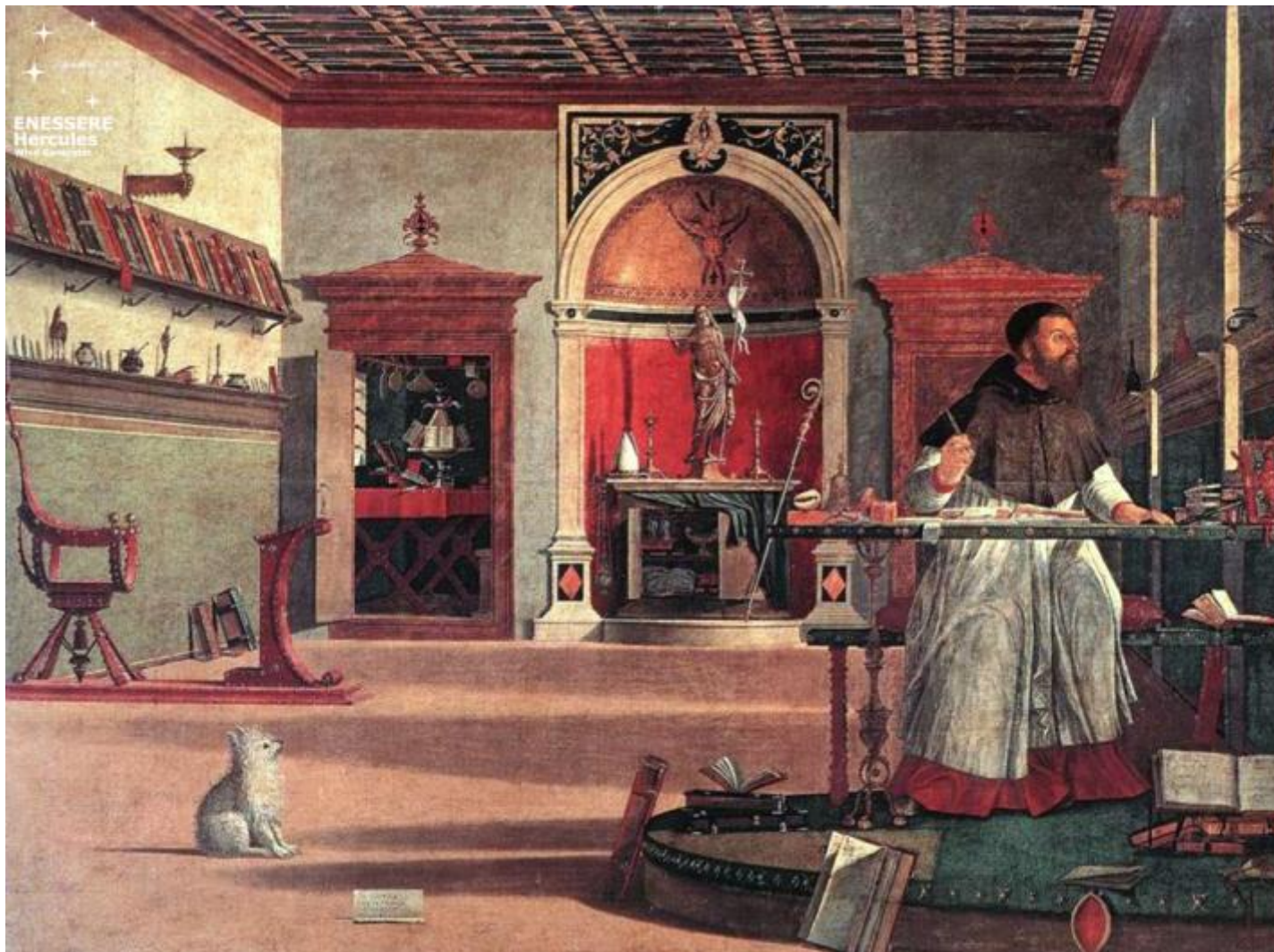
Visione di sant'Agostino di Vittore Carpaccio.

interiore e quello di fuori, la cui distonia è all'origine dell'inazione sofferente del saturnino. Ma la strada maestra per rientrare nel tempo della vita, nel "tempo a termine del vivente, quello che si dimentica sullo sfondo dell'esistenza" è l'esperienza del dolore.