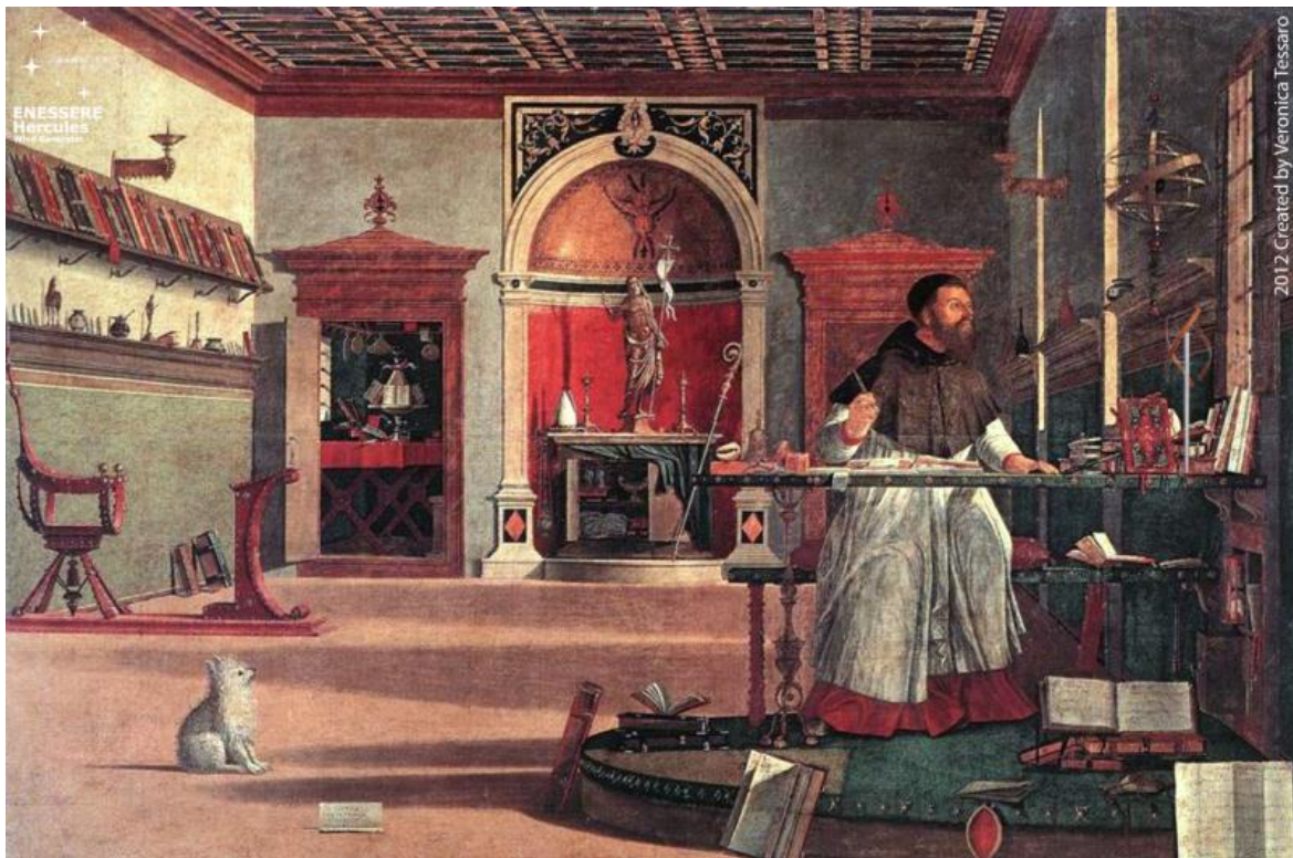
Visione di sant'Agostino di Vittore Carpaccio.

Il levriero e il terrier presenti nelle due incisioni (tra loro strettamente legate) che Albrecht Dürer realizza nel 1514, Melencolia I e San Girolamo nello studio , rappresentano i corni del problema: il quieto sonno del terrier esprime la pazienza misurata del santo che illuminato di luce divina traduce la Vulgata e si oppone alla stanchezza esauista del levriero su cui grava l'accidia del malinconico. Il messaggio è chiaro. L'accidia - in termini moderni la noia - può essere sconfitta solo dalla pazienza. Grazie ad essa capiamo che "non vi è un traguardo da raggiungere, ma solo un percorso da seguire". La pazienza ristabilisce l'equilibrio tra il tempo interiore e quello di fuori, la cui distonia è all'origine dell'inazione sofferente del saturnino. Ma la strada maestra per rientrare nel tempo della vita, nel "tempo a termine del vivente, quello che si dimentica sullo sfondo dell'esistenza" è l'esperienza del dolore.