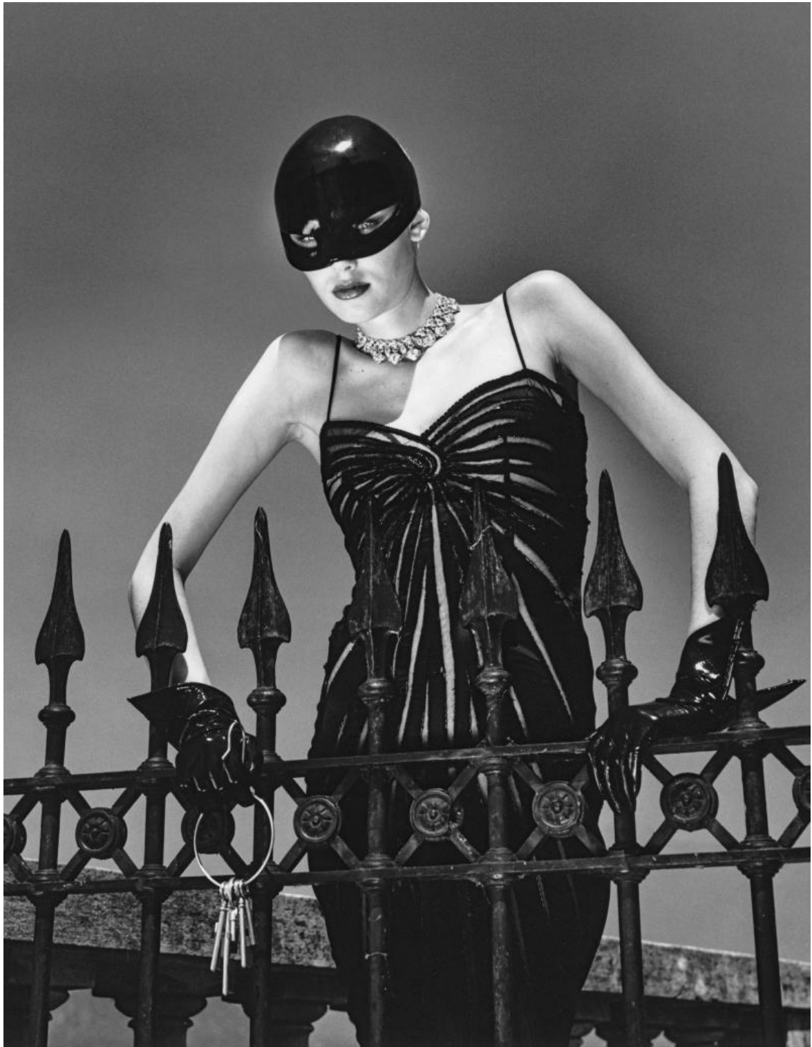
Helmut Newton, Vogue Italia. Como, 1996 Italian Vogue. Como, 1996

O fuggendo per certe strade di cemento, annoiate a bordo piscina, appoggiate distrattamente al balcone, immobilizzate sempre nell'attimo del loro essere così come sono, nonostante noia o distrazione, e nell'aggressione della luce, desiderabili sempre.