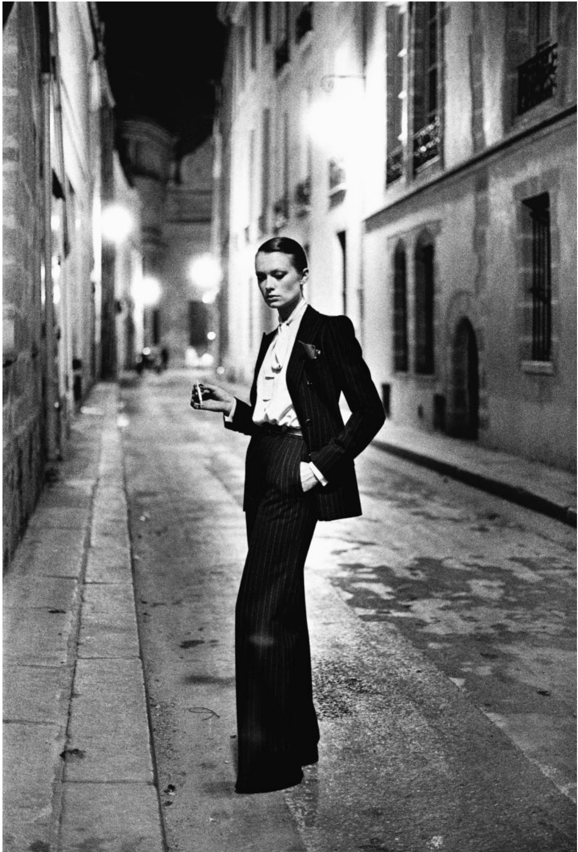
Helmut Newton, Rue Aubriot, Yves Saint Laurent, Vogue Francia. Parigi, 1975 Rue Aubriot, Yves Saint Laurent, French Vogue. Paris, 1975

Dai primi passi degli anni Sessanta, e a partire da quelli, Newton inizia a cogliere e ad accentuare l'aspetto dominante, il nucleo fondativo di quel suo nuovo mondo