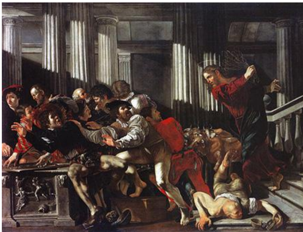
Francesco Boneri detto Cecco del Caravaggio, Cacciata dei mercanti dal tempio , olio su tela, 129,5 x 174 cm, Berlino, Staatliche Museen, Gemäldegalerie.

Assieme al suo quadro gemello, ma meno svolto, conservato ad Atene, il cosiddetto Fabbricante di strumenti è esposto in questi mesi e ancora per poche settimane nella prima mostra monografica dedicata a Francesco Boneri, passato alla storia come Cecco del Caravaggio perché fu modello, allievo, e probabilmente amante: “ragazzo” (“his boy”) di Caravaggio, come lo definisce un viaggiatore inglese. L’esposizione, imperdibile, potrà essere visitata fino al 4 giugno, nella sede appena rinnovata dell’Accademia Carrara, a Bergamo (proprio queste, difatti, sarebbero le zone d’origine del pittore: le medesime terre lombarde di Caravaggio, secondo la ricostruzione di Gianni Papi confermata anche dalle ricerche fatte in occasione della mostra da Francesca Curti e Gianmario Petrò)