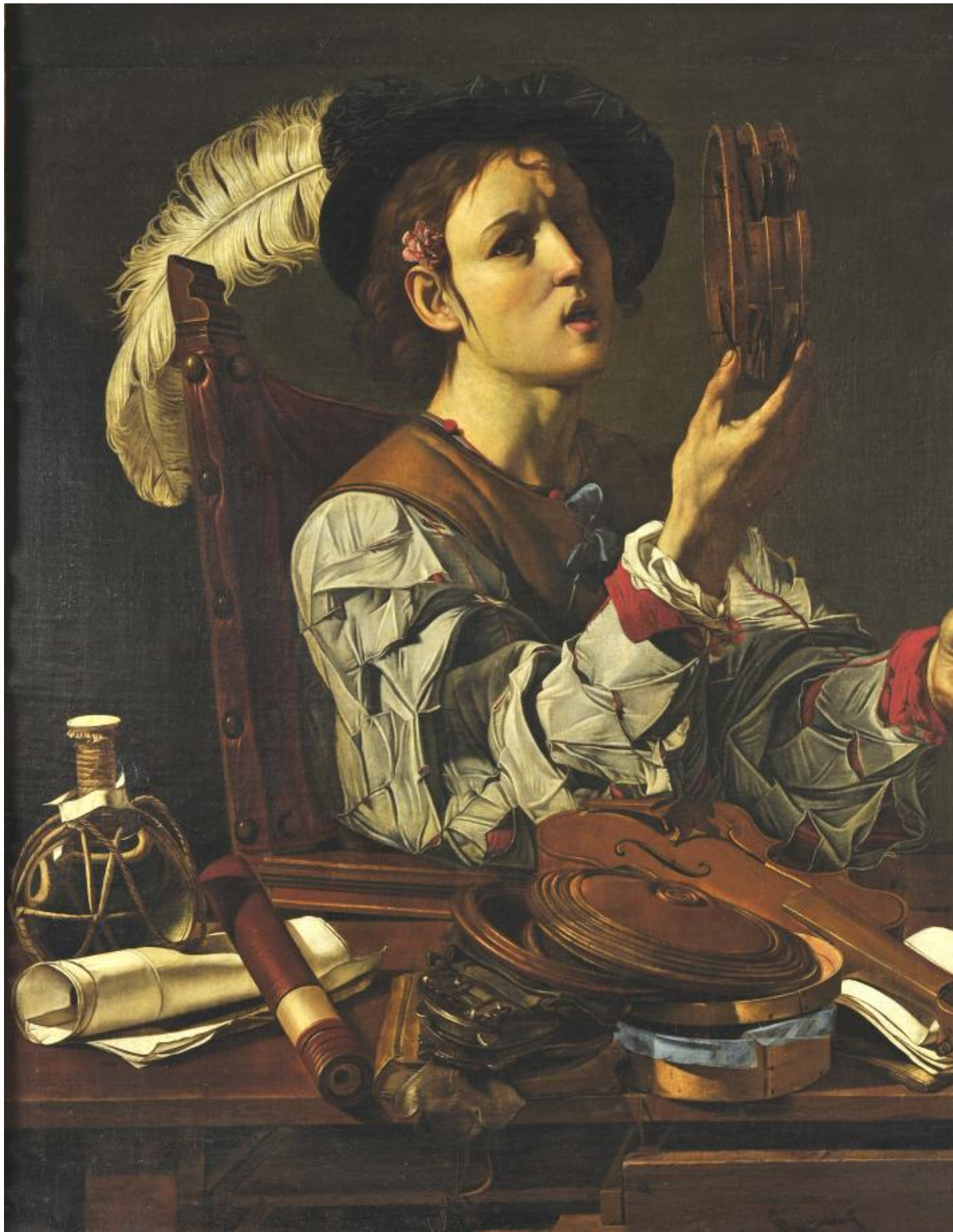
Cecco del Caravaggio, Fabbricante di strumenti musicali , olio su tela, 117 x 98 cm, Atene, National Gallery – Alexandros Soutzos Museum.