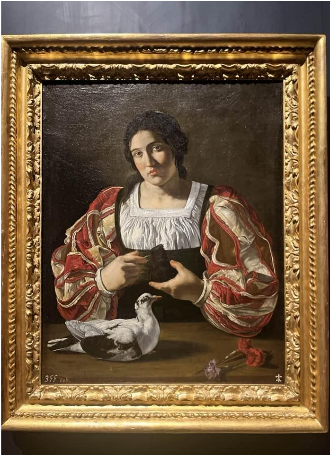
Cecco del Caravaggio, Ragazza con colomba, olio su tela, 66x47 cm, Madrid, Museo Nacional del Prado