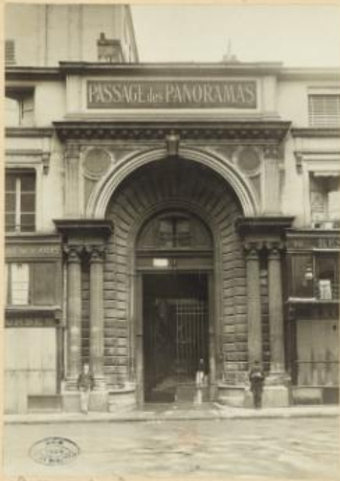
Passage des Panoramas H. 24772