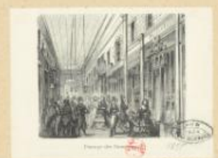
Passage des Panoramas H. 24774