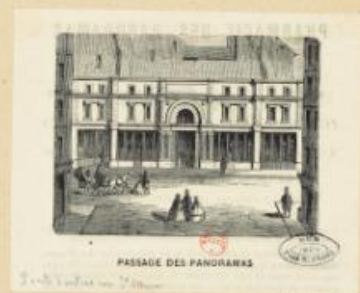
PASSAGE DES PANORAMAS H. 24773