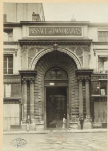
Passage des Panoramas H. 24772