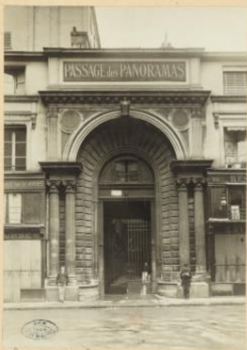
Passage des Panoramas H.24772