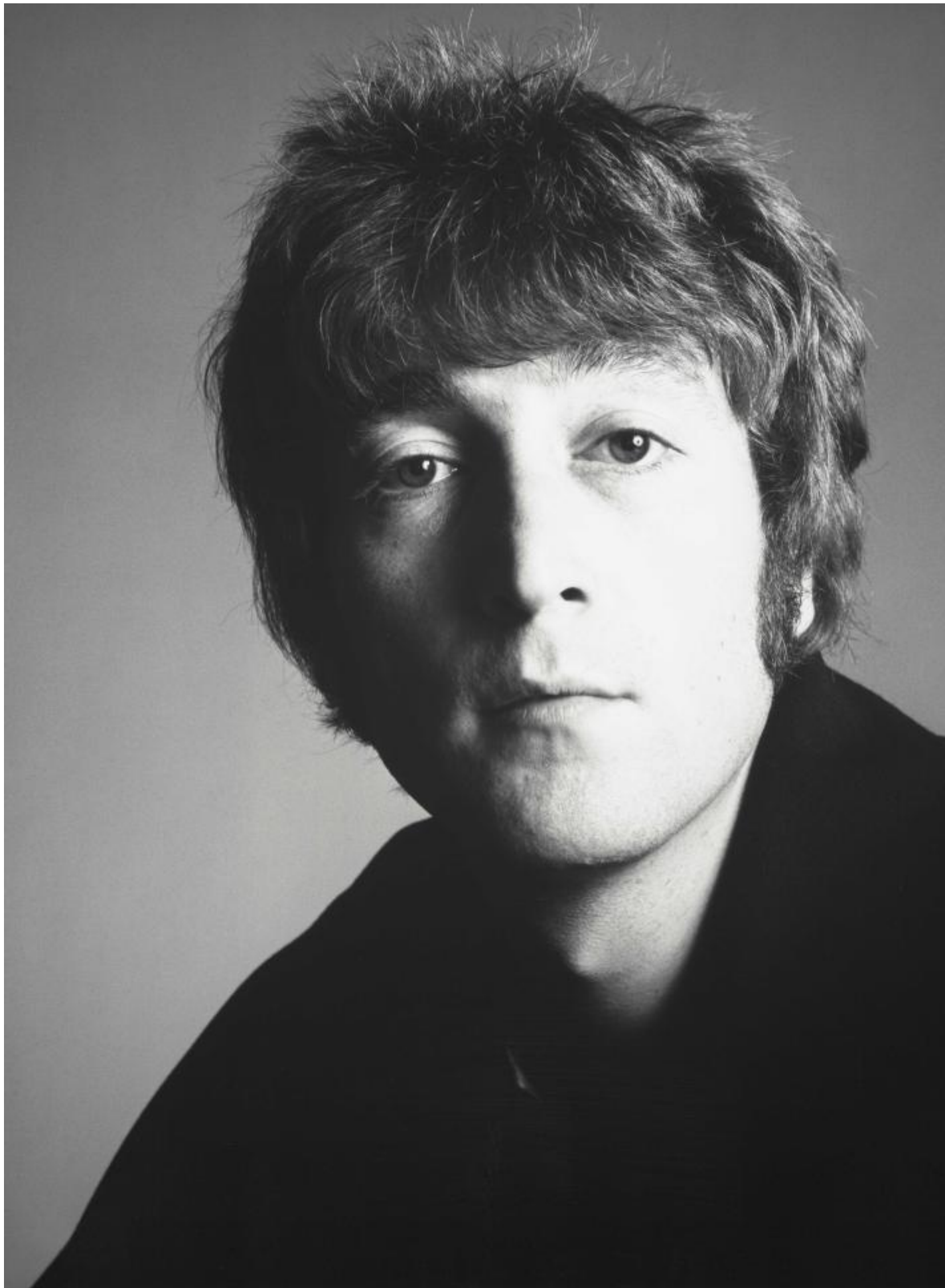
John Lennon, musician, The Beatles, London, England, August 11, 1967.