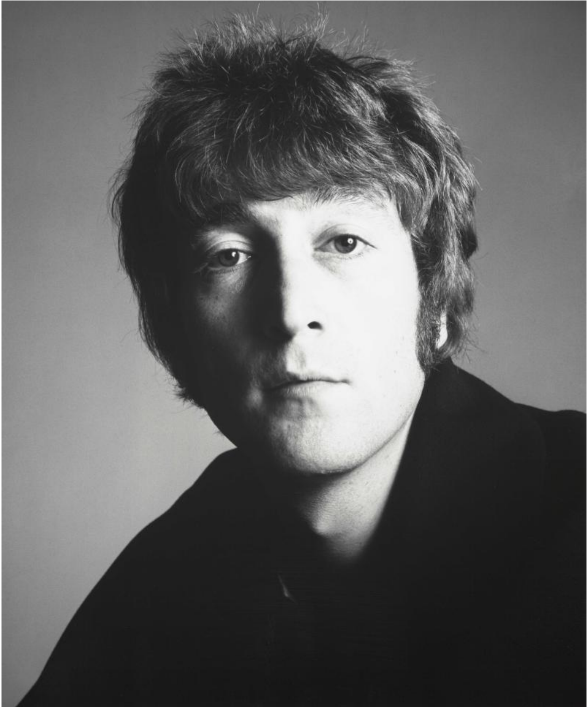
John Lennon, musician, The Beatles, London, England, August 11, 1967.