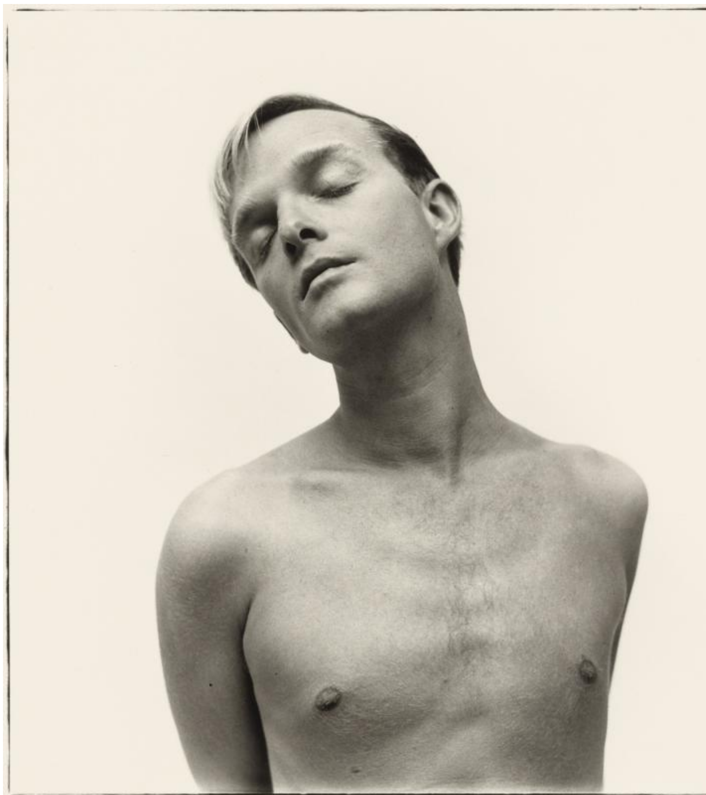
Truman Capote, writer, New York, October 10, 1955.

In un'altra circostanza Isabella Rossellini raccontava ad altri studenti di una seduta di posa con lui. Descriveva come scattava a mitraglia, apparentemente dunque affidando al caso di catturare tra le decine, centinaia di scatti quello che sarebbe andato bene per l'occasione, finché a un certo punto, intanto lei si era abbandonata ai propri pensieri, visto che lui non le chiedeva niente su come mettersi o cosa fare, si sente dire: "Ecco, pensa di nuovo la cosa che hai pensato un momento fa"!