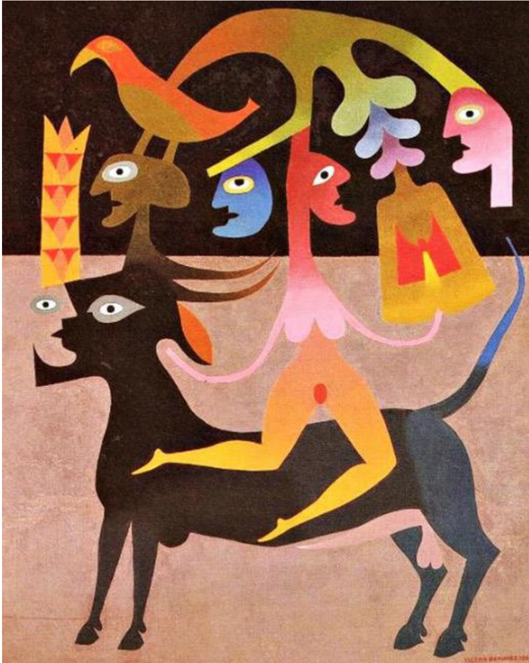
Dipinto di Victor Brauner (Piatra Neam?, 1903 – Parigi, 1966).

L'idea che gli umani siano una specie stabile e affidabile risulta piuttosto problematica. Se iniziamo a sconfinare e a pensare il mondo al di là delle categorie e delle pratiche che evidenziano bisogni difensivi di identità e stabilità, di soluzioni finali e corpi stabili, è l'idea stessa di una supposta eccezionalità della specie che non funziona. Lo dimostra lo stato del mondo. E, forse, riconoscendo di essere una specie mostruosa si aprirebero nuove strade là dove "le cose si snodano e sconfinano".