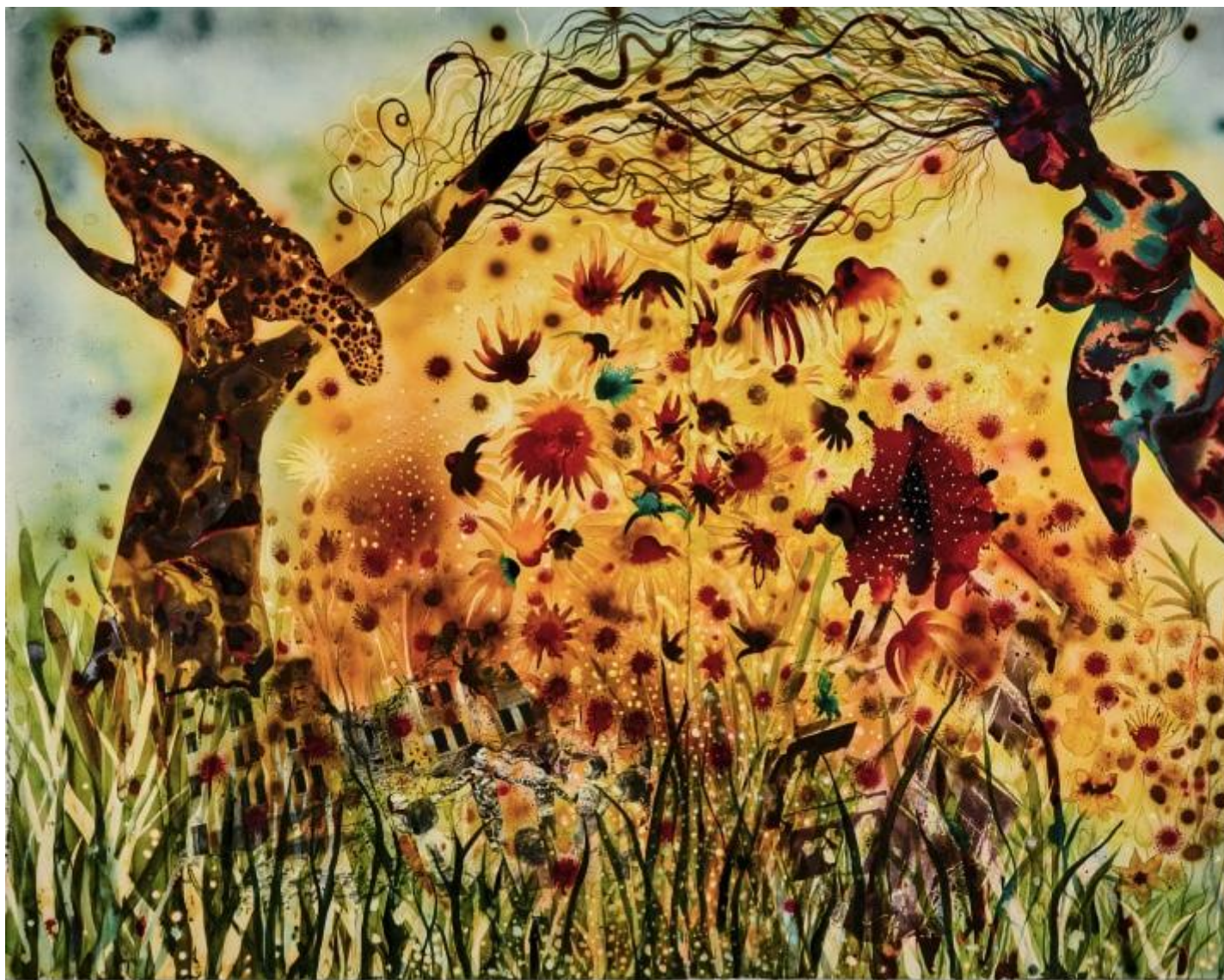
Shiva Ahmadi (Teheran 1975)

Oggi le rappresentazioni artistiche che parlano dell'intreccio mi sembrano sovente meno perturbanti, meno forza di rottura e più mercato. Quelle a temi afrofuturisti intrecciati con l'ecofemminismo, pur interessanti, sono già in parte discorsive. Tuttavia è interessante notare che una certa cifra stilistica in cui l'origine non è certamente la supposta purezza della "bianchezza" è per molti versi transnazionale. Basta cogliere l'aria di famiglia che esiste tra l'artista kenyota Wangheci Mutu e l'iraniana Shiva Ahmadi.