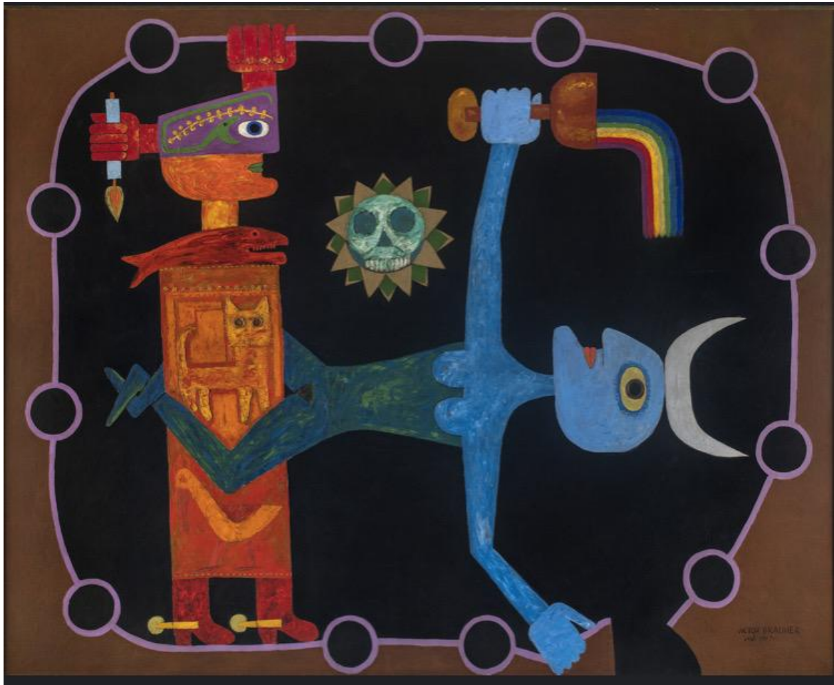
Dipinto di Victor Brauner (Piatra Neamț, 1903 - Parigi, 1966).

Il concetto contemporaneo di “umano” nasce da quella dimensione dell’illuminismo che si pensava appunto culmine della ragione e universale, da quello sguardo che nel sapere enciclopedico coltivava l’ordine delle categorie e delle gerarchie e - ogni volta che aveva a che fare con lingue, saggezze e campi percettivi di cui nulla poteva sapere - costruiva insieme all’“umano”, le figure dei “non umani” o dei “meno umani”. Intrecciandole a volte con l’esotica figura idealizzata di un “buon selvaggio”, icona di un’innocenza pre-adamica perduta.