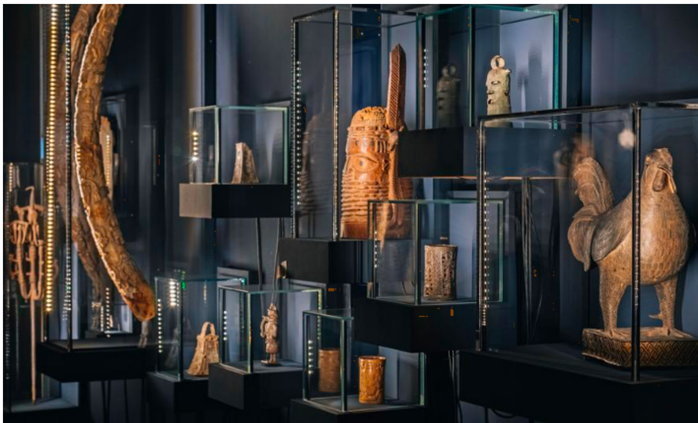
L'ontologia delle teche.

“Anche senza visitatori, il museo non è mai completamente silenzioso. L'edificio principale, che risale agli anni Venti del XIX secolo e da allora è stato ampliato e riconfigurato, è pieno di scricchiolii, come sono soliti fare i vecchi edifici. L'aria condizionata ronza. Le porte sferragliano. Le brezze improvvise sibilano dietro gli angoli e nei vani degli ascensori. Quando le guardie di sicurezza si muovono tra le 94 sale aperte al pubblico, lungo il labirinto di uffici e passaggi nel retrobottega e nella fitta rete di magazzini sotterranei, vengono a conoscenza dei suoni più intimi dell'edificio: scricchiolii e gemiti, soffocati durante l'orario di apertura, possono diventare sconcertanti di notte. Le guardie sono abituate a questi disturbi. Ma ogni tanto una pattuglia si imbatte in un rumore, in un lampo di movimento o semplicemente in un improvviso brivido nella bocca dello stomaco, che ferma anche i veterani più incalliti.”