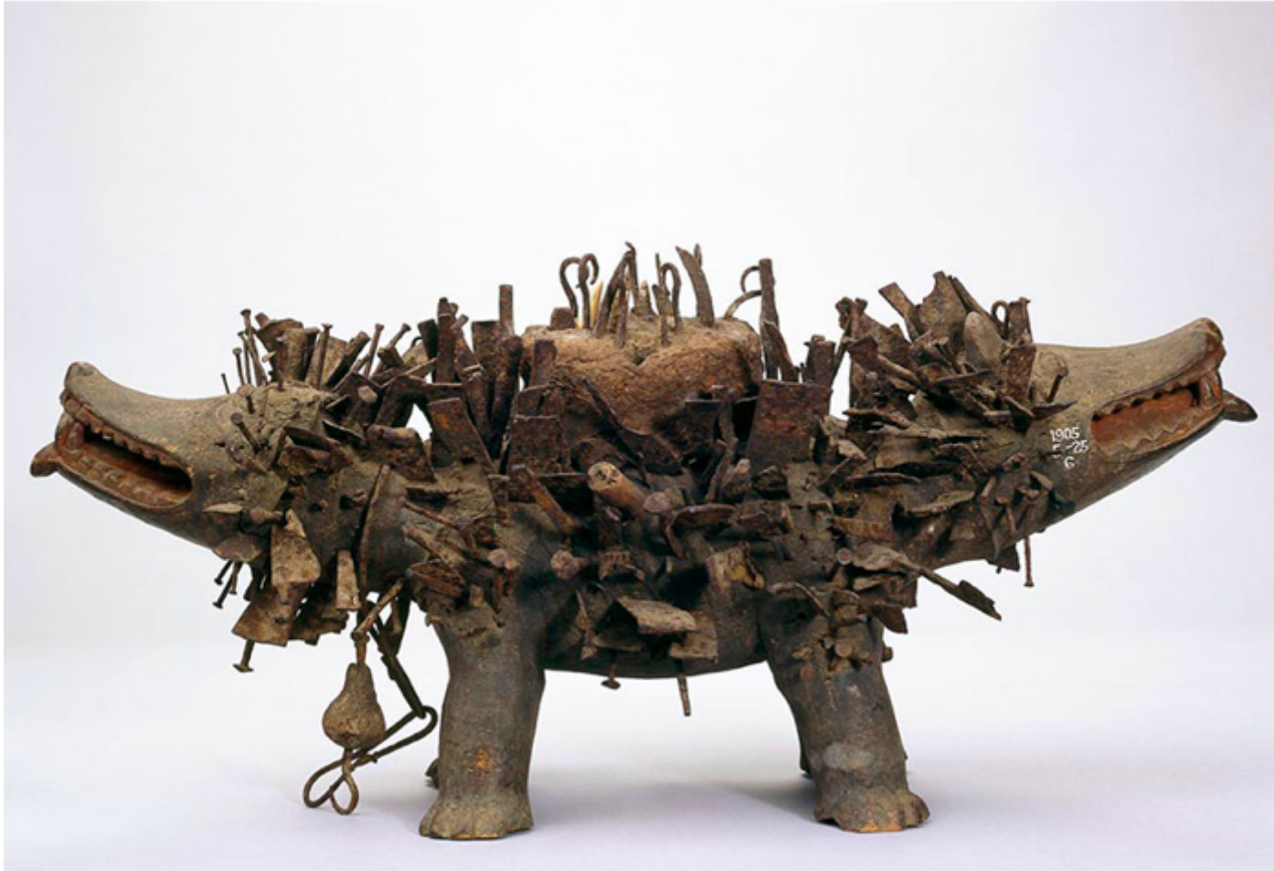
Cane a due teste, Congo XIX secolo, British Museum.

È in queste che Bayo chiama /Cracks/ (crepe/fratture) – traducendo così il termine fêlures di Deleuze – che si manifestano le tensioni territoriali, le intensità sotterranee che generano linee di fuga verso l'altrementi. A loro modo le crepe sono potenti dispositivi politici che raccontano di un potenziale trasformativo pur nel rischio che tutto resti immutato, malgrado le migliori intenzioni. E tuttavia le crepe sono dimensioni perturbanti, "tensioni potenti nel tessuto di ciò che ci appare familiare Invitano a qualcosa di diverso dalla ricerca di giuste soluzioni, o dal cercare vittoria sui nemici. Invitano a un postattivismo e all'assunzione di rischi e pratiche inedite che consentano di affrontare le crisi contemporanee."