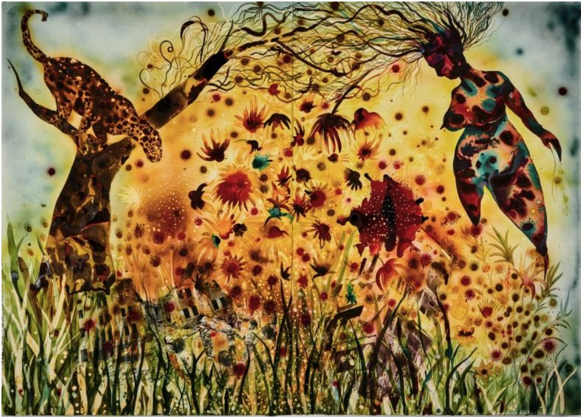
Shiva Ahmadi (Teheran 1975)

Oggi le rappresentazioni artistiche che parlano dell'intreccio mi sembrano sovente meno perturbanti, meno forza di rottura e più mercato. Quelle a temi afrofuturisti intrecciati con l'ecofemminismo, pur interessanti, sono già in parte discorsive. Tuttavia è interessante notare che una certa cifra stilistica in cui l'origine non è certamente la supposta purezza della "bianchezza" è per molti versi transnazionale. Basta cogliere l'aria di famiglia che esiste tra l'artista kenyota Wangheci Mutu e l'iraniana Shiva Ahmadi.