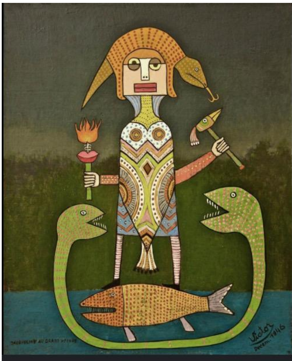
Dipinto di Victor Brauner (Piatra Neam?, 1903 – Parigi, 1966).

Bayo Akomolafe, è un filosofo di origine nigeriana che appartiene a quella nuova generazione di intellettuali transnazionali che attingono alla ricchezza di un'eredità culturale ibridante e animata che intreccia i contributi più vitali del pensiero postumanista e neomaterialista immaginando un diverso rapporto con il pianeta, il tempo, il potere.