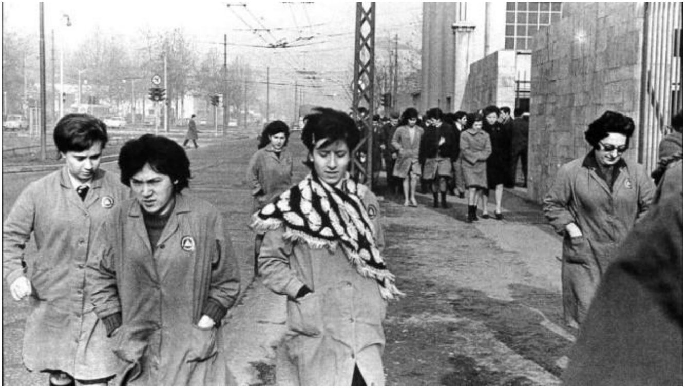
Viale Migliara, operaie della Siemens in uscita verso la mensa. Milano, 1964 © Carla Cerati.

Ricordo, tanti anni fa, era la primavera del 1960, un episodio di quelli che ti si stampano nella memoria e ti fanno decidere per sempre da che parte stare, a che cosa non vorrai mai partecipare, di che cosa avere davvero paura. La gamba sinistra ingessata dalla caviglia all'anca per una brutta caduta, stavo giocando in camera mia, quando d'un tratto sentii un urlo e grande concitazione per le scale e all'ingresso. L'inquilina del piano di sotto – il marito lavorava con mio padre e lei e i loro quattro figli bambini erano amici di famiglia – era stata morsa dalla domestica (già), che di tanto in tanto veniva anche da noi. Che cosa le avesse fatto 'perdere la testa' non mi fu dato sapere. So solo che quella donna piena di guai e di energia, così simile alla figura di destra nella foto di Cerati, finì in manicomio. Alle donne come lei non era concessa nessuna deroga alle regole del gioco.