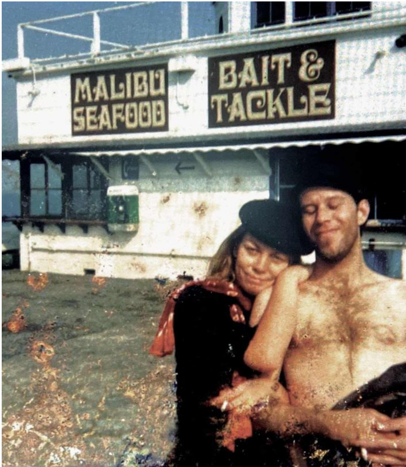
Rickie Lee Jones e Tom Waits, Atlantic Books.