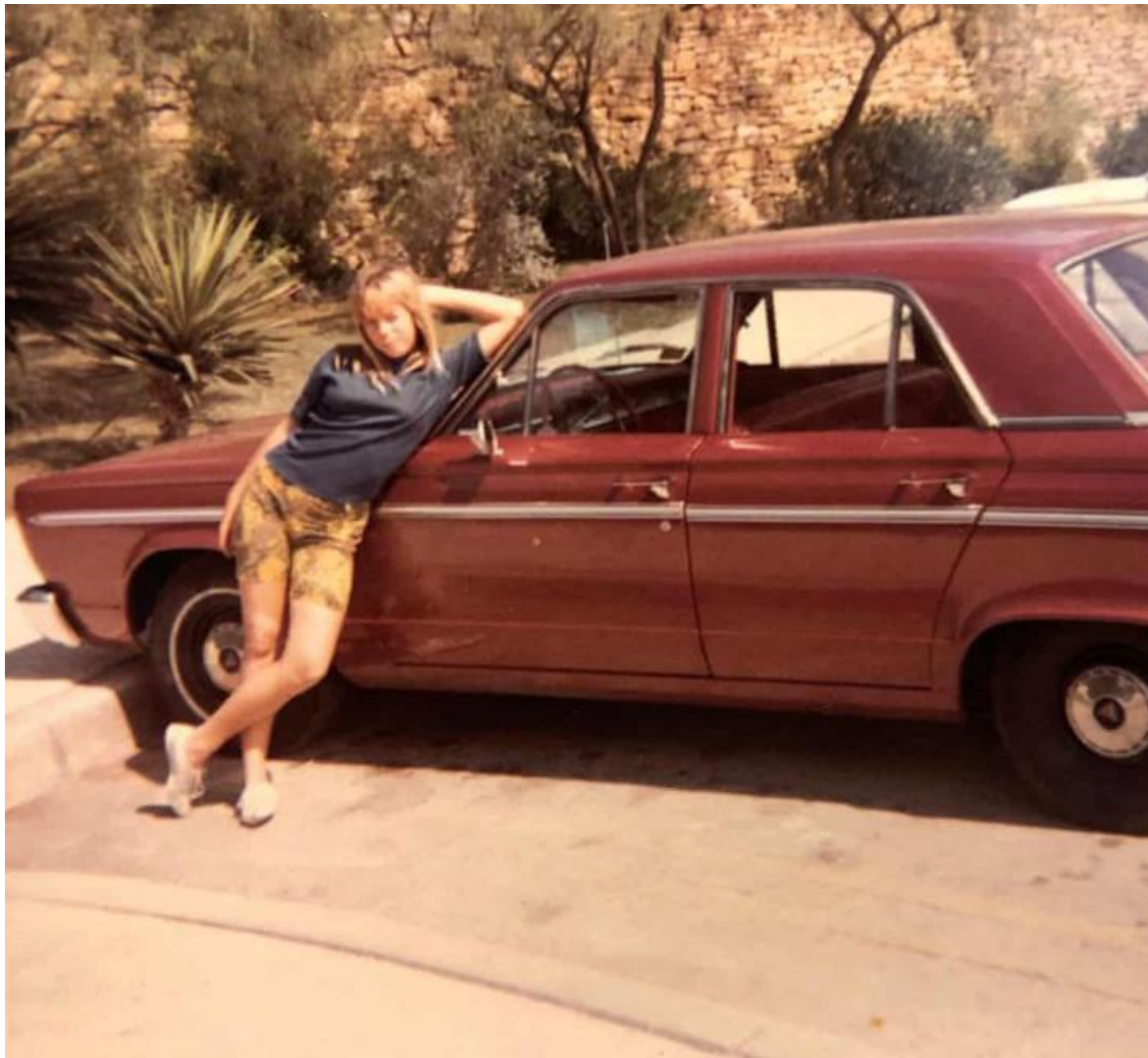
Rickie Lee Jones - Atlantic Books.

Chissà se i posteri ci perdoneranno per aver cercato la libertà e persino un pizzico di poesia in un pieno di benzina. Probabilmente chi ha bruciato ettolitri di combustibile per cercare un proprio posto nel mondo in futuro sarà sottoposto a severo giudizio. Sarà considerato uno dei tanti che ha egoisticamente contribuito al collasso del pianeta. Confidiamo in un po' di clemenza. Speriamo che l'aver letto i libri di Kerouac o l'aver sognato ascoltando le canzoni di Rickie Lee Jones, e magari anche l'aver riempito il serbatoio dell'automobile una volta di troppo, non ci consegnino al rogo eterno. Parrà forse sconcertante alle generazioni future, ma a fine anni '70 ci fu una ragazza che cavò della poesia dal logo di un'azienda petrolifera. Sarà certamente ricordata per i suoi dischi e per le sue canzoni, ma è possibile che Rickie Lee Jones sarà pure ricordata come l'ultima stella della Texaco, una ragazza diventata donna macinando asfalto, quando fare un pieno di benzina poteva ancora essere considerato non solo un gesto anticonformista, ma un atto poetico.