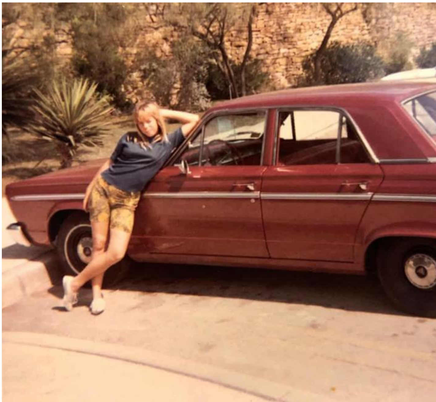
Rickie Lee Jones - Atlantic Books.

Chissà se i posteri ci perdoneranno per aver cercato la libertà e persino un pizzico di poesia in un pieno di benzina. Probabilmente chi ha bruciato ettolitri di combustibile per cercare un proprio posto nel mondo in futuro sarà sottoposto a severo giudizio. Sarà considerato uno dei tanti che ha egoisticamente contribuito al collasso del pianeta. Confidiamo in un po' di clemenza. Speriamo che l'aver letto i libri di Kerouac o l'aver sognato ascoltando le canzoni di Rickie Lee Jones, e magari anche l'aver riempito il serbatoio dell'automobile una volta di troppo, non ci consegnino al rogo eterno. Parrà forse sconcertante alle generazioni future, ma a fine anni '70 ci fu una ragazza che cavò della poesia dal logo di un'azienda petrolifera. Sarà certamente ricordata per i suoi dischi e per le sue canzoni, ma è possibile che Rickie Lee Jones sarà pure ricordata come l'ultima stella della Texaco, una ragazza diventata donna macinando asfalto, quando fare un pieno di benzina poteva ancora essere considerato non solo un gesto anticonformista, ma un atto poetico.