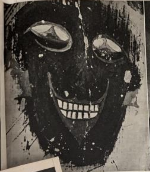
WOMAN? This painting, believed to be a portrait of the woman who was Aleister Crowley's favourite 'magical lover' in the bedroom of the Abbey of Cefalu.