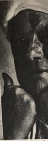
THE BEAST, whose number after he had been expelled from the Abbey... The police ordered the Abbey...