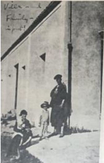
Villa... Family... in front!