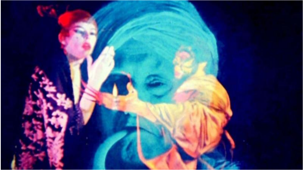
Inauguration of the Pleasure Dome