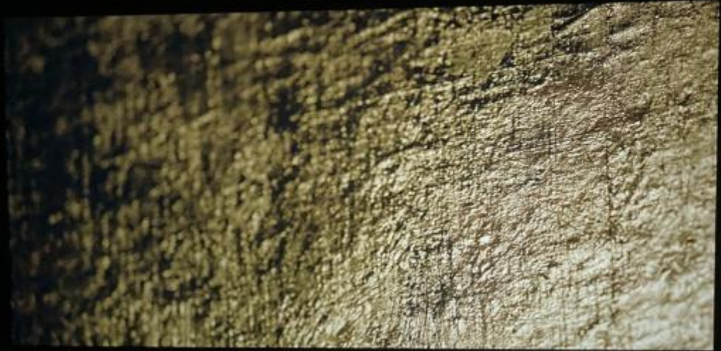
Philippe Parreno, La Quinta del Sordo , 2021, Venezia Punta della Dogana.

Il secondo film è esposto nella mostra del Mart di Rovereto Giotto e il Novecento (dal 6 dicembre 2022 e prolungata fino al 4 giugno 2023), Buon Fresco di Tacita Dean. L'intento della mostra è chiaro: cercare nell'arte del Novecento le influenze, più o meno dichiarate, di Giotto in altri artisti. A chiusura della mostra, dopo la sezione dedicata a esempi nell'arte non italiana e più recente, chiude l'esposizione il film realizzato nel 2014 dalla Dean. Si tratta di trentadue minuti retroproiettati in pellicola 16mm, lo stesso formato utilizzato in fase di ripresa, su di uno schermo dal formato quadrato sospeso nel vuoto di una piccola stanza scura. Il film è di un rigore formale incorrotto: solo riprese statiche di dettagli degli affreschi di Giotto nella Cappella Scrovegni, senza movimento alcuno né aggiunta di qualsivoglia testo e manco meno di audio – unico commento sonoro è il continuo rullio del proiettore. Si tratta di un allestimento tipico per le opere della Dean inserite in esposizioni o gallerie; come anche per il soggetto del film, che si inserisce in una serie di vari altri casi in cui si è dedicata a un artista o a un'opera d'arte, come ad esempio Merce Cunningham, Cy Twombly, Mario Merz, Giorgio Morandi o su un disegno lasciatole da un frate.