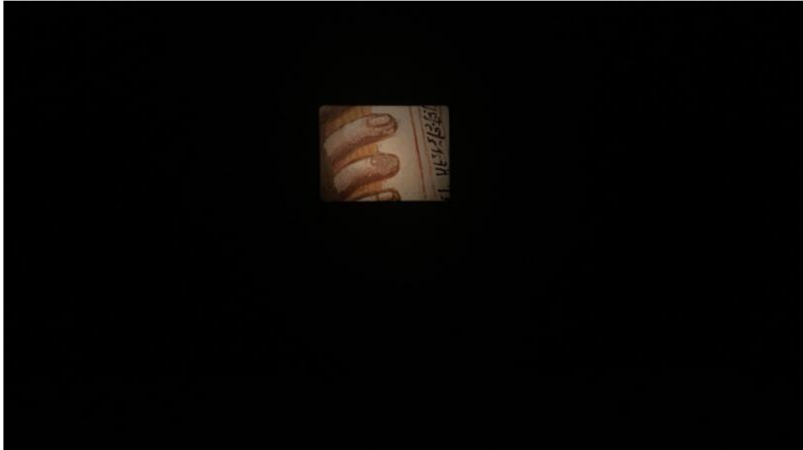
Tacita Dean, Buon Fresco, 2014, Rovereto.

Ma se in Giotto la luce interna sembra mancare per via dell'assenza del fondo oro, dello svet che è la luce, questa è come recuperata dalla Dean, che è forse più bizantina di Giotto.