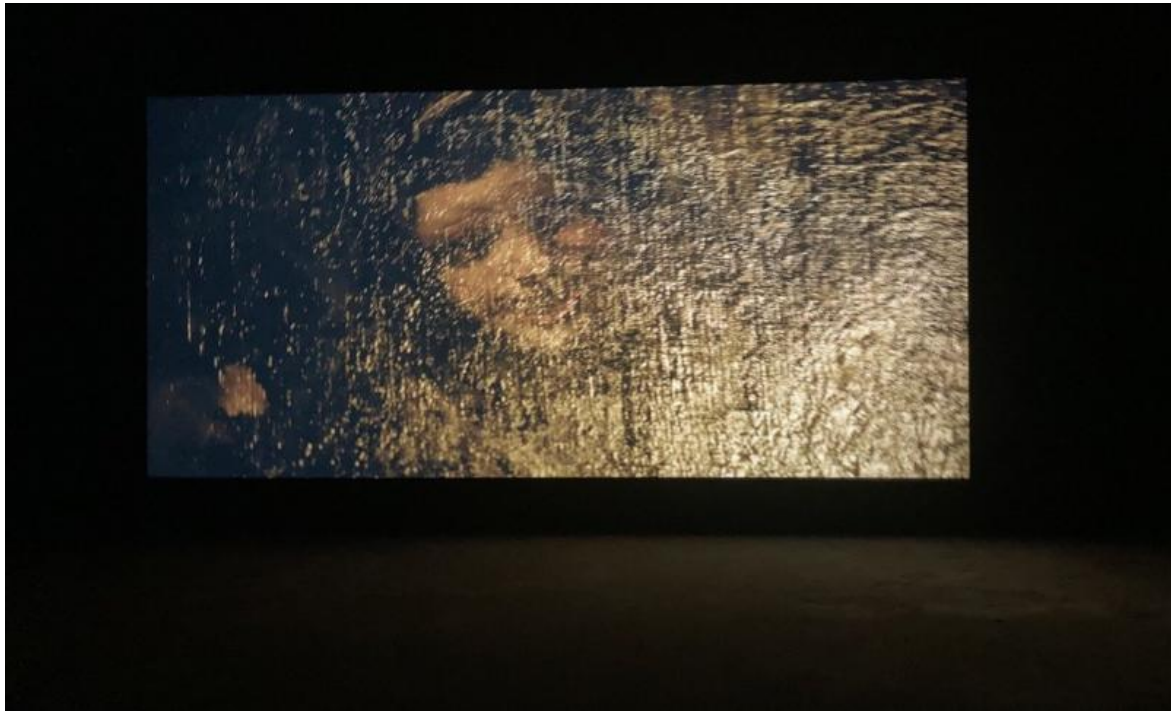
Philippe Parreno, La Quinta del Sordo , 2021, Venezia, Punta della Dogana.