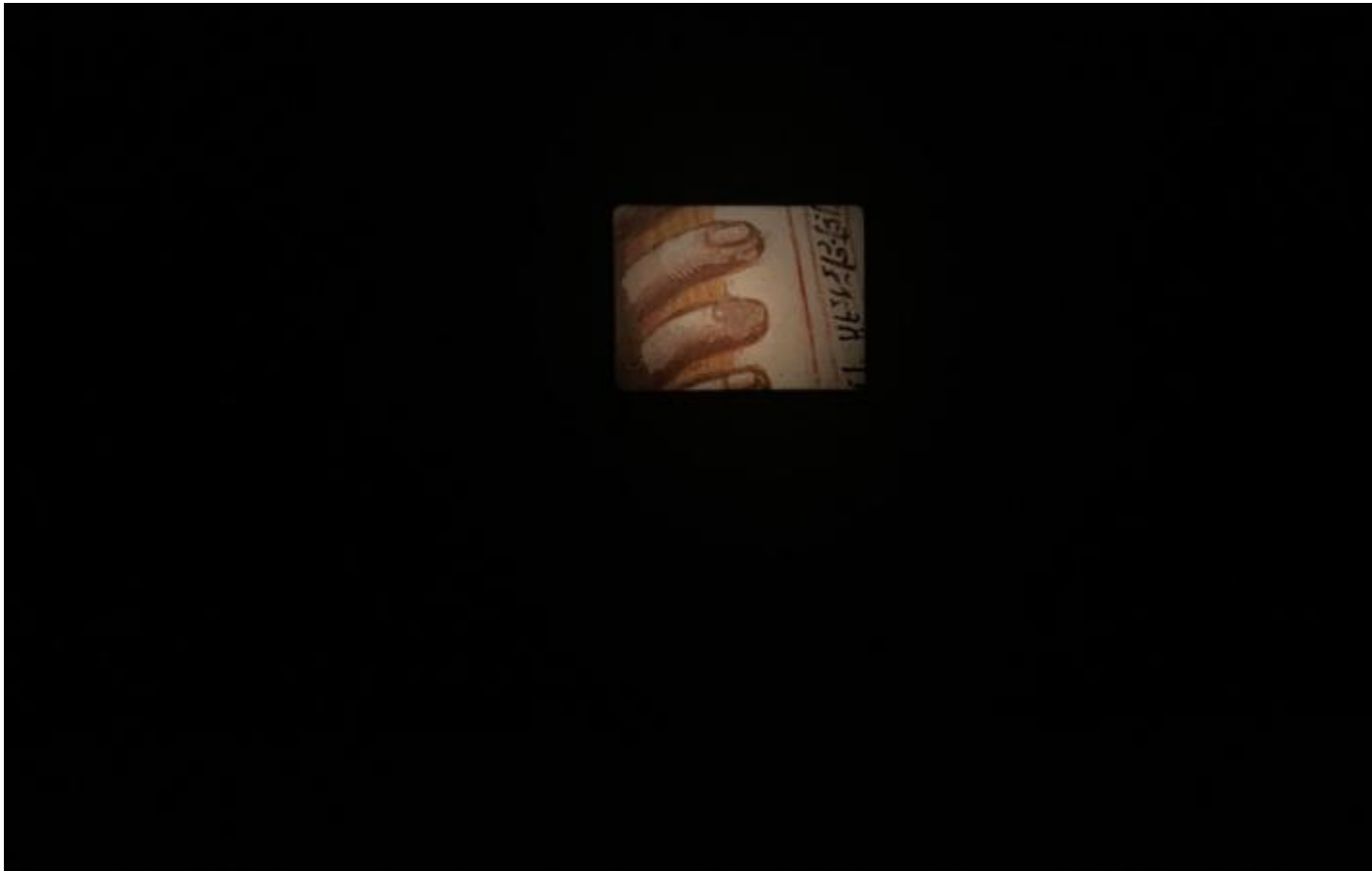
Tacita Dean, Buon Fresco, 2014, Rovereto.

Ma se in Giotto la luce interna sembra mancare per via dell'assenza del fondo oro, dello svet che è la luce, questa è come recuperata dalla Dean, che è forse più bizantina di Giotto.