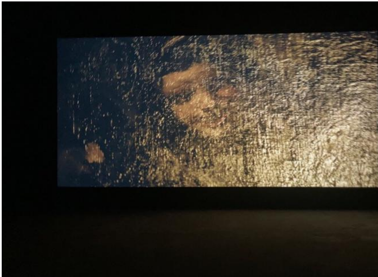
Philippe Parreno, La Quinta del Sordo , 2021, Venezia, Punta della Dogana.

Tutt'altro testimonia la pittura su tavola dell'icona e l'affresco. Le due tecniche sono totalmente assimilabili: "Storicamente la pittura di icone nasce dalla tecnica della pittura murale, e di quest'ultima è in sostanza la vita stessa, affrancata dalla dipendenza esterna dalle contingenti costrizioni architettoniche e da altre ancora". E infatti "La prima cura del pittore di icone è tramutare la tavola in muro ". Una stabilità e una fissità del supporto che sono connaturate con l'ontologia del loro soggetto divino. Questo è alla base per gli affreschi di Giotto e del Buon Fresco della Dean. Una durezza che la Dean riprende tramite la scelta, date le alternative che oggi esistono, del supporto e della tecnica della pellicola cinematografica: la pellicola conserva un grado di resistenza maggiore e una materialità tangibile, una resistenza e una fissità soprattutto laddove messa a confronto con la tecniche digitali. Ad esempio mettendo a confronto il film della Dean al video di Parreno; e in raffronto alla proiezione digitale certamente più versatile nelle modalità di proiezione e quindi fruizione.