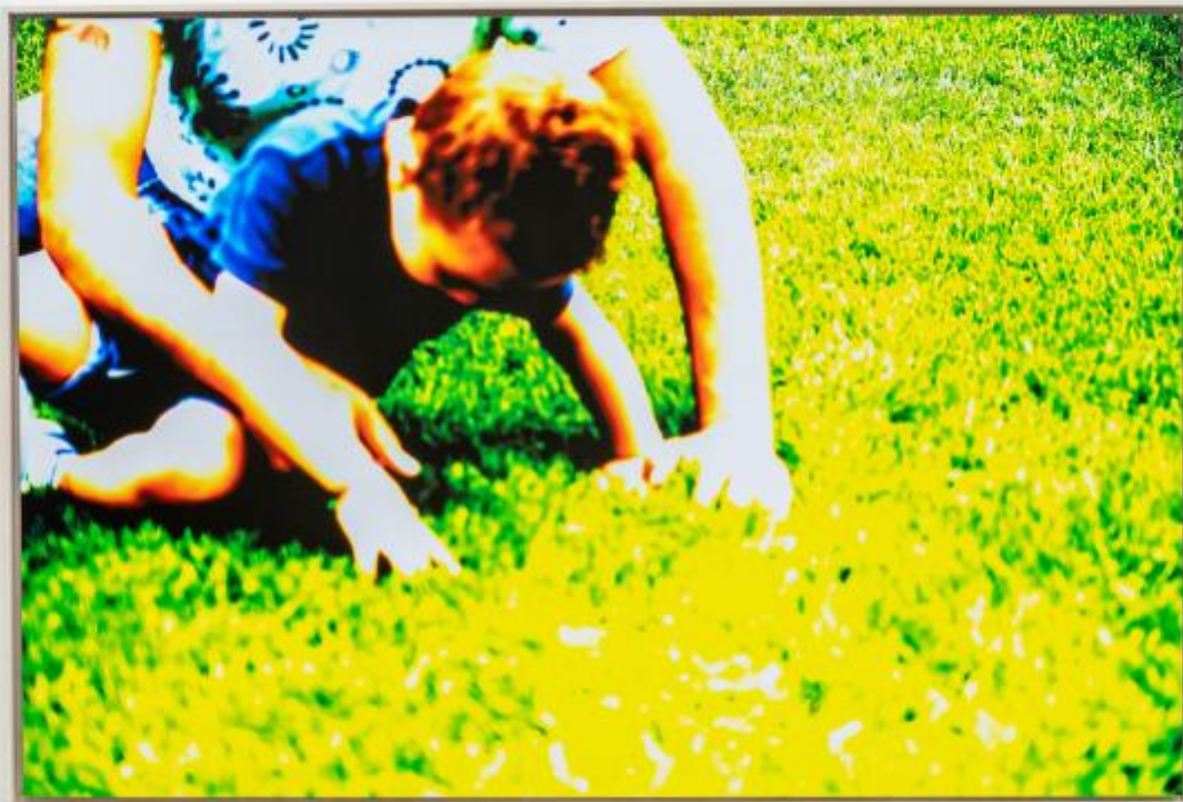
Marina Ballo Charmet Tatay #11, 2022-23, ink jet print su Dibond.

dentro il loro scambio amniotico, nel movimento sincrono, fluido, sospeso dei corpi. Il prato: il punto vista è rasoterra, adulto e bambino giocano sull'erba; siamo anche noi dentro le braccia del padre, tese a formare una capanna sopra il figlio. È questo sguardo, che struttura il visibile in funzione della relazione che scopre al suo interno, a conferire alle immagini la loro forza di sorpresa.