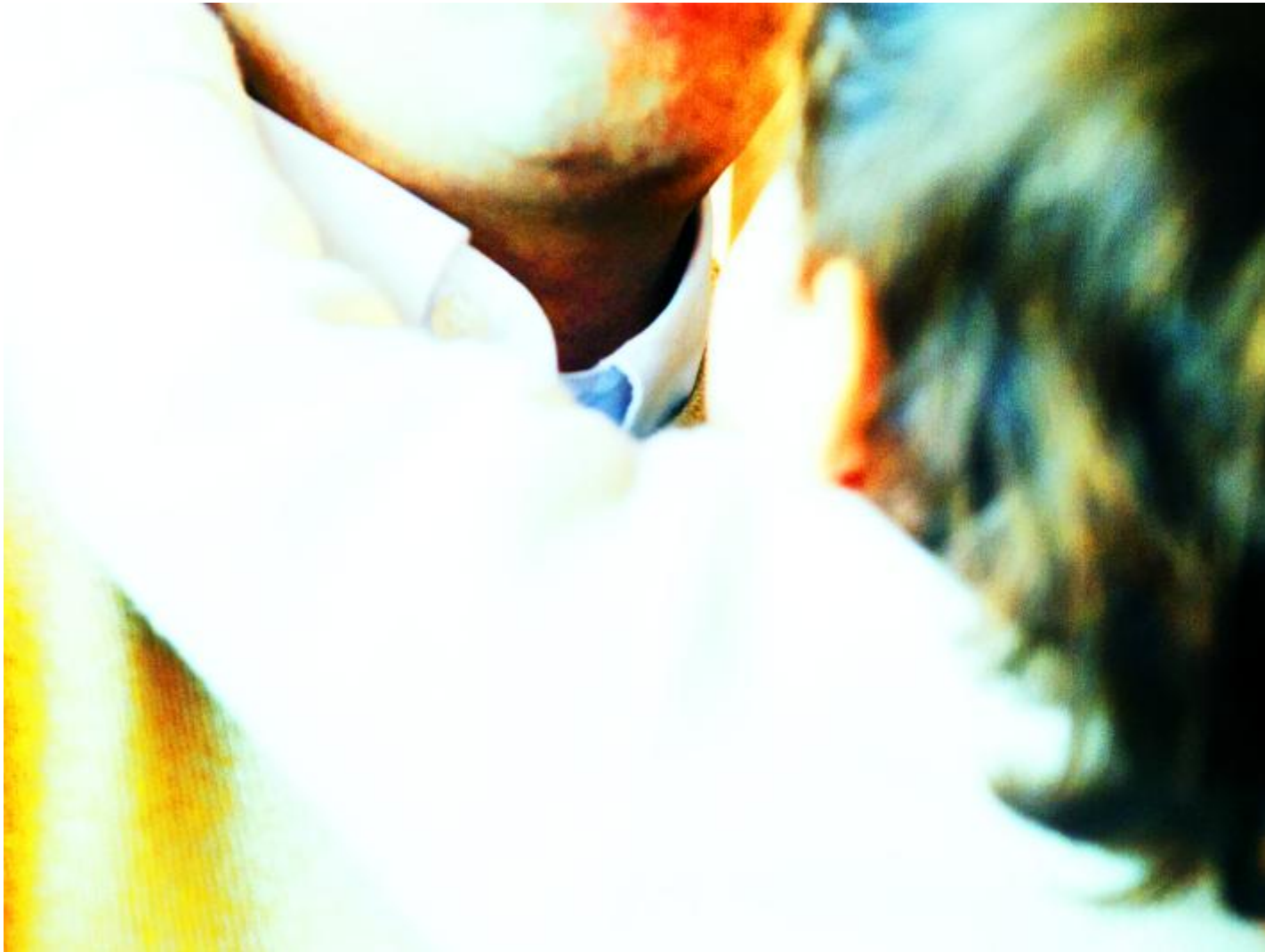
Marina Ballo Charmet Tatay #02, 2022-23, ink jet print su Dibond.

Luce e oggetto-luogo percettivo dunque, elementi fondamentali della poetica dell'artista. Obiettivo: rendere presente ciò che c'è, proprio così com'è. E in Tatay la tangenza è punto di singolarità necessaria al legame, perché determina il canale di ogni possibile scambio tra il padre e il figlio (la zona fenogliana tra i due nervi che abbiamo dietro il collo). Al contempo, il contatto-confine è espressione della funzione paterna di rivelare al figlio l'esperienza dell'impossibile, cioè l'idea del limite. La ritroviamo per esempio nelle braccia adulte che contengono o nel corpo adulto che delimita un orizzonte.