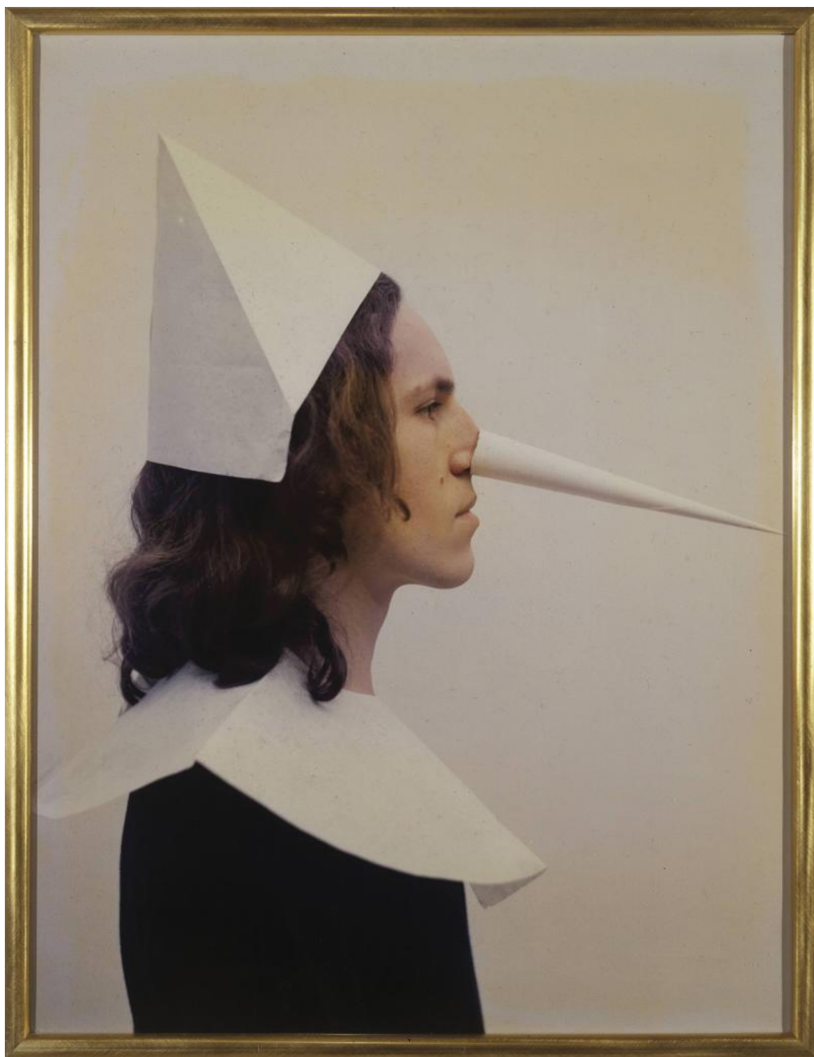
Luigi Ontani, Pinocchio , 1972, Stampa a colori opaca, 85 x 67 cm, Fabio Sargentini - Archivio L'Attico © Luigi Ontani.

Non a caso, in una mostra a Torino degli anni Settanta, io stessa l'avevo conosciuto in perfetta versione Gianduia, maschera della città piemontese. Ma egli crea anche grandi fotografie come simulacri della pittura «nella simpatia dell'Arte-Vita o VitaArte, con Citazioni (...) libertariamente a memoria ambigua, come per il Bacchino , che ricorda tutti i precedenti e nessuno, oppure Dante , Pinocchio , Leonardo ...come viaggio d'identità» (sempre in: Adriano Altamira, La