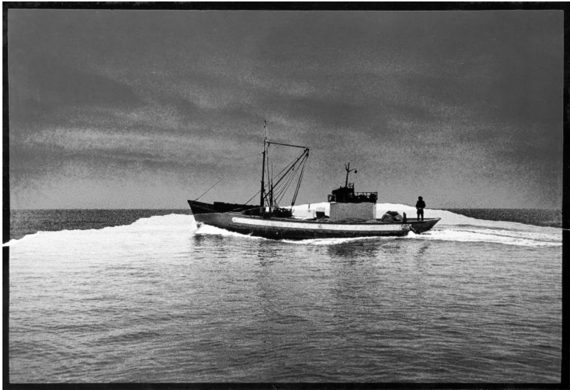
Mimmo Jodice, Il viaggio di Ulisse , 1969, Stampa alla gelatina bromuro d'argento su carta baritata, 40,5 x 28,5 cm