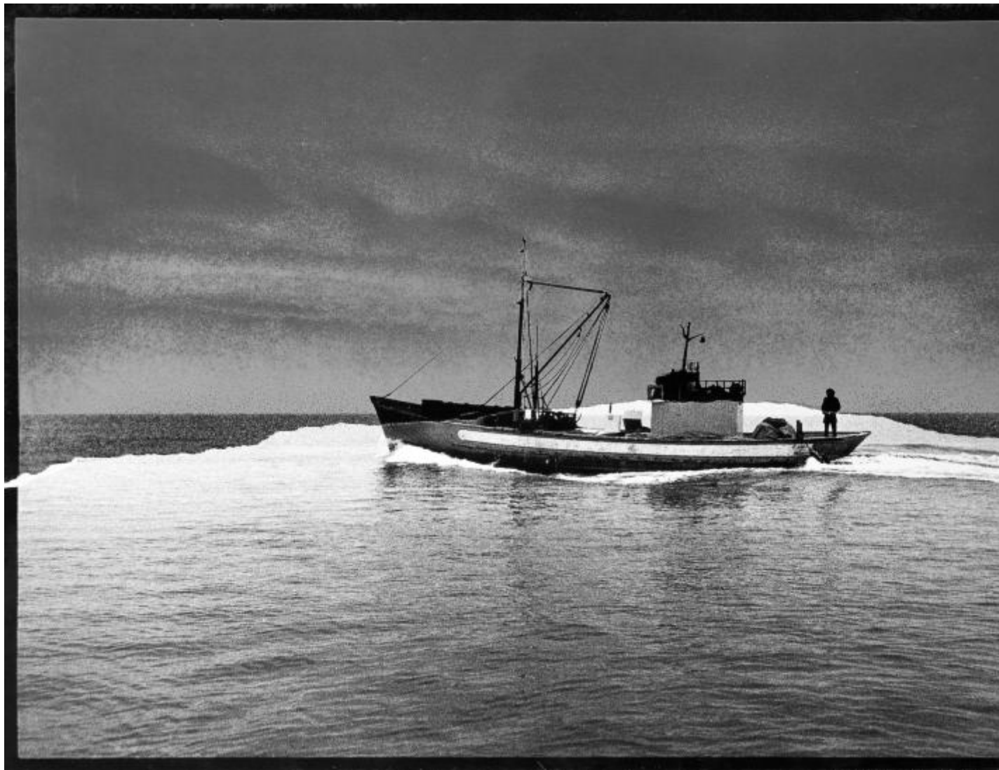
Mimmo Jodice, Il viaggio di Ulisse , 1969, Stampa alla gelatina bromuro d'argento su carta baritata, 40,5 x 28,5 cm