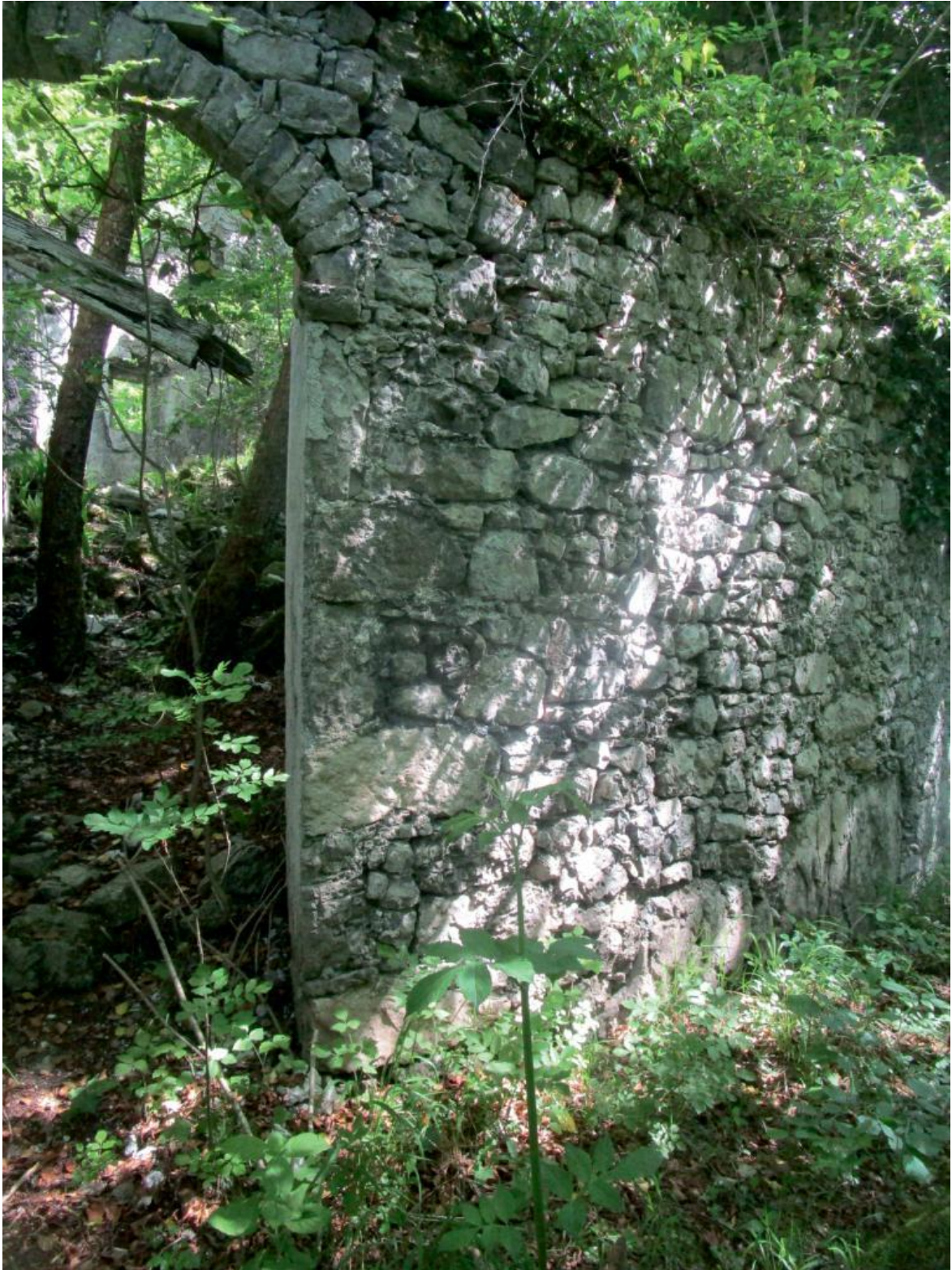
Italo Zannier, Palcoda, Editrice Quinlan 2022.

Ecco, partendo dalla parola documentare, ora direi più che la fotografia segnala , non documenta. La fotografia è una realtà nuova, non è la realtà. È la realtà dell'immagine. La realtà esiste nel vivere, nella sua temperatura, nella percorrenza, nell'odore, nel profumo e nel sapore. La fotografia è la realtà che viviamo, ed è necessario conoscere il suo linguaggio, tutte le sue ambiguità.