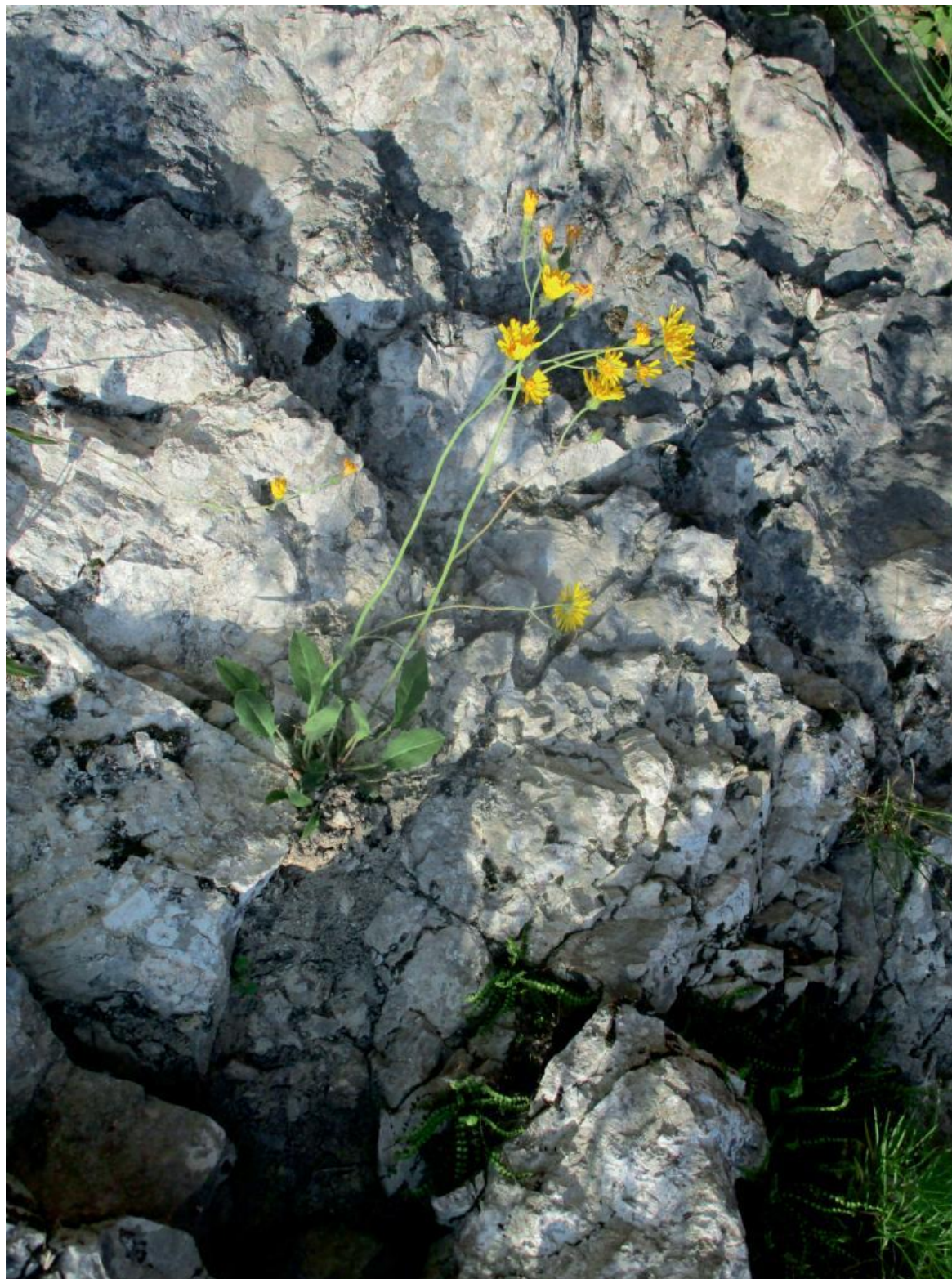
Italo Zannier, Palcoda, Editrice Quinlan 2022.

della Sua infanzia, quasi volendo vedere in quei luoghi le tracce di una e insieme molte esistenze passate. In poche parole, le Sue montagne sembrano il simbolo della fotografia stessa, anch'essa testimone e creatrice di una memoria privata e insieme collettiva. Come vede il legame tra montagna e fotografia?