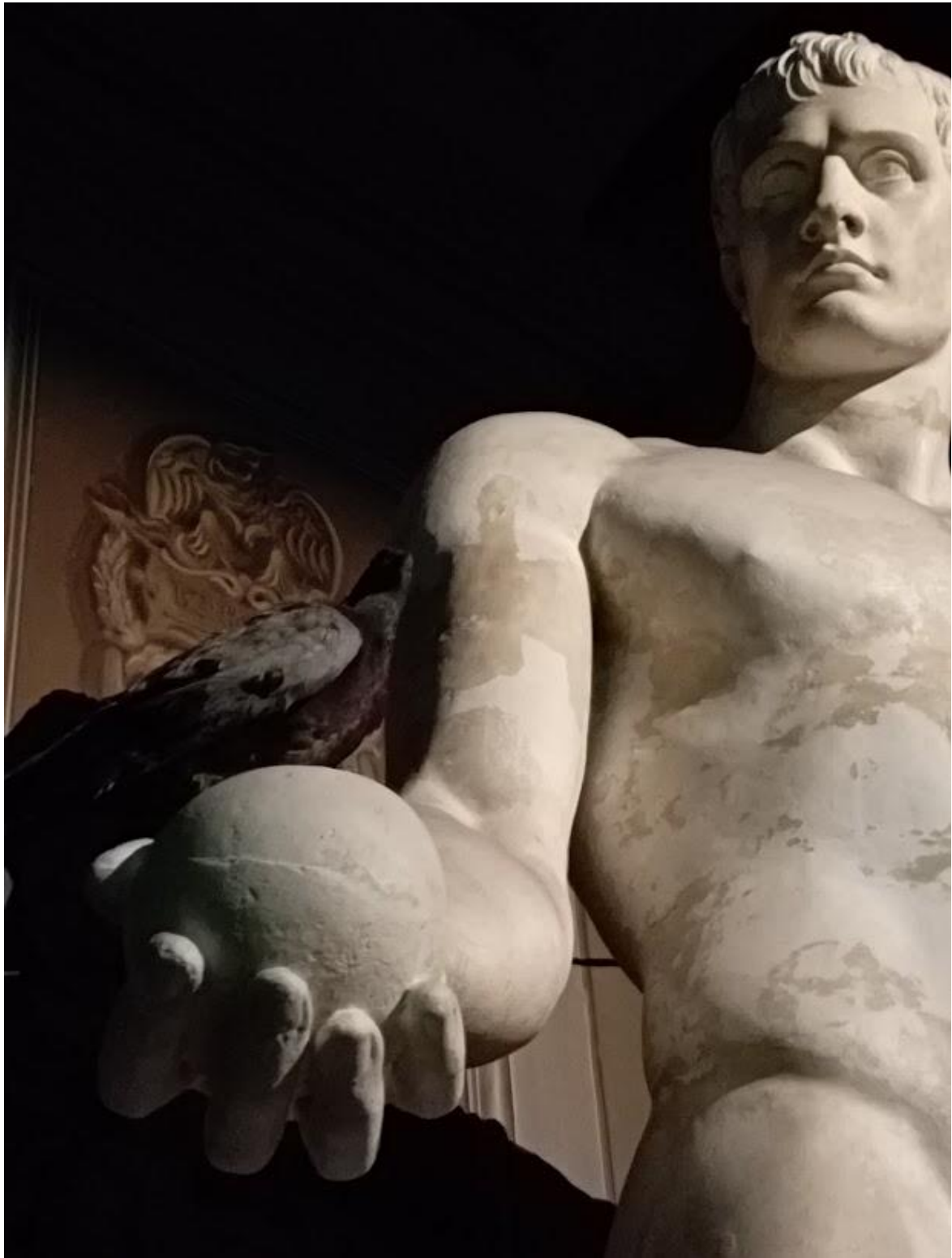
Riproduzione in gesso del Marte Pacificatore di Antonio Canova + Ghosts di Maurizio Cattelan.

Così come per la fotografia alle sue origini, quando bisognava posare per ore affinché rimanesse impressa una traccia di vita, anche per la scultura iperrealista i tempi di posa non sono brevi: Duane Hanson per le sue opere ( Cowboy with Hay , 1984-90; Two Workers , 1993 quelle presenti in mostra) ammette di impiegare due o tre giorni di pose. Interessante notare che le sue prime opere, criticate come "non opere d'arte", rappresentavano spesso persone morte: ne è un