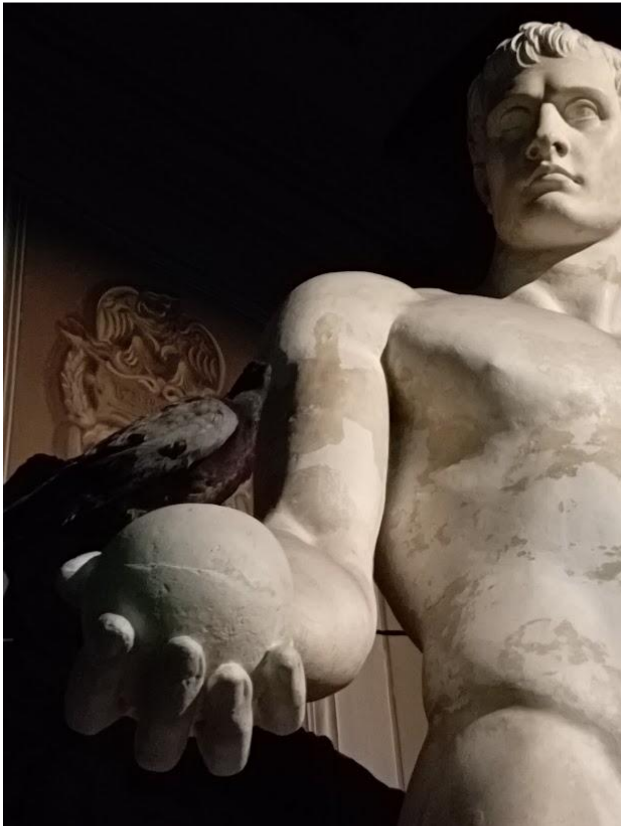
Riproduzione in gesso del Marte Pacificatore di Antonio Canova + Ghosts di Maurizio Cattelan.

Così come per la fotografia alle sue origini, quando bisognava posare per ore affinché rimanesse impressa una traccia di vita, anche per la scultura iperrealista i tempi di posa non sono brevi: Duane Hanson per le sue opere ( Cowboy with Hay , 1984-90; Two Workers , 1993 quelle presenti in mostra) ammette di impiegare due o tre giorni di pose. Interessante notare che le sue prime opere, criticate come "non opere d'arte", rappresentavano spesso persone morte: ne è un esempio Abortion (1965) che si ispirava alla tecnica in gesso di George Segal. Anche Degas nel 1881 ricevette molte critiche per la sua piccola danzatrice di quattordici anni : "non in un'esposizione d'arte" lo invitarono ad esporla "ma in un museo di zoologia, d'antropologia o di