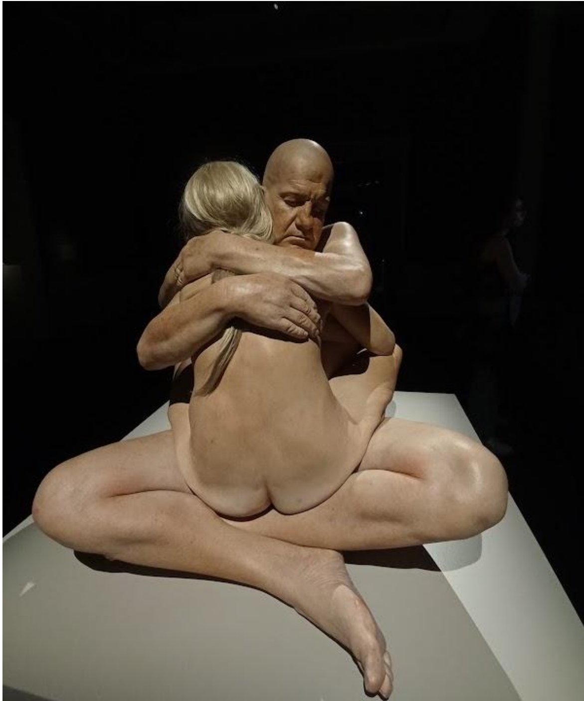
Marc Sijan, Embrace , 2014.

esprimono". Non si tratta semplicemente di specchiarsi, ma di attivare i neuroni specchio ed emozionarsi, come se ci si trovasse davanti a una persona.