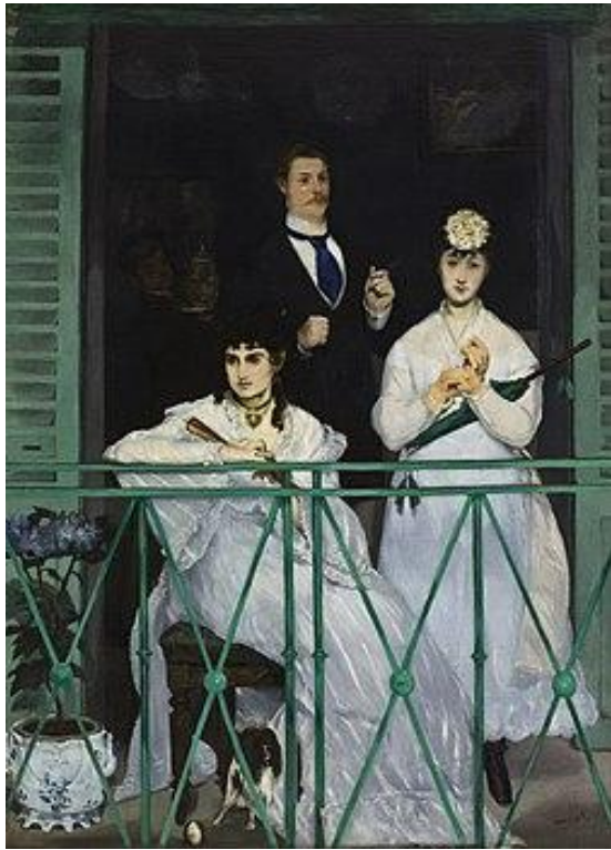
Edouard Manet - Le Balcon , 1868, Musée D'Orsay, Paris.

Paul Valéry, affascinato dal “Nero assoluto” di Berthe Morisot au bouquet de violettes , riconosce come quel “viso dai grandi occhi, la cui vaga fissità è profondamente distratta” offra “una presenza di assenza”. Roberto Calasso, tra i pochi a soffermarsi sulla presunta storia d’amore, commenta, a proposito del primo incontro tra i due al Louvre, che Morisot “probabilmente lo amò subito”. Eppure, tra l’accettazione di una mancanza sublime quanto incolmabile e la convinzione che ci sia spazio per una congettura, dovrà esserci una terza via.