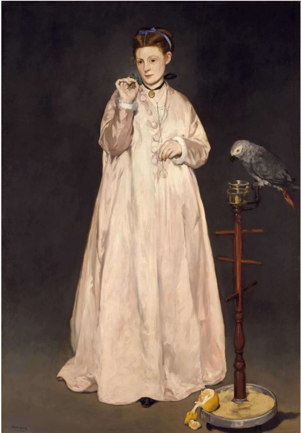
Edouard Manet - Une jeune dame en 1866, dite aussi La Femme au perroquet, 1866, Musée D'Orsay, Paris.

Anche se la si circoscrive all'Occidente, la storia del ritratto presenta una immensità di casi, spesso contraddittori tra loro riguardo alle finalità e agli effetti di un'immagine. Nel Trecento, "vitalità" è un termine encomiastico per la