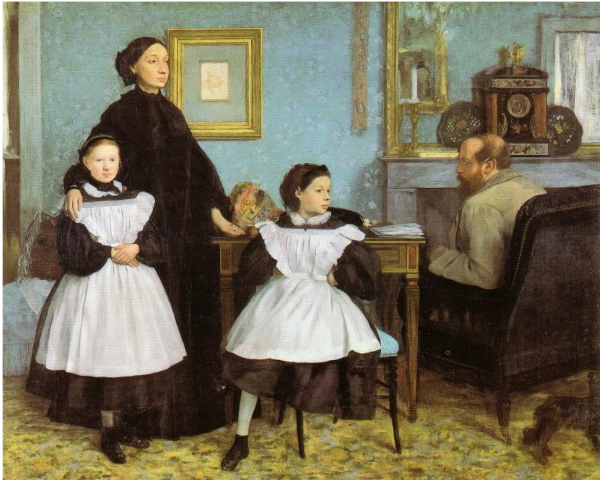
Edgar Degas - La famille Bellelli , c. 1858-1867, Musée D'Orsay, Paris.

Oltre che nella sezione “Au-delà du portrait”, il ritratto ricorre lungo l’intera mostra. I raffronti includono quello tra le figure di Stéphane Mallarmé (Manet, 1876) e Diego Martelli (Degas, 1879), o tra la pallida Femme au perroquet e l’arcana Jeune femme et ibis . In particolare, su due pareti limitrofe sono esposti La famille Bellelli di Degas e Le Balcon di Manet. Entrambi rappresentano un gruppo di persone. Il primo è un quadro di famiglia: l’autore sonda i caratteri, elabora le fisionomie e lascia intravedere parte del sostrato esistenziale dei protagonisti. L’immagine è eloquente, e invoglia a divinare la biografia e le personalità di chi si ha di fronte. Il secondo, invece, propone una composizione reminiscente delle Majas al balcone di Goya, solo che adesso le figure appaiono astratte e resistenti all’esegesi. In breve, Degas ritrae estrapolando e lasciando affiorare quel che non è visibile; Manet sembra interessato affinché l’invisibile rimanga tale eppure se ne intuisca l’esistenza.