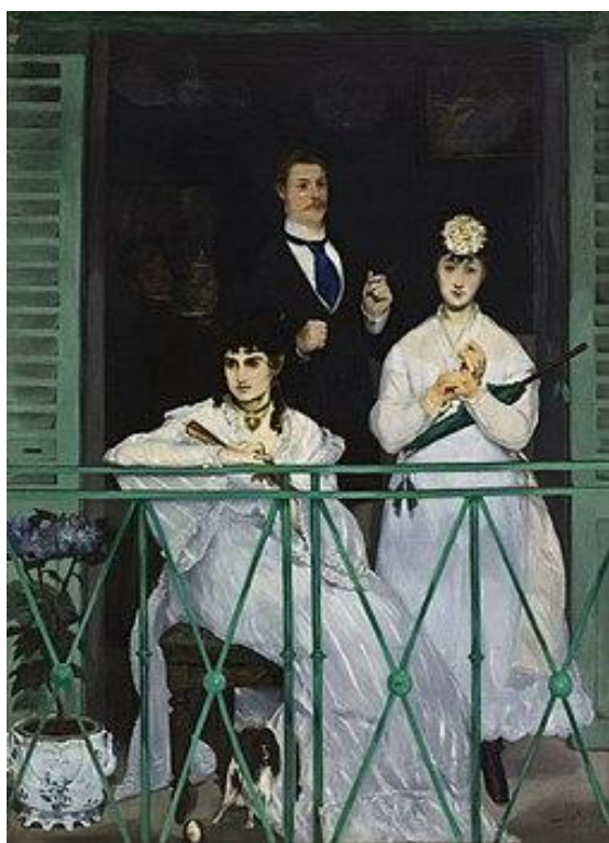
Edouard Manet - Le Balcon , 1868, Musée D'Orsay, Paris.

In Degas/Manet , l'opera che merita di venire candidata quale araldo del nuovo inizio del ritratto è Berthe Morisot au bouquet de violettes . Parte della collezione d'Orsay, nella mostra è accostata ad altri ritratti in una sezione dedicata al "cercle Morisot". Berthe e la sorella Edma, entrambe debuttanti al Salon nel 1864, frequentano Henri Fantin-Latour e poi Manet e Degas. La prima persegue una carriera professionale di pittrice nella cerchia degli impressionisti; accetta l'invito di Édouard di posare nel suo studio – dove ha modo di apprendere e coltivare la propria vocazione – e nel 1874 sposa Eugène Manet. Tuttavia, se ci si attiene all'evidenza visiva del dipinto, si desume ben poco sulla protagonista o il contesto esterno. Ciononostante, la carismatica immagine chiama in causa le tre questioni archetipiche del ritratto: amore, morte e verità. Accogliendo e ricambiando lo sguardo della donna, ci si chiede che tipo di legame ci fosse tra pittore e modella: rispetto, charme, affettuosità, amore? Se si esce dal quadro e si legge la corrispondenza di Berthe, il nome di Manet spunta svariate volte, sicuramente un vincolo profondo li unisce ma sarebbe velleitario trarre delle conclusioni. È come se fosse venuta meno ogni chance di appurare che cosa sia con la morte di entrambi. Davvero, però, il ritratto è così reticente che l'aneddoto di Butade perde ogni credibilità?