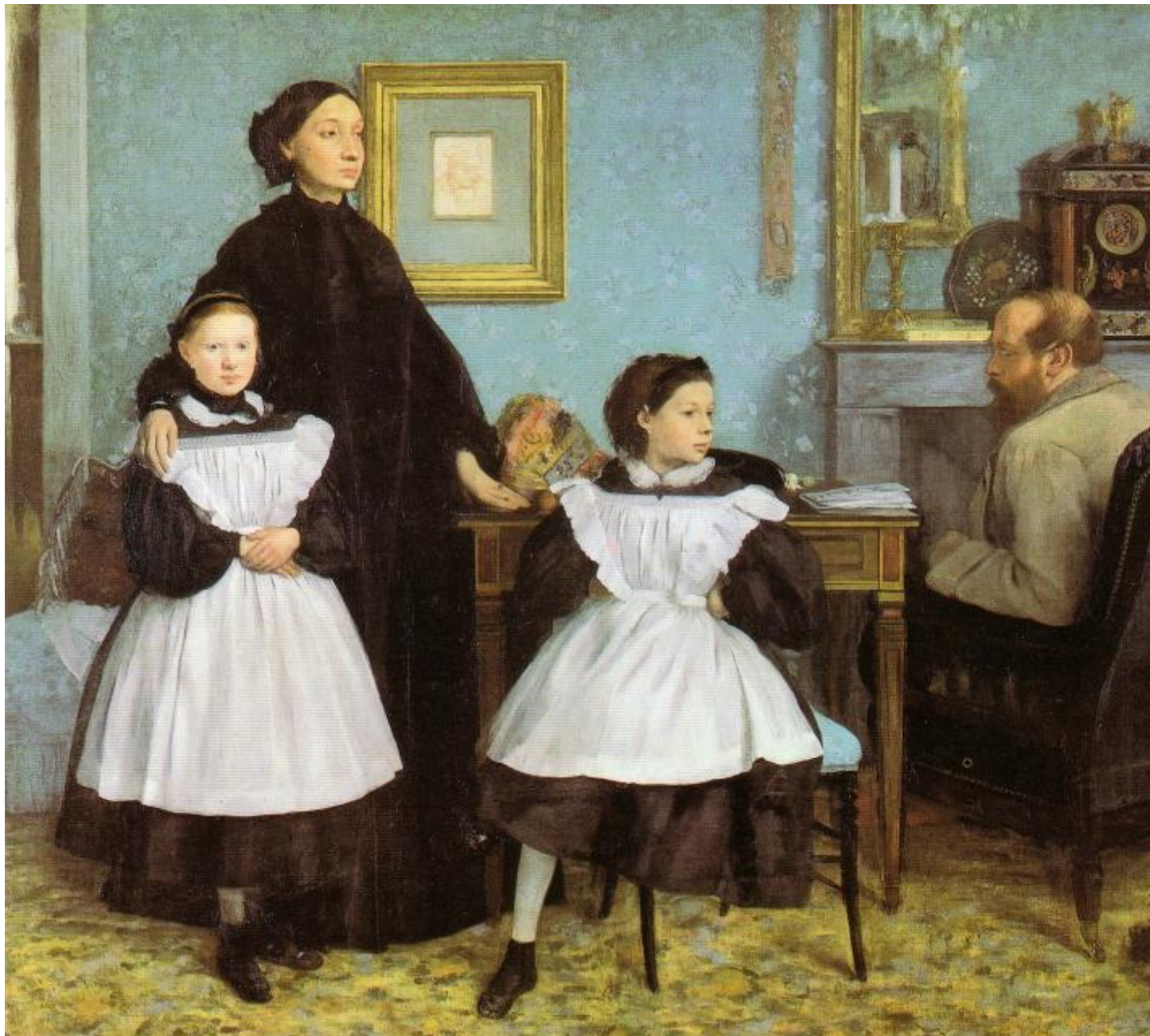
Edgar Degas - La famille Bellelli , c. 1858–1867, Musée d'Orsay, Paris.