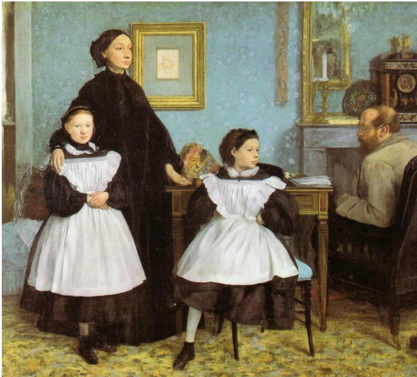
Edgar Degas - La famille Bellelli , c. 1858–1867, Musée D'Orsay, Paris.

Oltre che nella sezione “Au-delà du portrait”, il ritratto ricorre lungo l’intera mostra. I raffronti includono quello tra le figure di Stéphane Mallarmé (Manet, 1876) e Diego Martelli (Degas, 1879), o tra la pallida Femme au perroquet e l’arcana Jeune femme et ibis . In particolare, su due pareti limitrofe sono esposti La famille Bellelli di Degas e Le Balcon di Manet. Entrambi rappresentano un gruppo di persone. Il primo è un quadro di famiglia: l’autore sonda i caratteri, elabora le fisionomie e lascia intravedere parte del sostrato esistenziale dei protagonisti. L’immagine è eloquente, e invoglia a divinare la biografia e le personalità di chi si ha di fronte. Il secondo, invece, propone una composizione reminiscente delle Majas al balcone di Goya, solo che adesso le figure appaiono astratte e resistenti all’esegesi. In breve, Degas ritrae estrapolando e lasciando affiorare quel che non è visibile; Manet sembra interessato affinché l’invisibile rimanga tale eppure se ne intuisca l’esistenza.