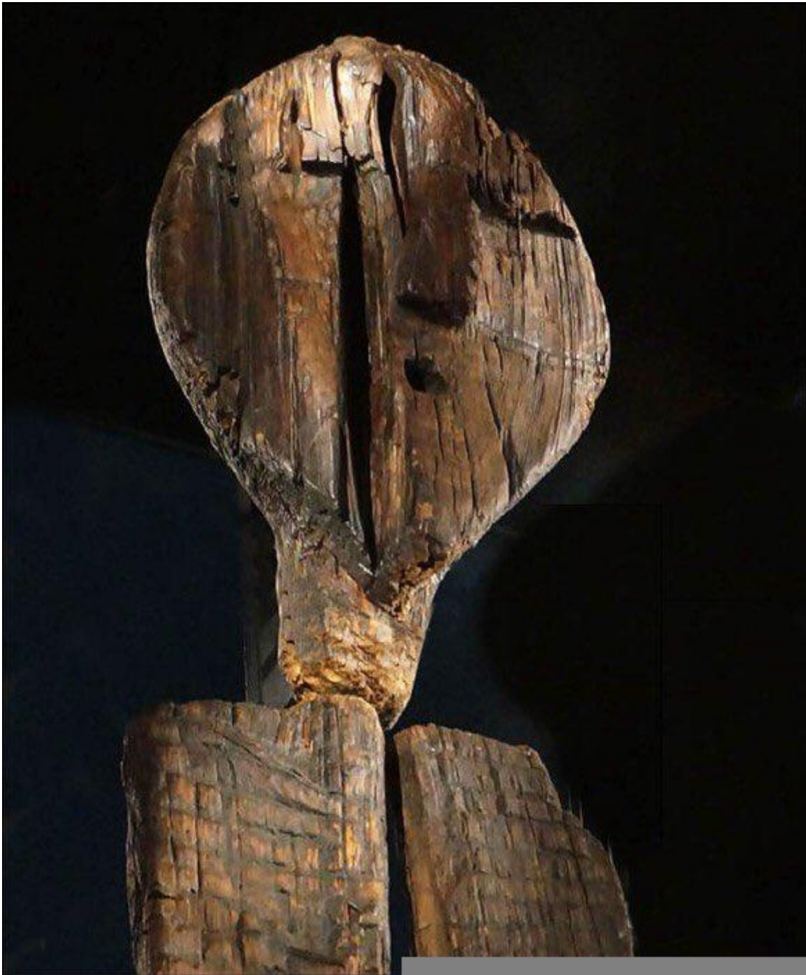
Idolo di Sigiir (dettaglio), Collezione Preistorica del Museo di Storia Regionale dell'Oblast' di Sverdlovsk, Ekaterinburg, Russia.

Infatti, anche inconsapevolmente, il ritratto di per sé rivela un desiderio di affrancarsi dalla finitudine. Istituisce un confronto con le questioni senza fine della nostra specie evocando o implicando i grandi temi dell'amore, della morte e della verità. Invoglia a chiedersi chi sia l'altro che ci guarda e chi siamo noi che guardiamo, e nell'attestare un'alterità, che è tanto materiale e formale quanto impalpabilmente umana, spinge a pensare quel che resta esterno al pensiero. Seppur assumendo delle posizioni diverse, l'artista che lo crea e il non artista che lo contempla sono esposti ai quanta di ignoto inerente all'unicum di colui o colei che è innanzi a loro, vuoi in carne ed ossa vuoi già trasfigurato dall'atto creativo.