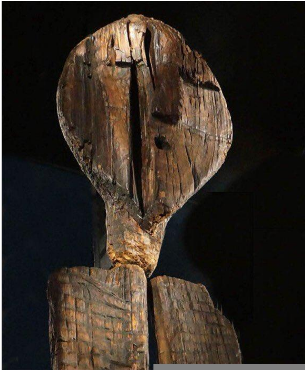
Idolo di Sigris (dettaglio), Collezione Preistorica del Museo di Storia Regionale dell'Oblast' di Sverdlovsk, Ekaterinburg, Russia.

Infatti, anche inconsapevolmente, il ritratto di per sé rivela un desiderio di affrancarsi dalla finitudine. Istituisce un confronto con le questioni senza fine della nostra specie evocando o implicando i grandi temi dell'amore, della morte e della verità. Invoglia a chiedersi chi sia l'altro che ci guarda e chi siamo noi che guardiamo, e nell'attestare un'alterità, che è tanto materiale e formale quanto impalpabilmente umana, spinge a pensare quel che resta esterno al pensiero. Seppur assumendo delle posizioni diverse, l'artista che lo crea e il non artista che lo contempla sono esposti ai quanta di ignoto inerente all'unicum di colui o colei che è innanzi a loro, vuoi in carne ed ossa vuoi già trasfigurato dall'atto creativo. Entrambi intuiscono l'impensabile e si ingegnano affinché il pensiero lo contenga: l'artista lo fa generando una forma significativa, il non artista entrando nella sua orbita.