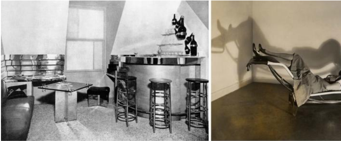
Charlotte Perriand, il Bar sous le toit , 1927; lei stessa ritratta seduta sulla Chaise longue basculante , 1929.

Questo dedicato a Perriand è corredato dai lavori di Emanuela (Emi) Ligabue, così in contrappunto, nella loro giocosa intemperanza postmoderna, con la sobria misura dei progetti di Perriand, eppure con essi così in sintonia, accomunati, come sono, dal ritmo delle geometrie, modulate sul cromatismo delle superfici.