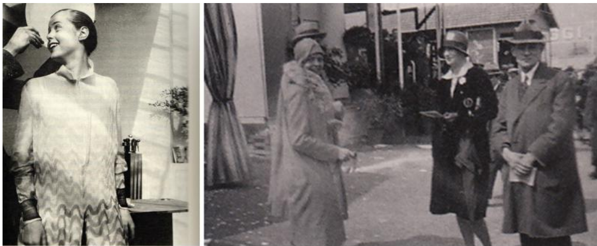
A sinistra: Charlotte Perriand in una foto del 1928, probabilmente scattata da Pierre Jeanneret, nell’abitazione di Charlotte in Place Saint Sulpice. Forse la persona a sinistra, a cui Charlotte sorride, della quale si vede solo la mano che regge il piatto dietro la sua testa, è Le Corbusier. A destra: al padiglione della Nestlé, progettato dai fratelli Jeanneret per la Fiera di Parigi del 1928, in primo piano, in leggero scorcio, Charlotte Perriand e, dietro di lei, probabilmente Pierre Jeanneret; a destra, Ingrid Wallberg e, alla sua sinistra, forse Arvid Bjerke (architetto svedese che tra il 1928 e il 1935 aveva il proprio studio a Parigi).

Un’altra esperienza che condivisero fu l’entusiasmo per la nascita del CIAM (Congrès Internationaux d’Architecture Moderne), al quale Charlotte partecipò, mentre Ingrid dovette rinunciare all’ultimo momento, a causa dell’ostruzionismo dei suoi colleghi svedesi (tutti maschi) che non concessero il loro appoggio alla sua candidatura. Di lì a poco la Wallberg lasciò Parigi e fece ritorno in patria, dove ebbe una splendida carriera di architetto progettista, mentre Charlotte, prima di aprirne uno tutto suo, fino al 1937, continuò a lavorare nello studio del maestro e di suo cugino, occupandosi con loro soprattutto della progettazione degli interni e di quella degli arredi, questi ultimi divenuti dei veri e propri must, tutt’oggi in produzione.