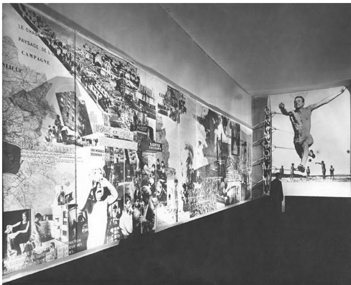
Charlotte Perriand, fotomontaggio di circa 60 metri quadrati e lungo m. 15, realizzato nel 1936 per il Salon des Arts Ménagers Per una «nuova maniera di abitare la vita». Le foto sono sue e dell'Agenzia Wild World. Quest'opera fece scandalo e fu distrutta alla fine del salone. © Archives Charlotte Perriand. Gli Archives Charlotte Perriand sono curati da sua figlia Pernelle Perriand e dal di lei marito Jacques Barsac.

Charlotte, inoltre, come ci ricordano Bassanini e Canzi, “da vera ambientalista ante litteram , come l’amica artista Dora Maar, utilizza la fotografia per raccontare le trasformazioni del novecento e una certa idea di modernità e progresso, oltre che per denunciare le miserabili condizioni di vita di una parte della popolazione, l’inquinamento e la speculazione sempre più imperanti. Frutto di questo linguaggio espressivo è, ad esempio, il fotomontaggio gigante Misère de Paris , che presenta nel 1936 alla Exposition de l’habitation , organizzata dalla rivista l’Architecture d’aujourd’hui , all’interno del Salon des Arts Menagers del Grand Palais o quello realizzato in collaborazione con Fernand Léger [suo fraterno amico] nel 1937 per illustrare il programma del Ministero dell'Agricoltura francese.”