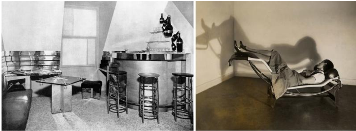
Charlotte Perriand, il Bar sous le toit , 1927; lei stessa ritratta seduta sulla Chaise longue basculante , 1929.

C'è una foto piuttosto nota che ritrae Charlotte seduta sulla Chaise longue basculante (oggi prodotta da Cassina con la sigla LC4) da lei progettata nel 1929 con LC e Jeanneret, che può essere presa a dimostrazione di come “una strana poltrona allungata può accogliere un corpo in un modo del tutto nuovo” scrivono Bassanini e Canzi, “ma non per questo meno confortevole. Il richiamo è al pioupiou , il soldato che per riposarsi si sdraia a terra, solleva i piedi e li appoggia un albero, mettendosi lo zaino dietro la testa: è questa l'idea di fondo, l'immagine da cui Charlotte ha tratto ispirazione, come afferma lei stessa.”