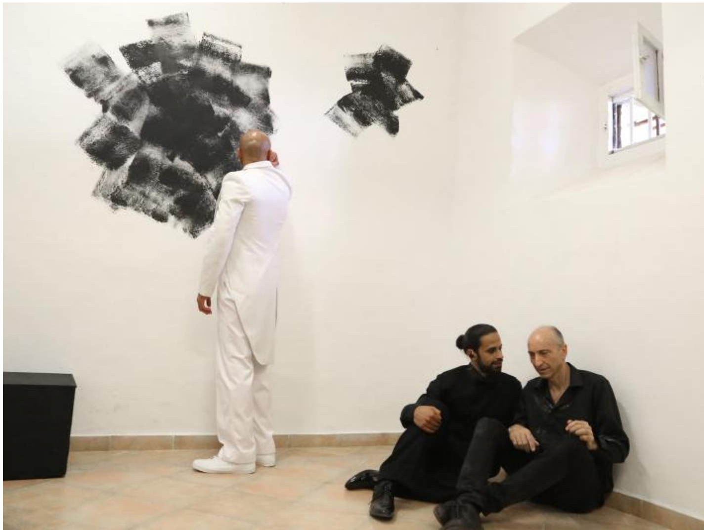
Atlantis cap. 1 la permanenza 3- Compagnia della Fortezza

Ecco, la nuova opera di Punzo e della Compagnia della Fortezza – che a ragione aspirano al riconoscimento della stabilità teatrale – si misura con questa materia: filosofica, poetica e scientifica insieme. E lo fa nello spazio concluso del ‘campino’ del carcere e in alcuni suoi angusti spazi interni, mettendo al lavoro proprio il limite costituito da una realtà fatta di un dentro e di un fuori, di un alto e di un basso, di un lontano e di un vicino, di un prima e di un dopo, di un ipotetico noi/loro che le sinuosità del tempo storico confermano e smentiscono.