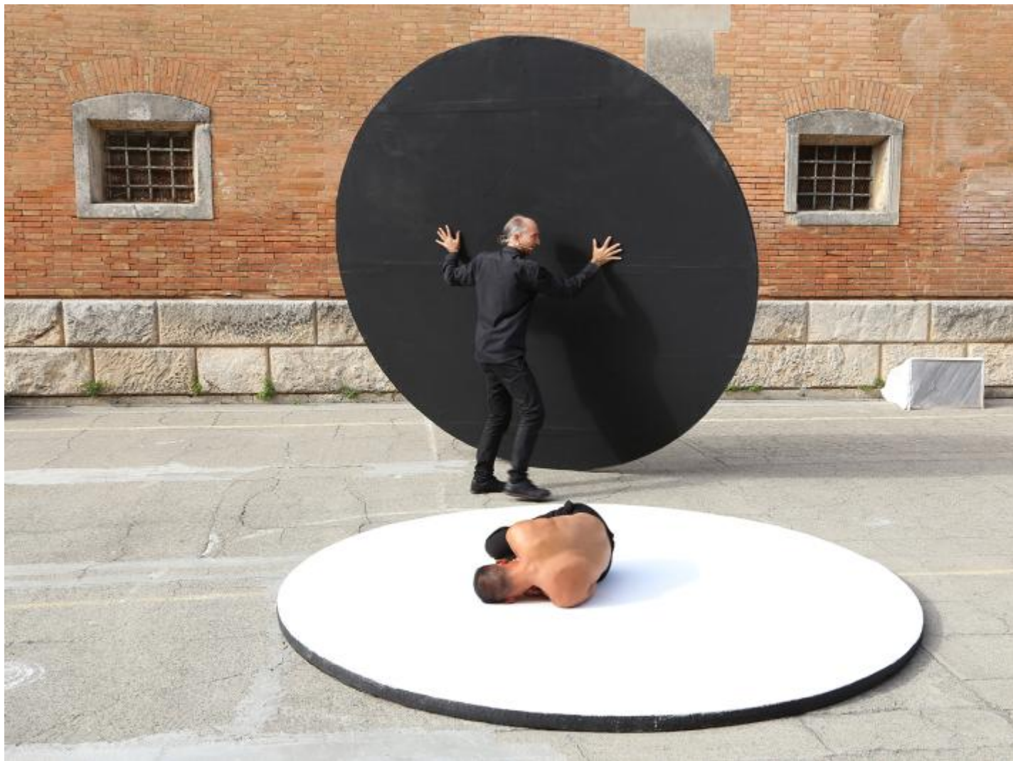
Atlantis cap. 1 la permanenza 6- Compagnia della Fortezza.

I venti, i venti non soffiano mai in linea retta.