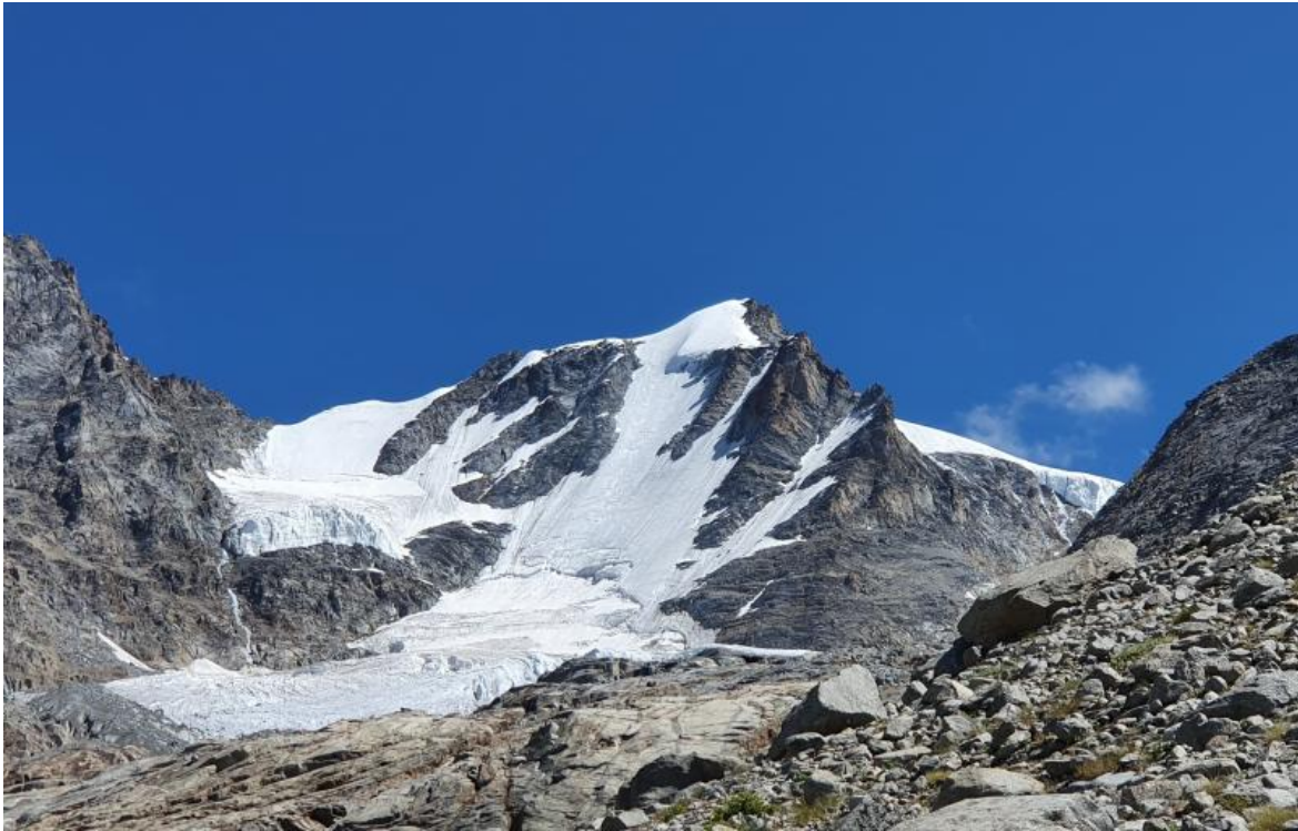
La parete Nord-Ovest del Gran Paradiso, foto di Giuseppe Mendicino.

lontana, il sapore di quella carne, che è il sapore di essere forti e liberi, liberi anche di sbagliare, e padroni del proprio destino».