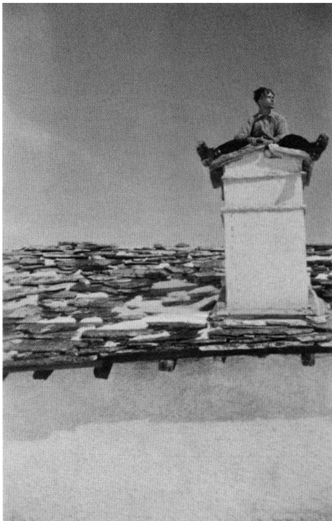
Rif. Vittorio Sella - Aprile 1946