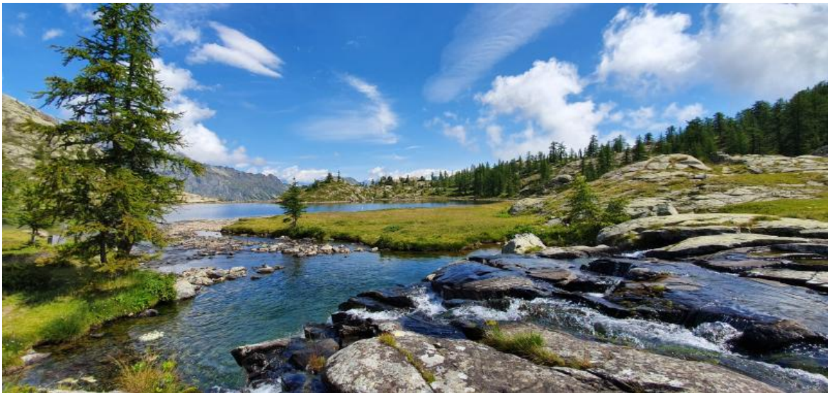
Il lago Bianco, caro a Primo Levi e a Mario Rigoni Stern