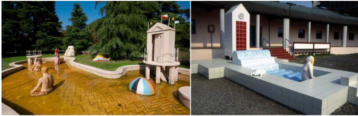
Giorgio De Chirico, Milano, 1973, Bagni Misteriosi, fontana. Ugo La Pietra, Cattolica, 1988, Monumento alla balnearità, fontana.

C'è un film del 1977, diretto da Sergio Citti, ambientato in una grande cabina da spiaggia, una cabina collettiva. Si intitola Casotto ed è un capolavoro interpretato da un cast stellare. Con questo suo film, Citti sembra aver voluto esaudire una curiosità che più o meno tutti abbiamo o abbiamo avuto, quando, da annoiati bagnanti, senza nulla da fare in spiaggia, ci siamo posti interrogativi esistenziali, del tipo: "cosa fanno le persone quando entrano in cabina?" Ed ecco allora, il regista romano, nella scia della commedia all'italiana, raccontarci tante storie che, con il suo tocco pasoliniano e il suo sguardo dissacrante, mettono a nudo (anche in senso letterale) vizi e paranoie di una umanità ingenua e al contempo furbastra, avida, sofferente e meschina che si nutre di cibo in abbondanza e di luoghi comuni.