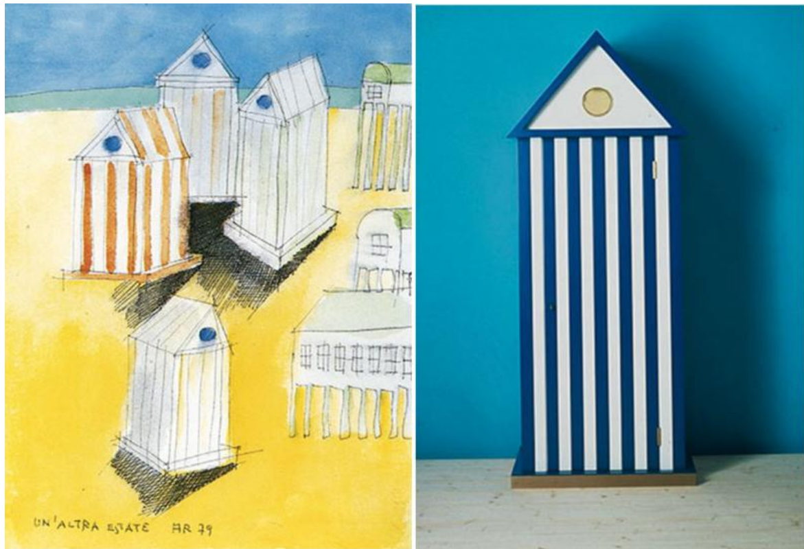
Aldo Rossi, la Cabina dell'Elba , 1980. Disegni e una sua realizzazione tridimensionale.

Anche Ugo La Pietra, nel 1985, si è cimentato nel progetto di una cabina articolata, come e ancor più di quella di Cosenza. L'ha chiamata Cabina galleggiante , perché fungeva al contempo da cabina e da natante, e aveva un tetto a terrazza dove prendere il sole e dal quale ci si poteva anche tuffare, una volta preso il largo. Questo progetto era nato all'interno di una serie di mostre e di seminari sul tema della Cultura balneare , per cui La Pietra aveva anche fondato a Cattolica l' Osservatorio di Cultura Balneare , in anticipo come sempre sui tempi, "per studiare e approfondire questa particolare cultura marginale e proporre per la prima volta un design territoriale ", come si legge sul suo sito.