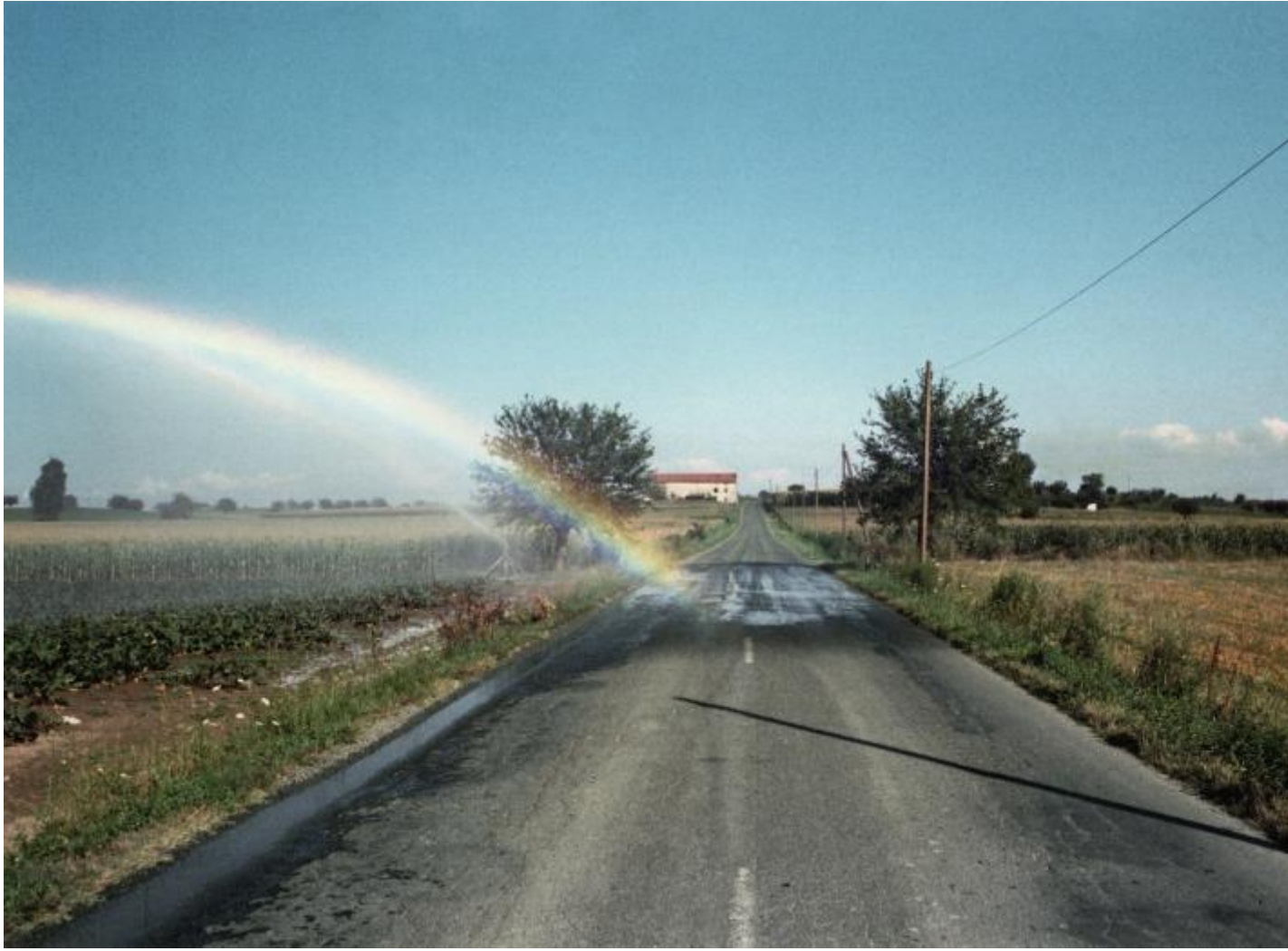
Vittore Fossati, "Oviglio, Alessandria", 1981 © Vittore Fossati - Museo di Fotografia Contemporanea, Milano-Cinisello Balsamo.

dimensione urbana (Vincenzo Castella); del senso di transitorietà connaturato al paesaggio (Paola de Pietri)