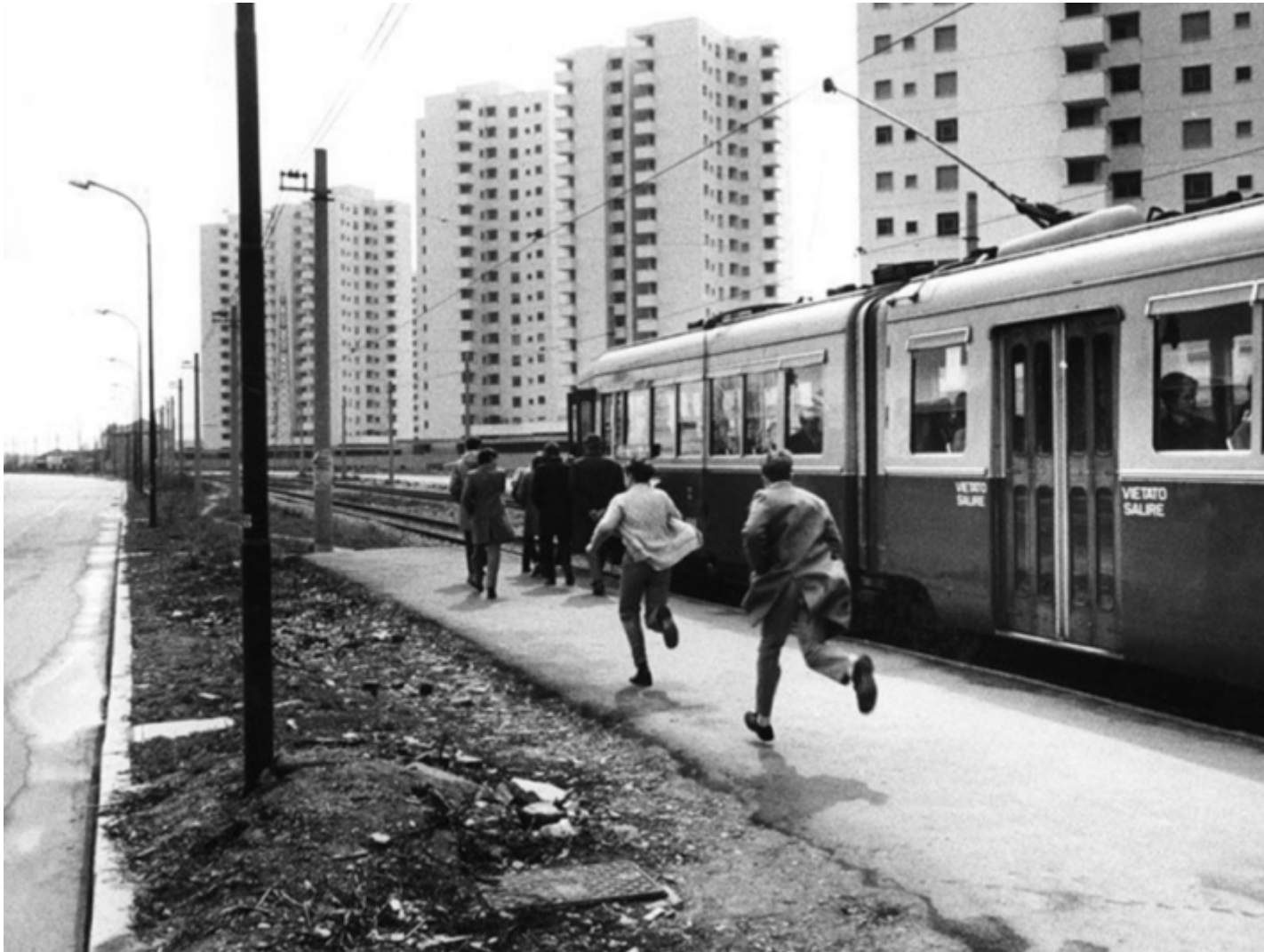
Uliano Lucas, Via dei Missaglia, Quartiere Gratosoglio, Milano 1971, © Uliano Lucas, Museo di Fotografia Contemporanea, Milano-Cinisello Balsamo.

Un'immagine di Lucas sintetizza questi caratteri. I palazzoni del Quartiere Gratosoglio in prospettiva vertiginosa riempiono l'inquadratura, tranne che per una porzione di cielo grigio sopra la strada. Geometrie ripetute, ogni quadratino corrisponde a una famiglia. Il tram alla fermata non attenderà un secondo più del necessario – dieci nove otto – un gruppo di persone si accalcano per salire – sette sei cinque – due ragazzi corrono per non perdere la corsa; come la strada e la fila di lampioni, stanno correndo verso il punto di fuga. Cortocircuito: quarantotto anni dopo questa fotografia, il cantante vincitore di Sanremo, Mahmood, figlio di un egiziano e di una sarda e cresciuto proprio al Gratosoglio, canterà “In periferia fa molto caldo/Mamma stai tranquilla sto arrivando”.