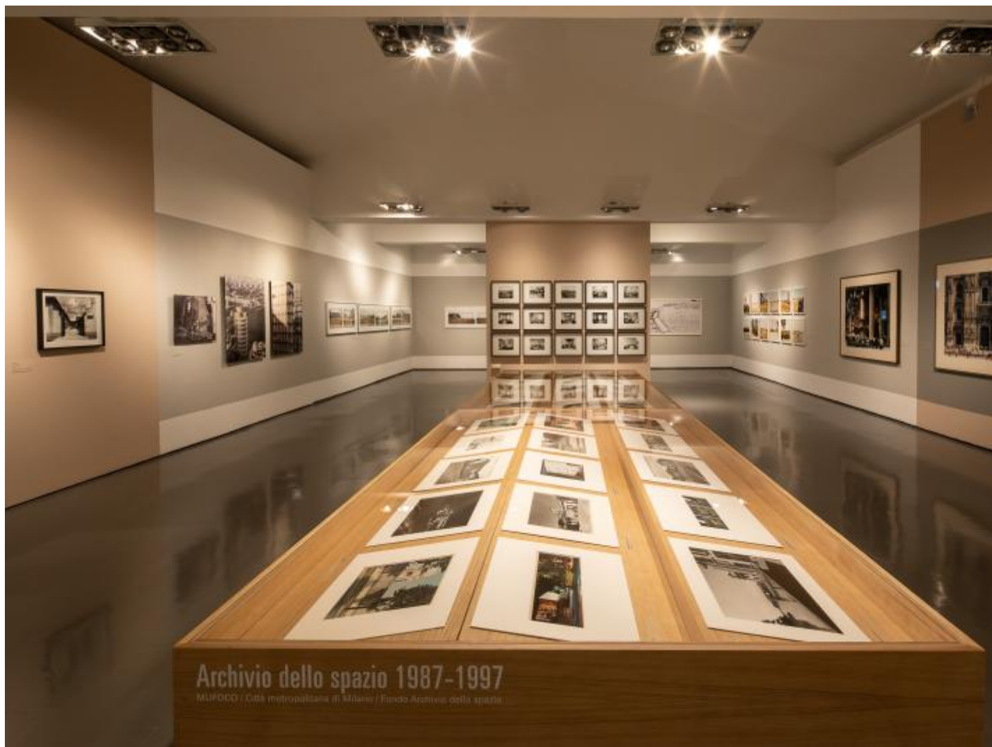
Vista dell’allestimento, foto © Alberto Novelli.

panorama italiano. Un peccato, appunto, perché la varietà di punti di vista presenti in mostra di per sé contrasterebbe una rappresentazione stereotipata del Bel Paese “ open to meraviglia ” che copre solo “lo 0,5% della superficie terrestre ma può vantare il maggior numero di siti inclusi nella lista dei patrimoni dell’umanità”, come recita l’omonima campagna promozionale.