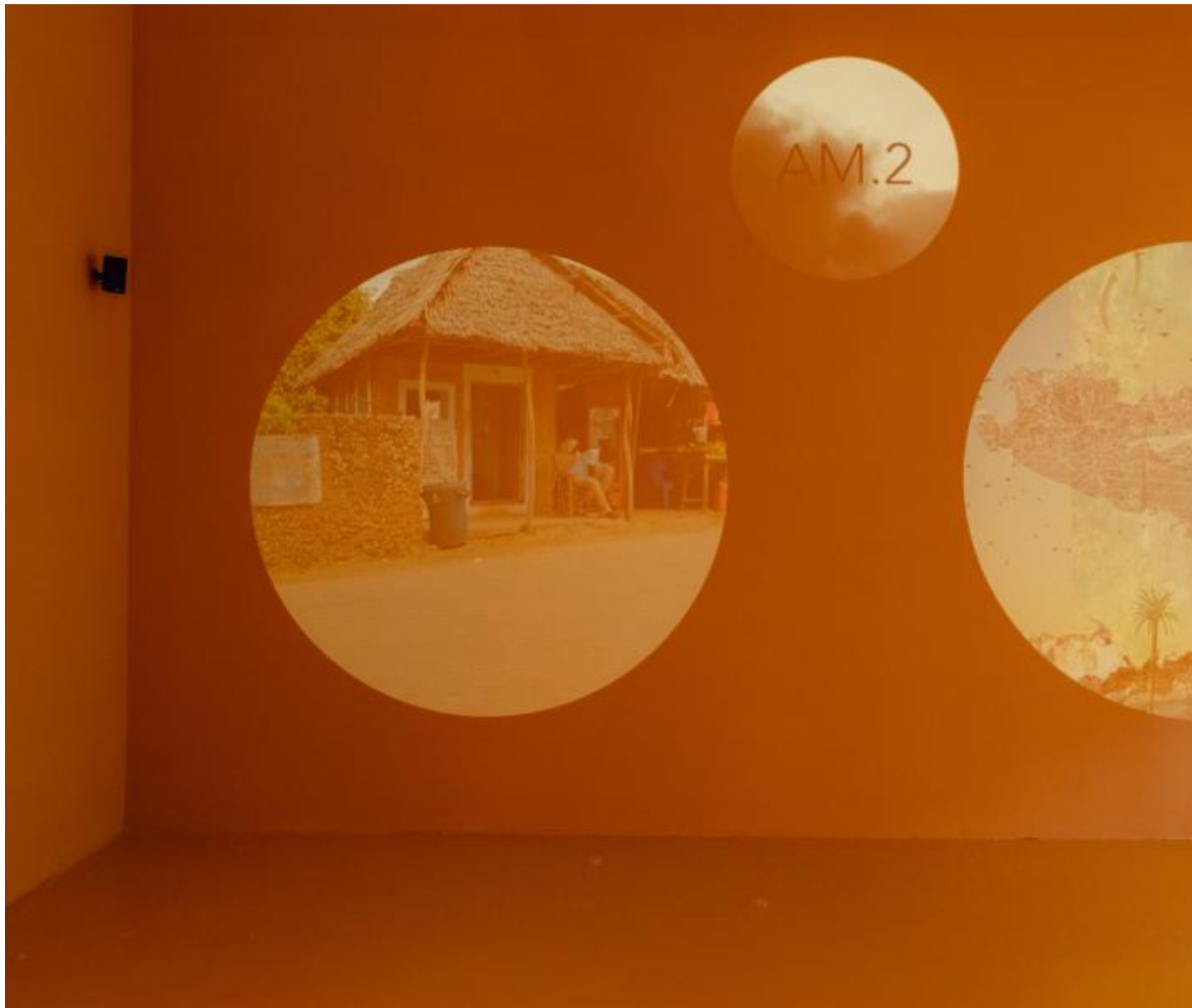
MDM Cave bureau. Mostra Internazionale di Architettura - La Biennale di Venezia, The laboratory of the Future _ Photo by Matteo de Mayda courtesy La Biennale di Venezia.

Così per esempio Cave_Bureau, con Oral Archive , presenta un archivio di film e audio legati a una serie di azioni collettive con le quali si trasmette la memoria immateriale della cultura africana. Le azioni si svolgono in luoghi naturali quali grotte e foreste.