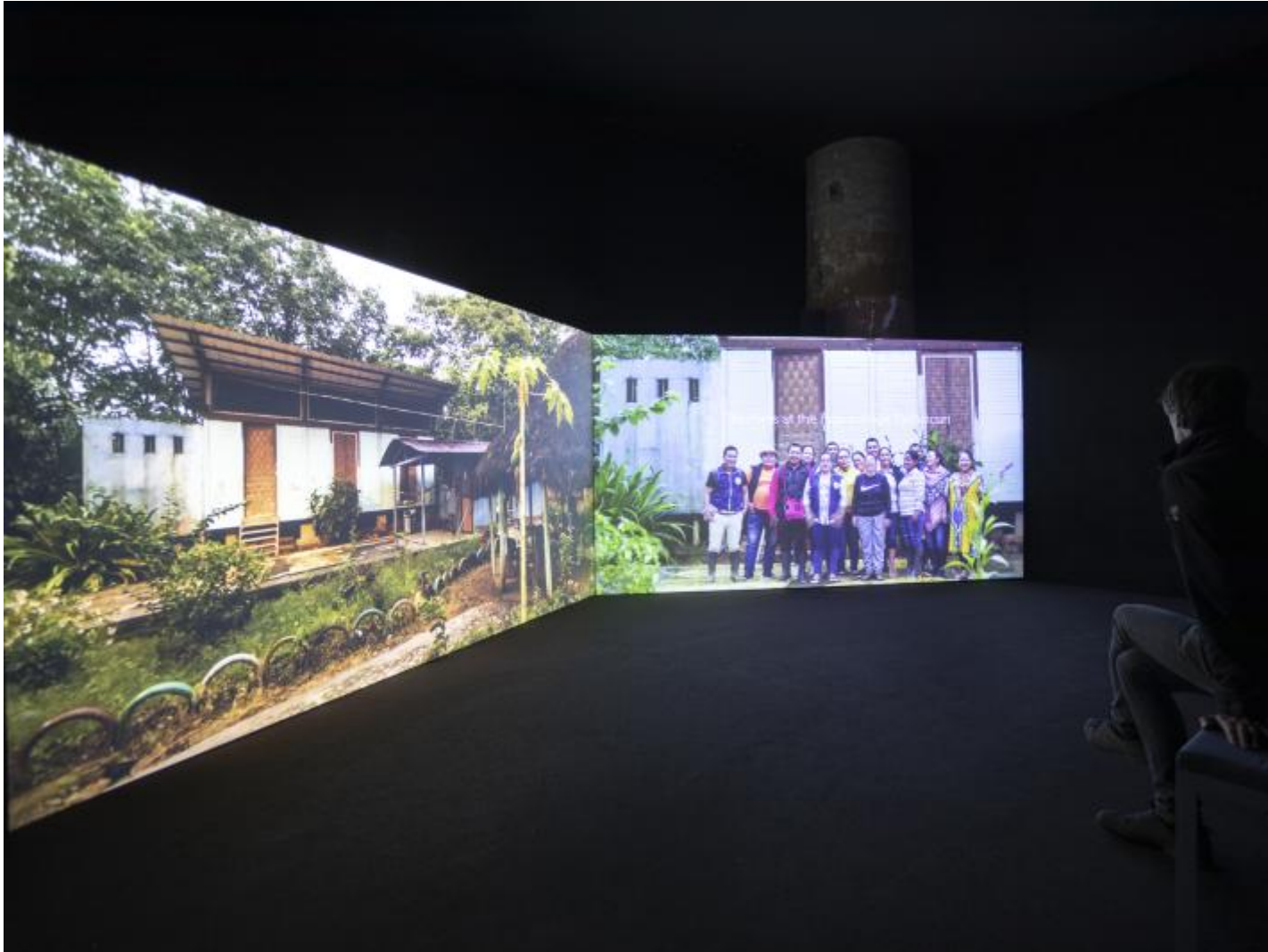
MZO Ursula Biemann_0684 _ 1 8 . Mostra Internazionale di Architettura - La Biennale di Venezia, The laboratory of the Future _ photo by Marco Zorzanello _ Courtesy by La Biennale di Venezia.

ambientale; ma anche perché la condizione attuale del globo è basata sulle massicce attività estrattive di stampo coloniale messe in atto per secoli dall'Occidente tramite l'appropriazione non solo di ogni risorsa disponibile, ma del lavoro collettivo di intere popolazioni e addirittura della soggettività degli individui considerati "altri". Il rischio di estrattivismo, con le sue conseguenze in termini di ingiustizia e squilibrio sociale, non si limita al passato. Estremamente generativo, per esempio, l'approccio di Ursula Biemann con Devenir Universidad : nel video si vedono alcuni membri della comunità Inga della Colombia Sud-Occidentale che raccontano la loro storia territoriale e propongono diversi tipi di apprendimento per le generazioni future. L'artista sintetizza così anni di cooperazione con il popolo Inga; anni finalizzati a co-creare un'università indigena nell'Amazzonia andina.