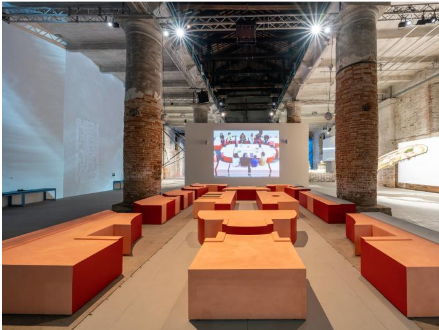
AVZ-DAAR - Alessandro Petti - Sandi Hilal-9818.. Mostra Internazionale di Architettura - La Biennale di Venezia, The laboratory of the Future _ Andrea Avezzu?, Courtesy La Biennale di Venezia.