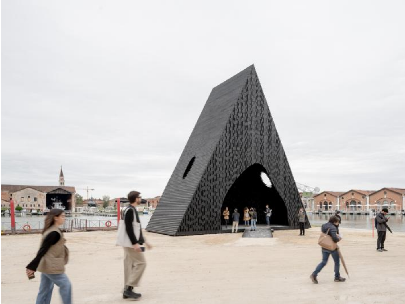
AVZ-Adjaye Associates-7954. Mostra Internazionale di Architettura - La Biennale di Venezia, The laboratory of the Future _ photo by Andrea Avezzu? _ courtesy by La Biennale di Venezia.

un doppio video e serie di disegni e di fotografie, denuncia le umilianti condizioni di vita a cui le popolazioni nomadi, a partire dai Rom, sono forzati, e l'assoluta distanza tra le reali condizioni di vita a cui sono ridotti e le loro aspirazioni, e l'invivibilità degli spazi abitativi che vengono loro offerti, anche in paesi in cui il benessere è diffuso. In particolare il video esposto testimonia di una situazione che ha luogo in Svizzera. In questo caso si tratta di affermare le possibilità di un'architettura di ospitalità ancora tutta a venire e, prima ancora, la necessità di tenere gli occhi aperti sulle criticità del contesto quotidiano in cui si vive.