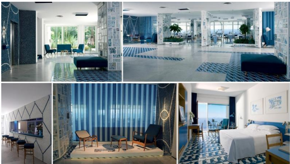
Gio Ponti, Hotel Parco dei Principi, Sorrento 1962. In alto: Viste della hall. In basso: Vista del bar; Dettaglio del percorso espositivo tra la hall e il ristorante. Camera con vista mare.

Nato come uno dei primi design hotel del mondo, il Parco dei Principi di Sorrento si è ormai affermato su scala internazionale come hotel museo di rara e immutata bellezza.