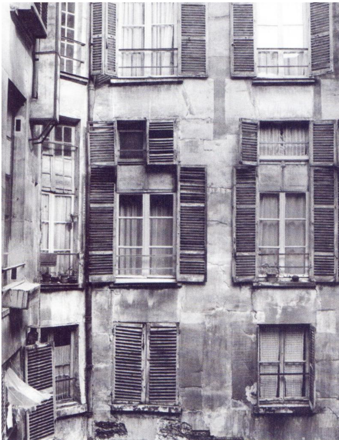
«La grande Chasublerie» in rue Cassette 7 a Parigi ai primi del Novecento: il bilocale abitato da Jarry era quello delle mezze finestre sormontanti il secondo piano.

illimitata, che compenetra ogni branca dello scibile: è in altri termini la Scienza Suprema. Se poi preferiamo una definizione meramente divulgativa, allora può bastare quella snocciolata da Perec: «Tu hai un fratello, e lui ama il formaggio: ecco la fisica. Se tu avessi un fratello, lui amerebbe il formaggio: ecco la metafisica. Tu non hai un fratello, ma lui ama il formaggio: ecco la 'Patafisica».