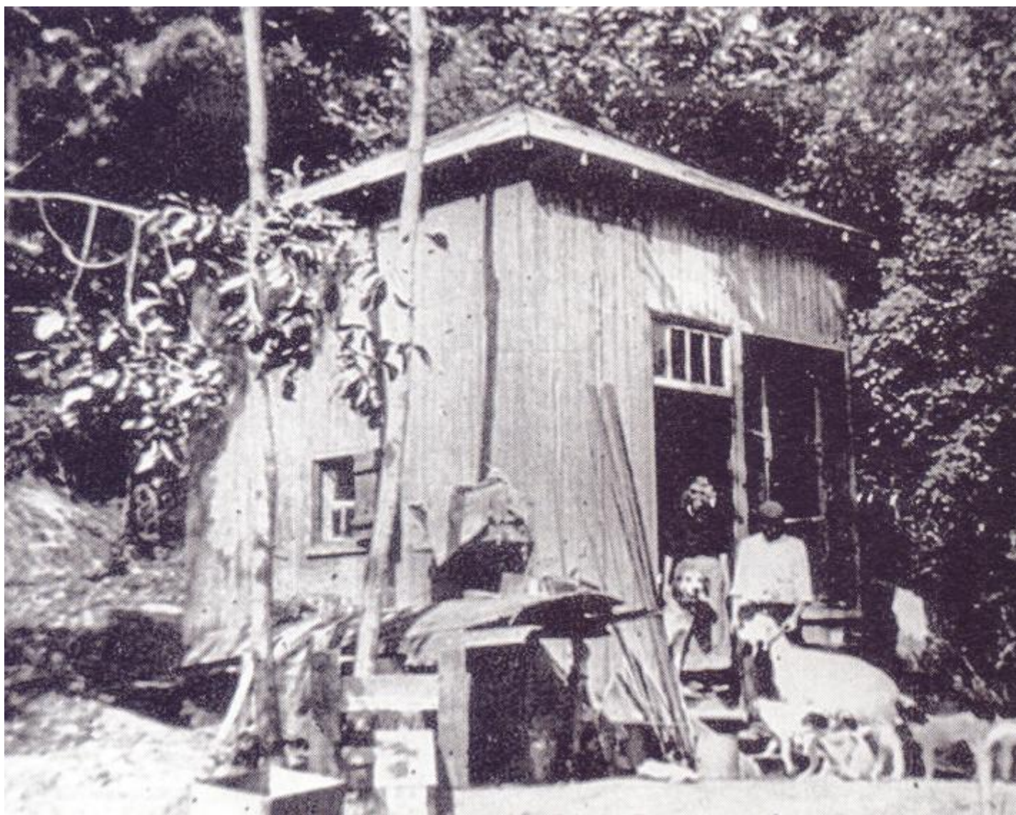
Il «Tripode», baracca di legno edificata nel 1905 da Jarry lungo la Senna, nei pressi della chiesa di Coudray-Montceaux.