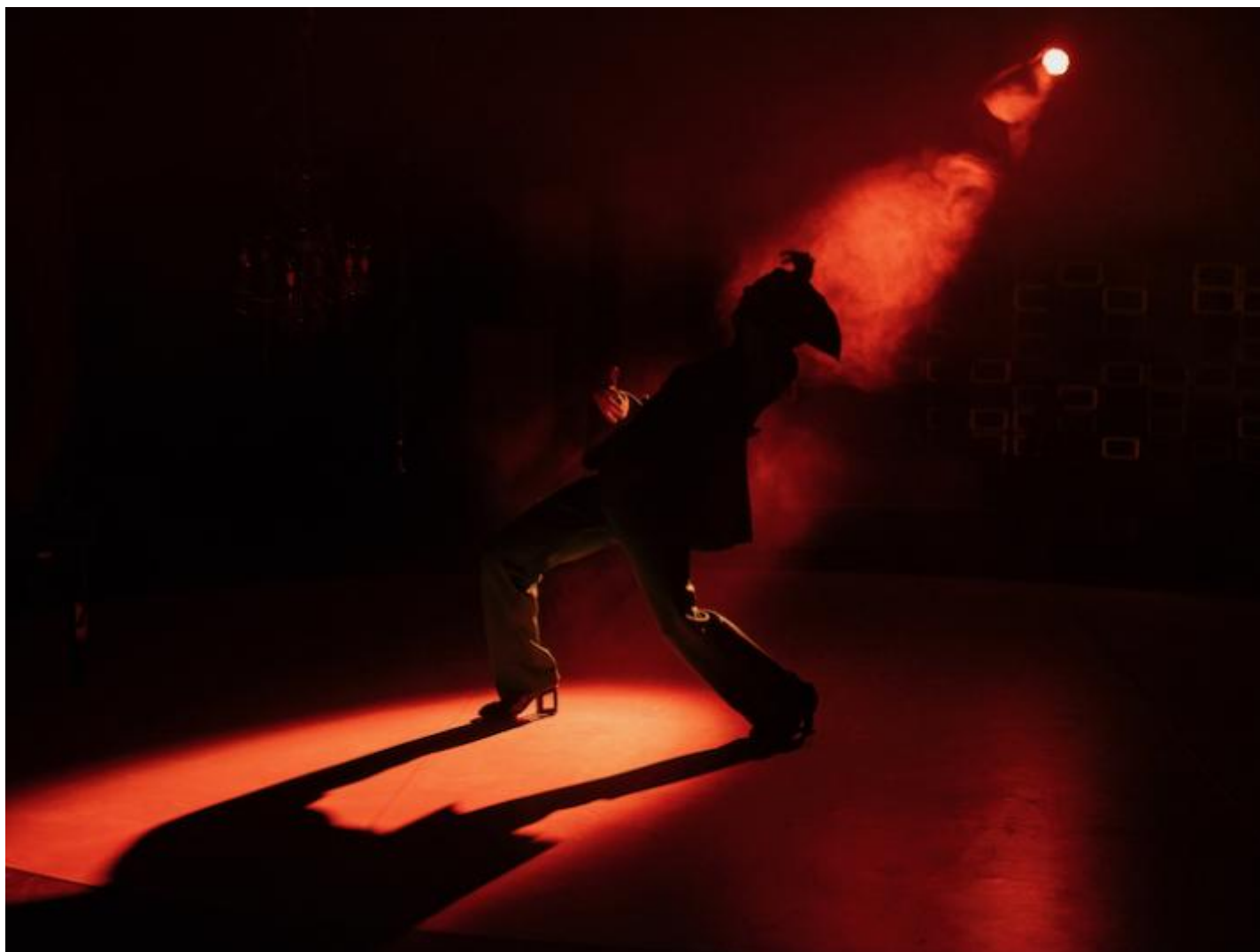
La mano sinistra, ph. Martina Leo.

I vostri sono sempre lavori manifesto, il vostro linguaggio artistico è in questo senso militante. Queste siete voi o il mondo? E in che rapporto siete con il mondo?