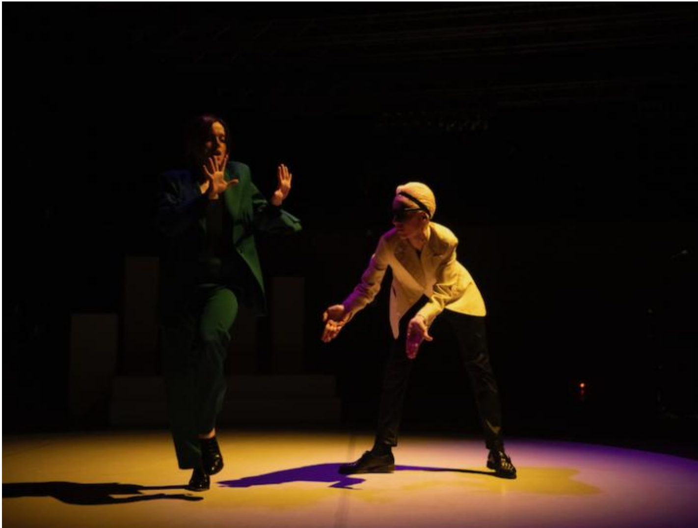
La mano sinistra, ph. Martina Leo.