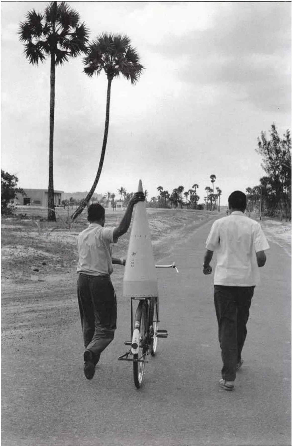
Cartier Bresson, Thumba Beach, 1966.