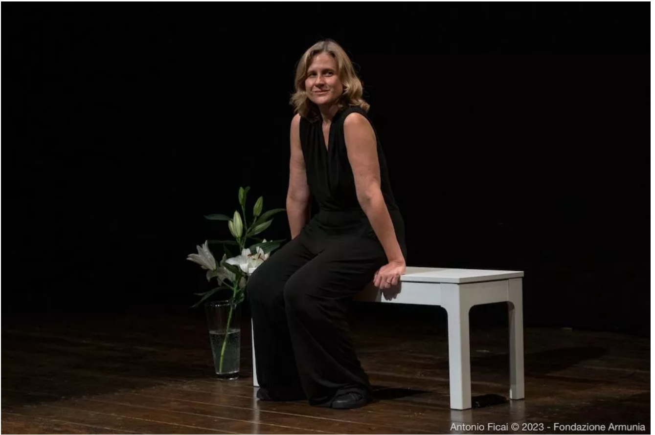
Antonio Fici © 2023 - Fondazione Armunia