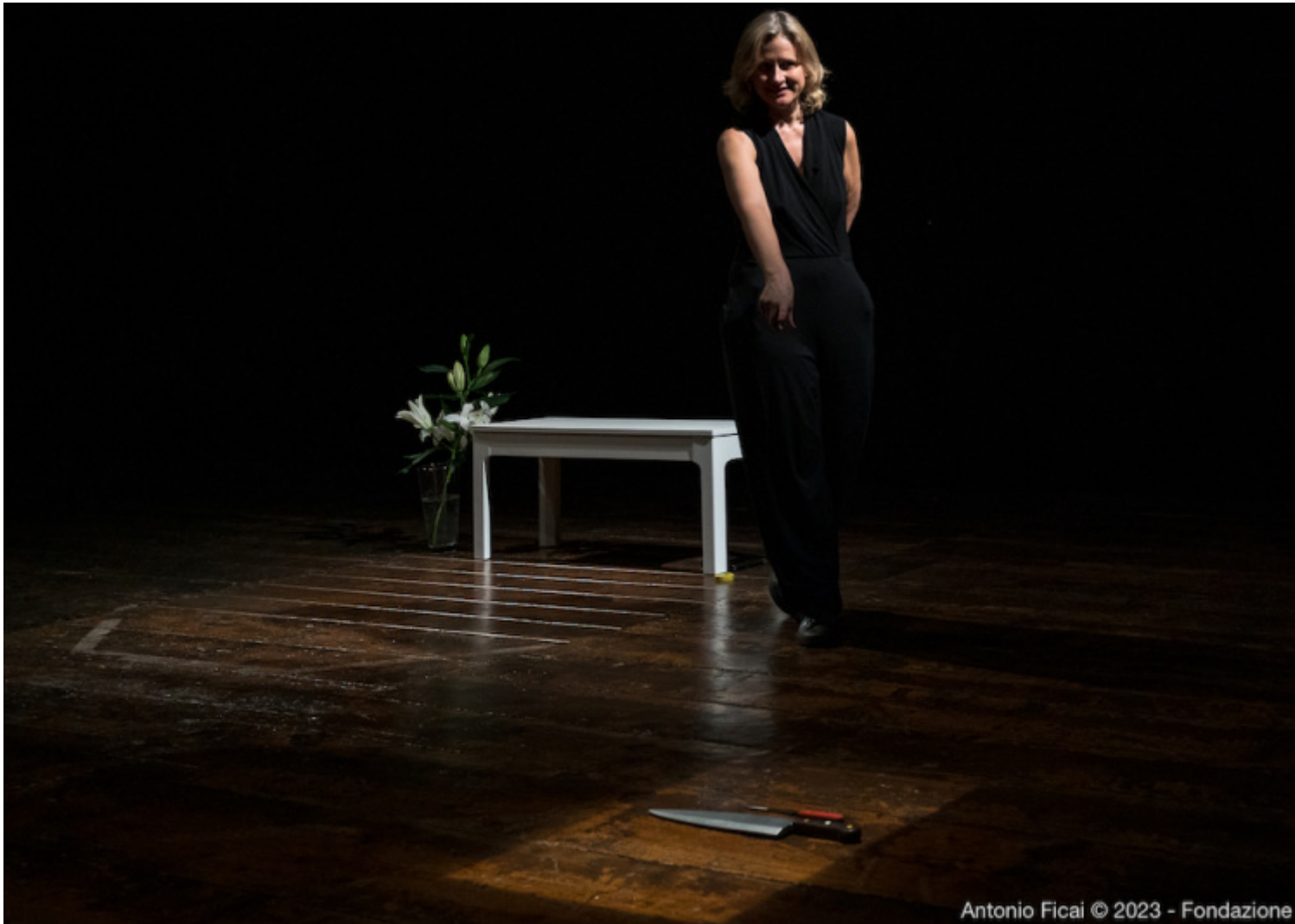
Antonio Ficai © 2023 - Fondazione

autodeterminazioni. Una volta ancora, altre donne e altri uomini decidono e giudicano, commentano e soppesano le motivazioni alla base di un fatto privato, in una chiara manifestazione del dominio esercitato sul corpo della donna. E in questo perturbante gioco, così simile a un innocuo test pubblicato su un settimanale e così violento nelle sue conseguenze, Maternità affonda lo sguardo nelle simbologie, nelle raffigurazioni, nelle interpretazioni che l'esperienza della riproduzione tuttora genera, gettando una sonda nel grumo inesperto di paure e sogni che celiamo dentro di noi: "se voglio figli o meno è un segreto che nascondo a me stessa: è il più grande segreto che nascondo a me stessa", chiosa Sheila Heti, mentre Lagani volge verso di noi lo specchio, illuminandoci il volto e i nostri timori, le nostre esitazioni.