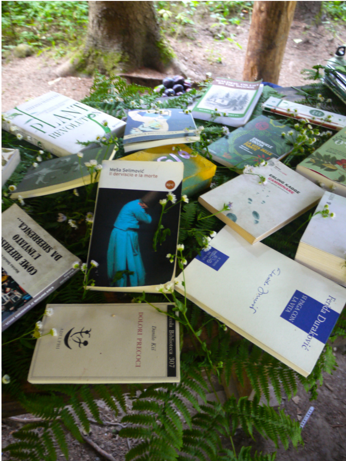
La biblioteca della Jugosfera.