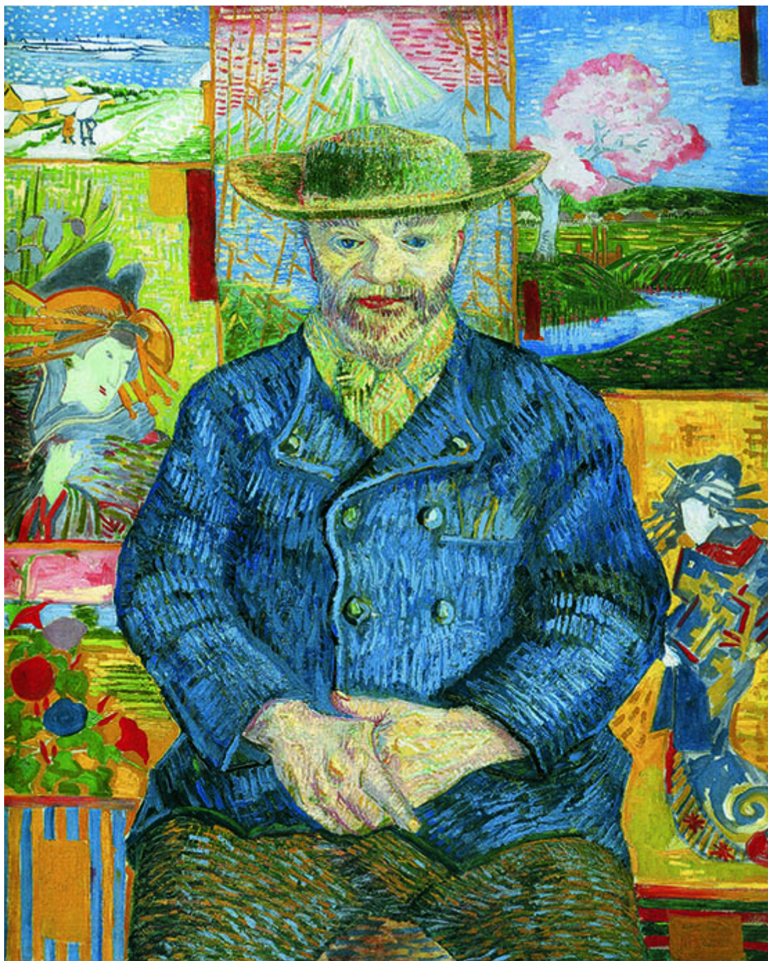
Vincent Van Gogh, Ritratto di Père Tanguy , olio su tela, 1887.

Mi piace concludere queste mie note con la poesia dedicata a Vincent Van Gogh dalla poeta statunitense Robin Morgan. Chi andrà a vedere la mostra milanese, aperta fino al 28 gennaio del 2024, capirà perché. Si intitola "Ai margini del campo di grano".