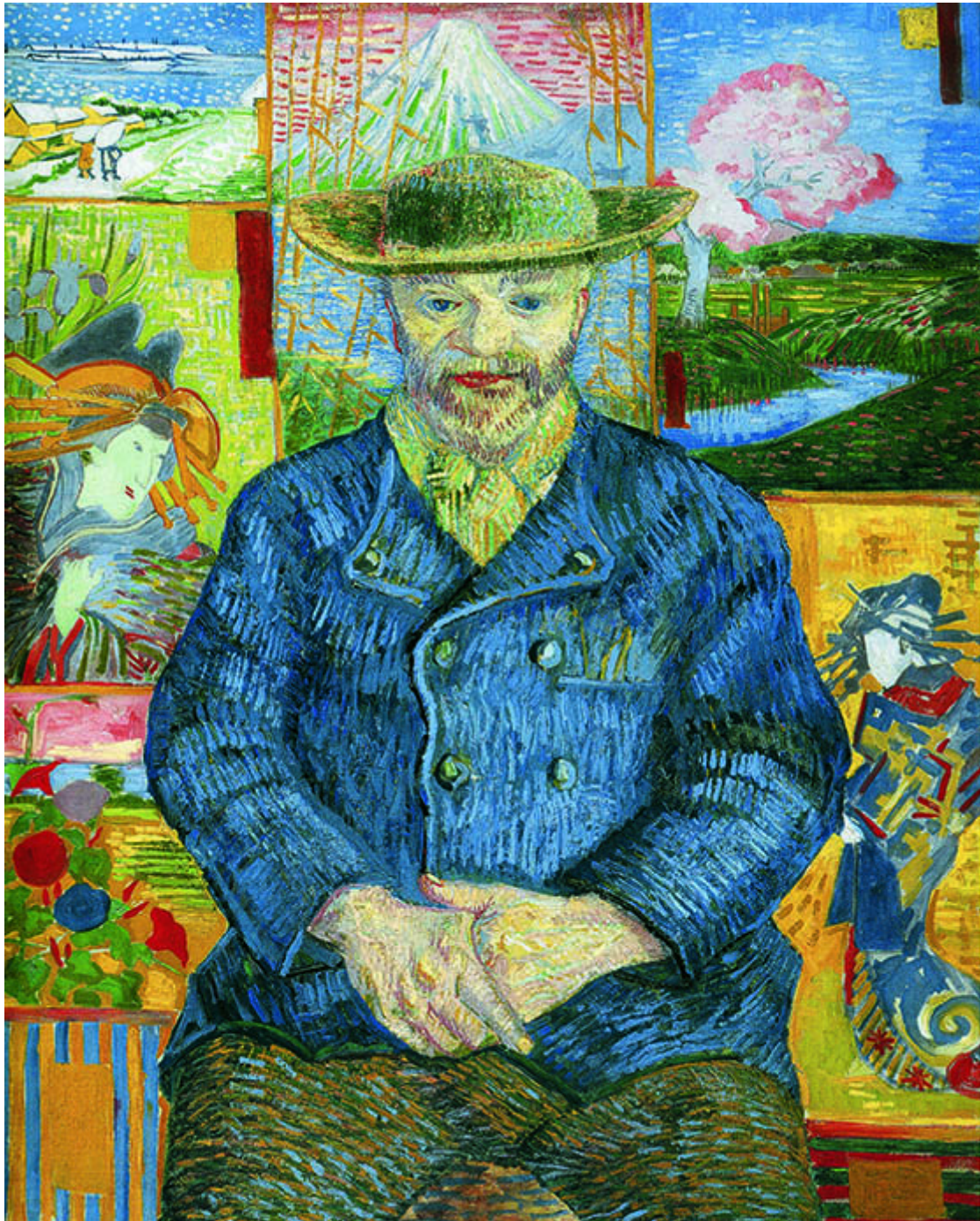
Vincent Van Gogh, Ritratto di Père Tanguy , olio su tela, 1887.