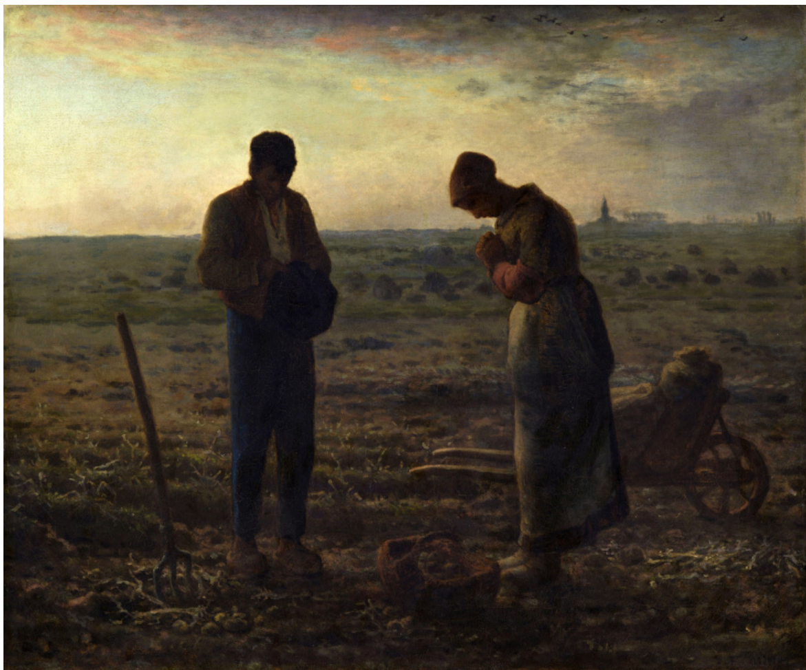
J. F. Millet, L'Angelus della sera , olio su tela, 1858-59.

copia né una replica dell' Angelus di Millet, bensì un gesto interpretativo che ne consente l'intima comprensione, non l'appropriazione e tantomeno il ricalco. Se nella tela di partenza l'orizzonte, spaziale e spirituale (il rapporto tra la terra e il cielo), sfuma all'infinito secondo le leggi della prospettiva classica interferito con creaturale prepotenza dalla presenza umana, nella traduzione che ne fa Van Gogh lo spazio sembra contestare se stesso, ribaltando il vicino nel lontano, il sotto nel sopra, affermando spazialmente il primato della terra e temporalmente una sorta di absolutezza del presente. Le figure umane, benché tuttora accampate al centro della scena, non ne sono più il fulcro. È il punto di vista che è cambiato: rastrello, uomo, cesto, donna, carriola sembrano allinearsi in una catena semantica di pari grado. Adesso, a fare da protagonista, è lo sfondo convertitosi in primo piano. Tra umano e materia non c'è soluzione di continuità.