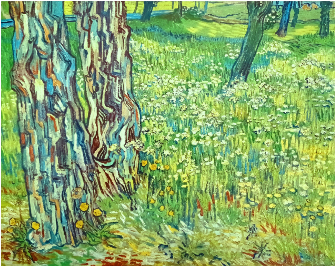
Vincent Van Gogh, Tronchi d'albero nell'erba . olio su tela, 1890.