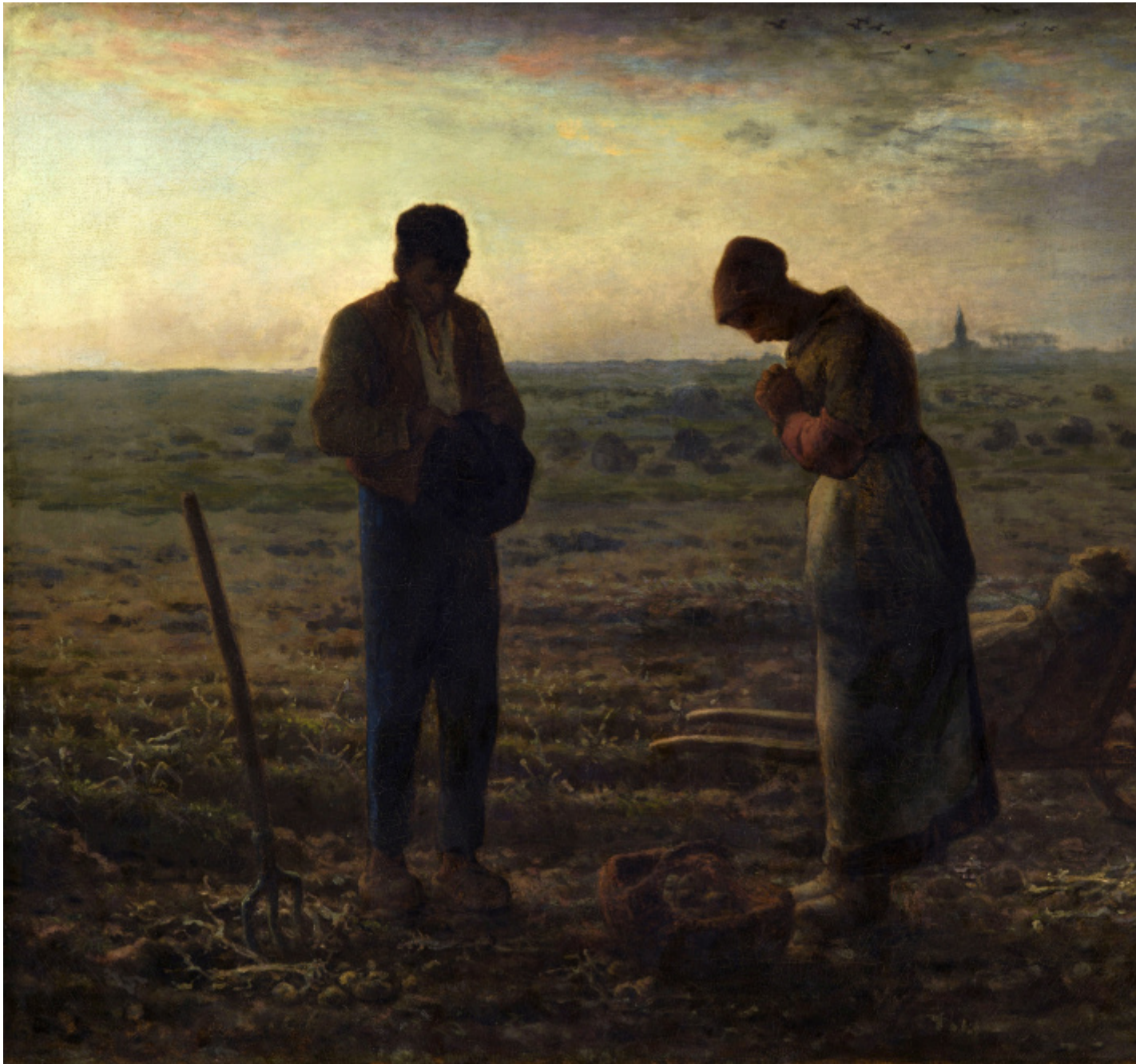
J. F. Millet, L'Angelus della sera , olio su tela, 1858-59.

nella tela di partenza l'orizzonte, spaziale e spirituale (il rapporto tra la terra e il cielo), sfuma all'infinito secondo le leggi della prospettiva classica interferito con creaturale prepotenza dalla presenza umana, nella traduzione che ne fa Van Gogh lo spazio sembra contestare se stesso, ribaltando il vicino nel lontano, il sotto nel sopra, affermando spazialmente il primato della terra e temporalmente una sorta di assolutezza del presente. Le figure umane, benché tuttora accampate al centro della scena, non ne sono più il fulcro. È il punto di vista che è cambiato: rastrello, uomo, cesto, donna, carriola sembrano allinearsi in una catena semantica di pari grado. Adesso, a fare da protagonista, è lo sfondo convertitosi in primo piano. Tra umano e materia non c'è soluzione di continuità.