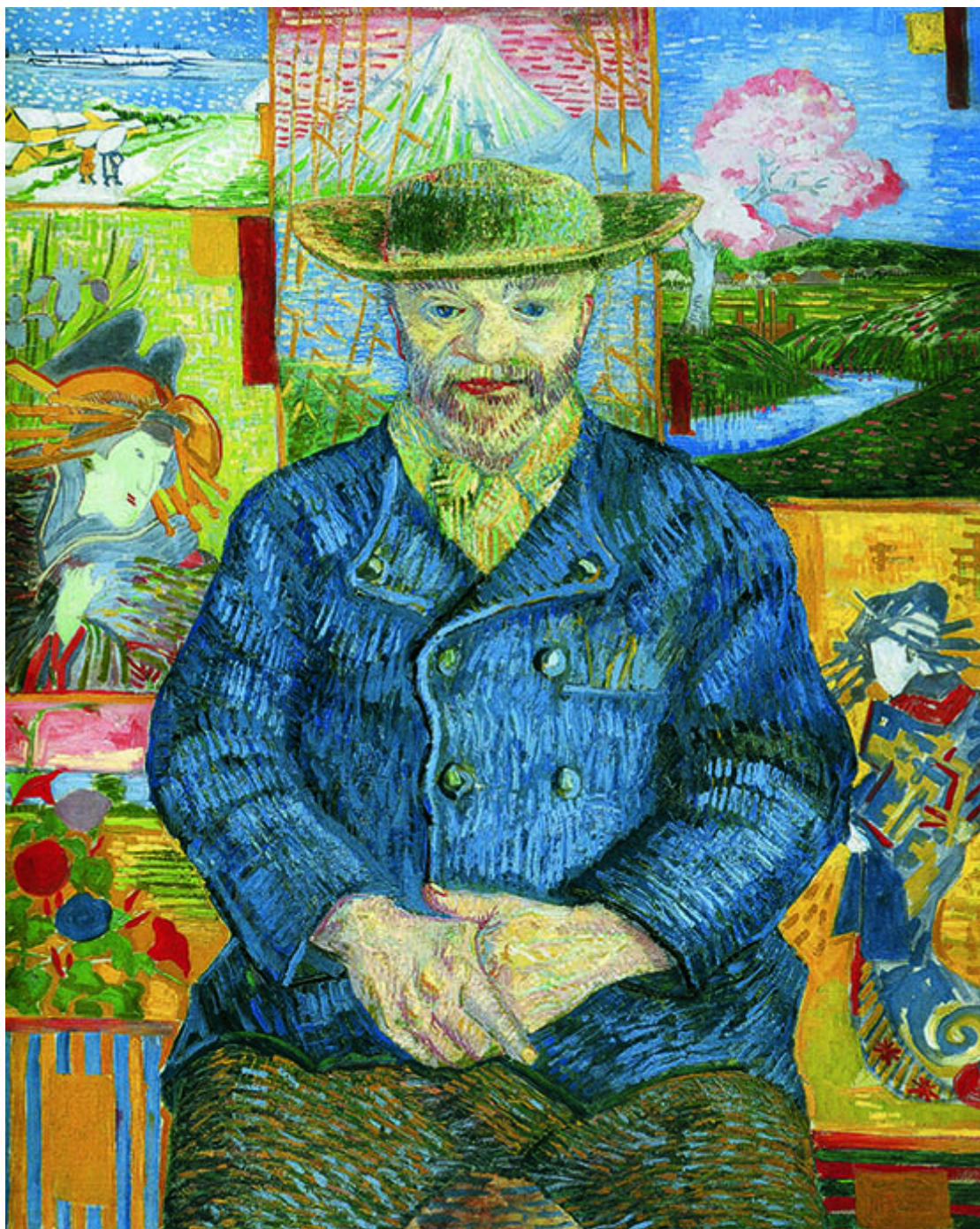
Vincent Van Gogh, Ritratto di Père Tanguy , olio su tela, 1887.

Mi piace concludere queste mie note con la poesia dedicata a Vincent Van Gogh dalla poeta statunitense Robin Morgan. Chi andrà a vedere la mostra milanese, aperta fino al 28 gennaio del 2024, capirà perché. Si intitola "Ai margini del campo di grano".