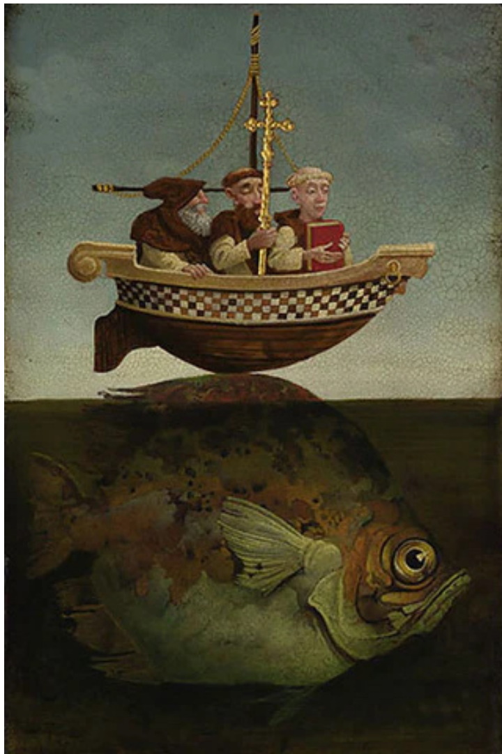
St. Brendan the Navigator, James Christensen.

smarrimento nelle nebbie, di bonaccia e di tempesta e così via. Durante il viaggio, il repertorio del fantastico e del miracoloso verrà scandagliato a fondo, come il mare, e i monaci approderanno e celebreranno Messa sul dorso di una balena dotata di un bel nome proprio (Giasconio); arriveranno a un'isola di grandi uccelli bianchi che si riveleranno angeli che parteciparono alla ribellione di Lucifero macchiandosi solo di lievi colpe, che ci piacerebbe tanto conoscere nel dettaglio, evitando in tal modo la condanna eterna; o un'altra popolata di pecore candide gigantesche perché mai munte o con un albero dai frutti dolcissimi bastevoli a sfamare l'equipaggio per giorni; santi eremiti del mare confinati da decenni su isolette poco più grandi di uno scoglio dove il tempo scorre lento e si invecchia pochissimo.