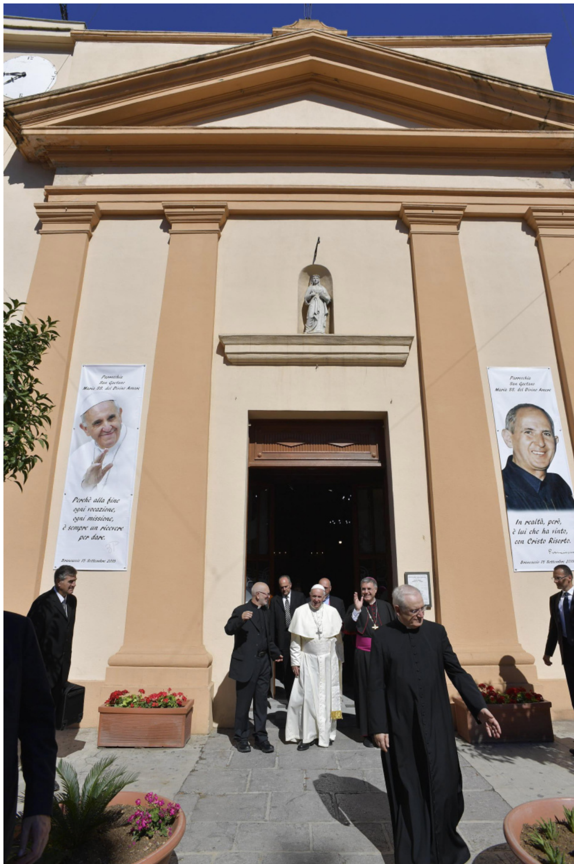
Papa Francesco nella chiesa San Gaetano settembre 2018.

Il libro - breve ma denso, con i disegni di Giuli Tomai e un dizionario delle parole legate al fenomeno mafioso scritte sulla lavagna, da "omertà" a "legalità" - è il